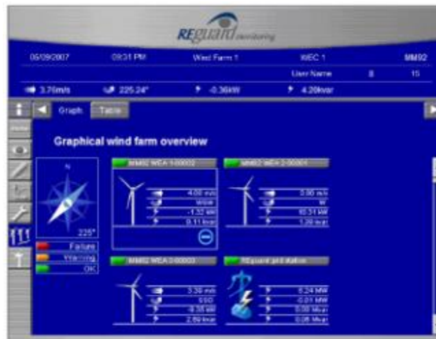
Figura 2 SCADA – Visualizzazione Stato del Parco Eolico.