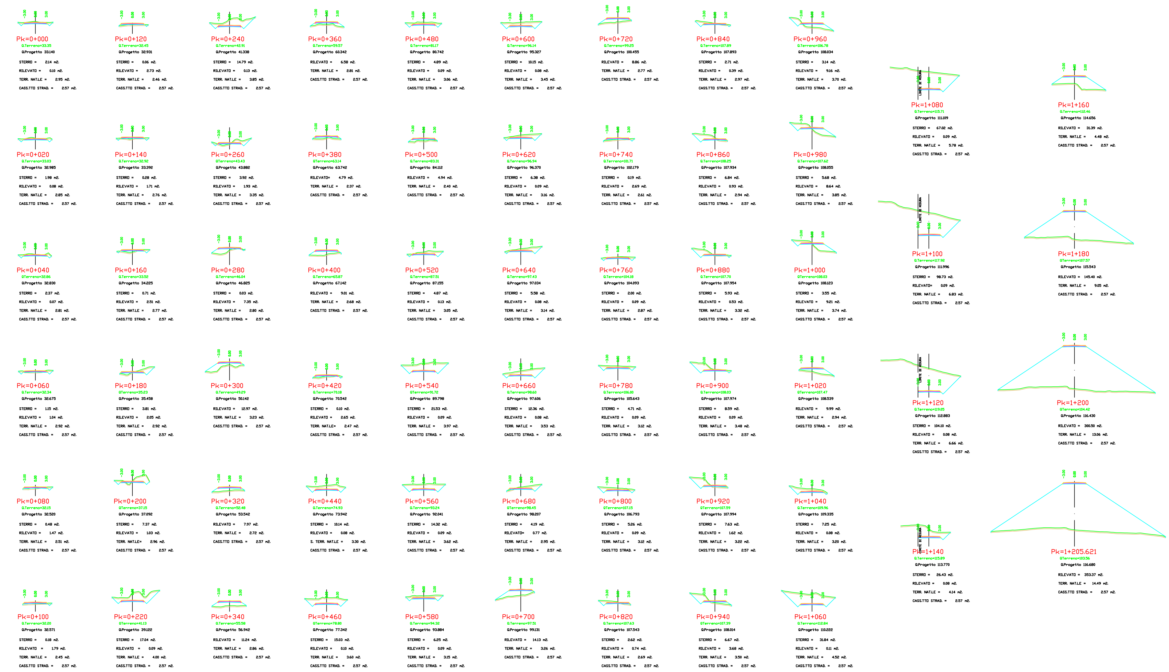
Sezioni Stradali - Pk 0+000 - 1+205.621