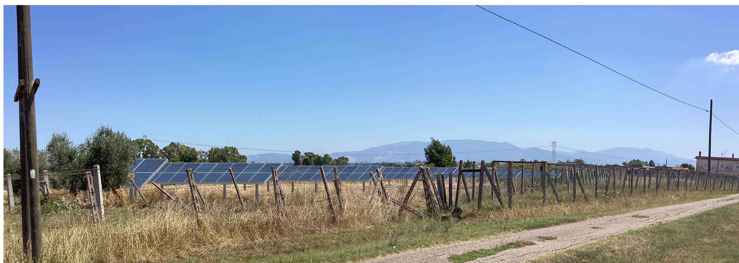
Post operam senza mitigazione