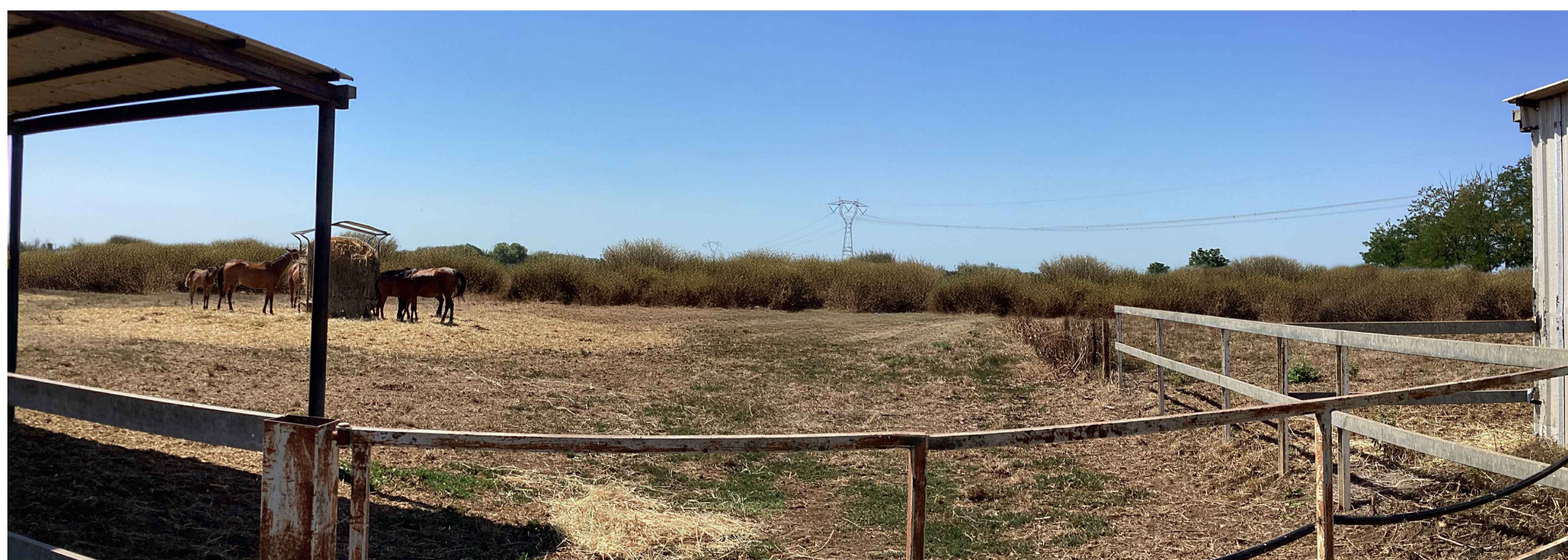
Post operam con mitigazione