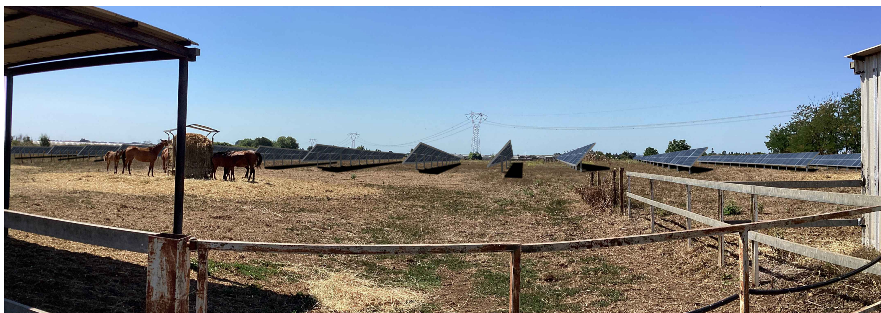
Post operam senza mitigazione