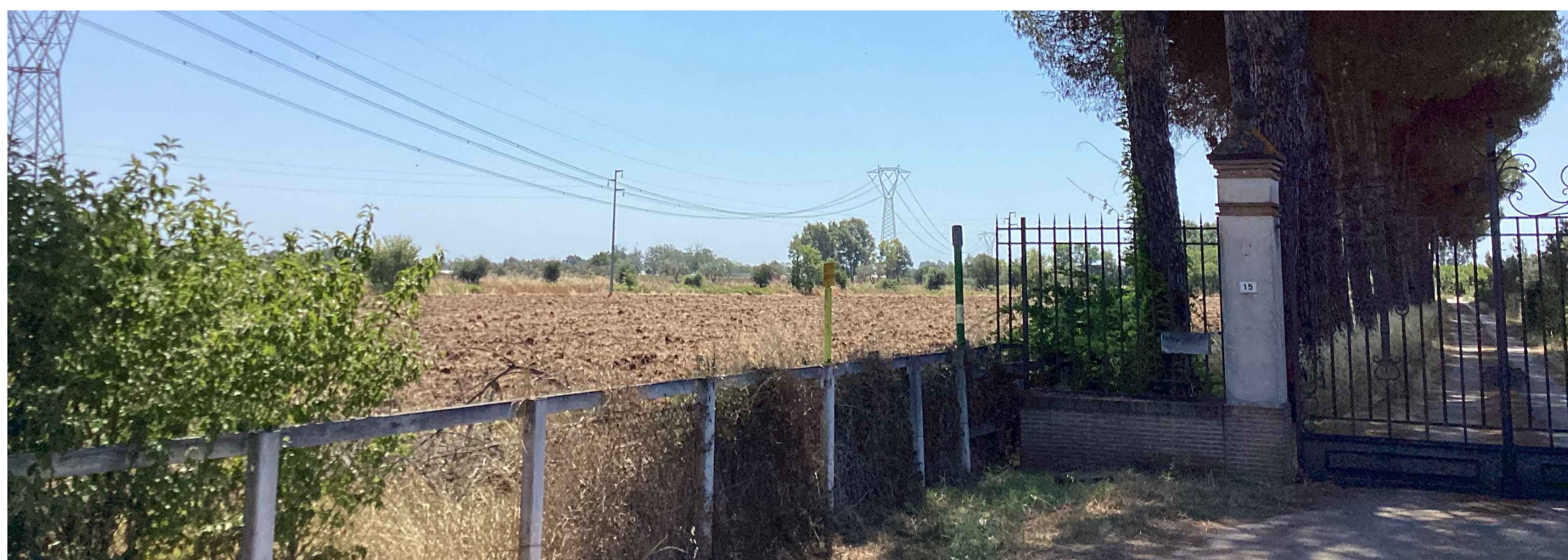
Post operam con mitigazione