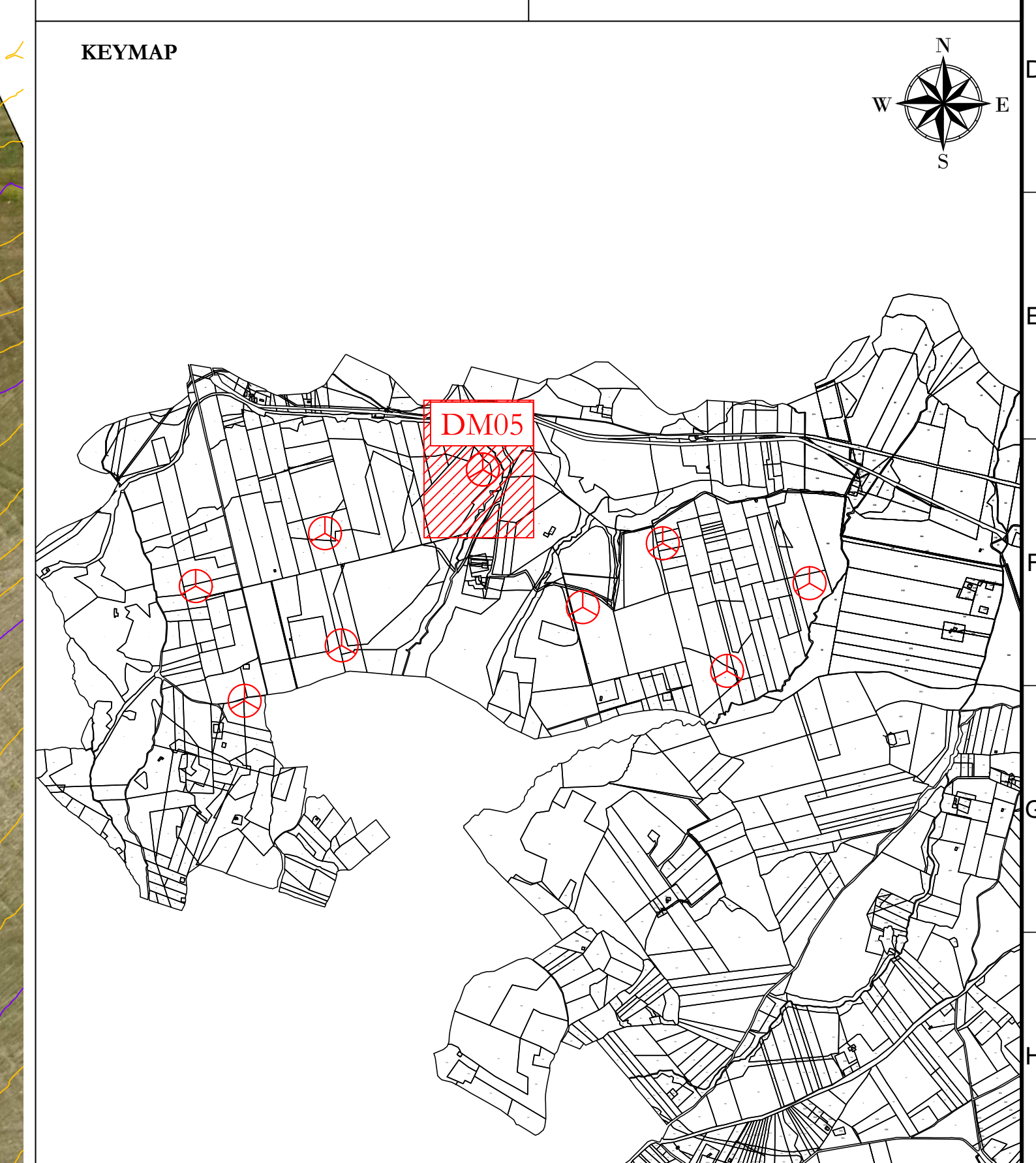
Profilo: Profilo Tracciato DM05 1 di 3 Q.Rif. : 330.00