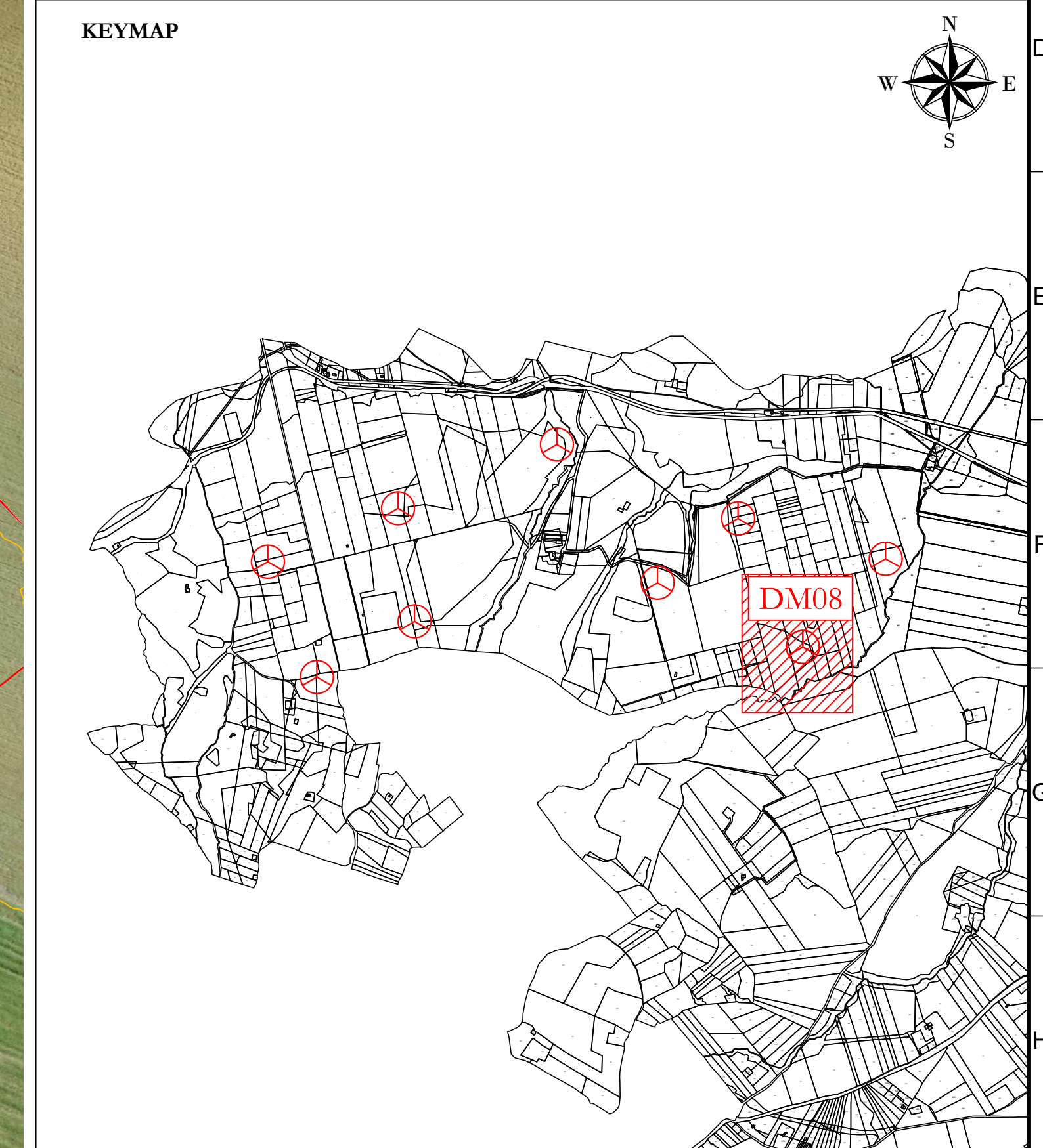
Profilo: Profilo Tracciato DM08 1 di 2 Q.Rif. : 340.00