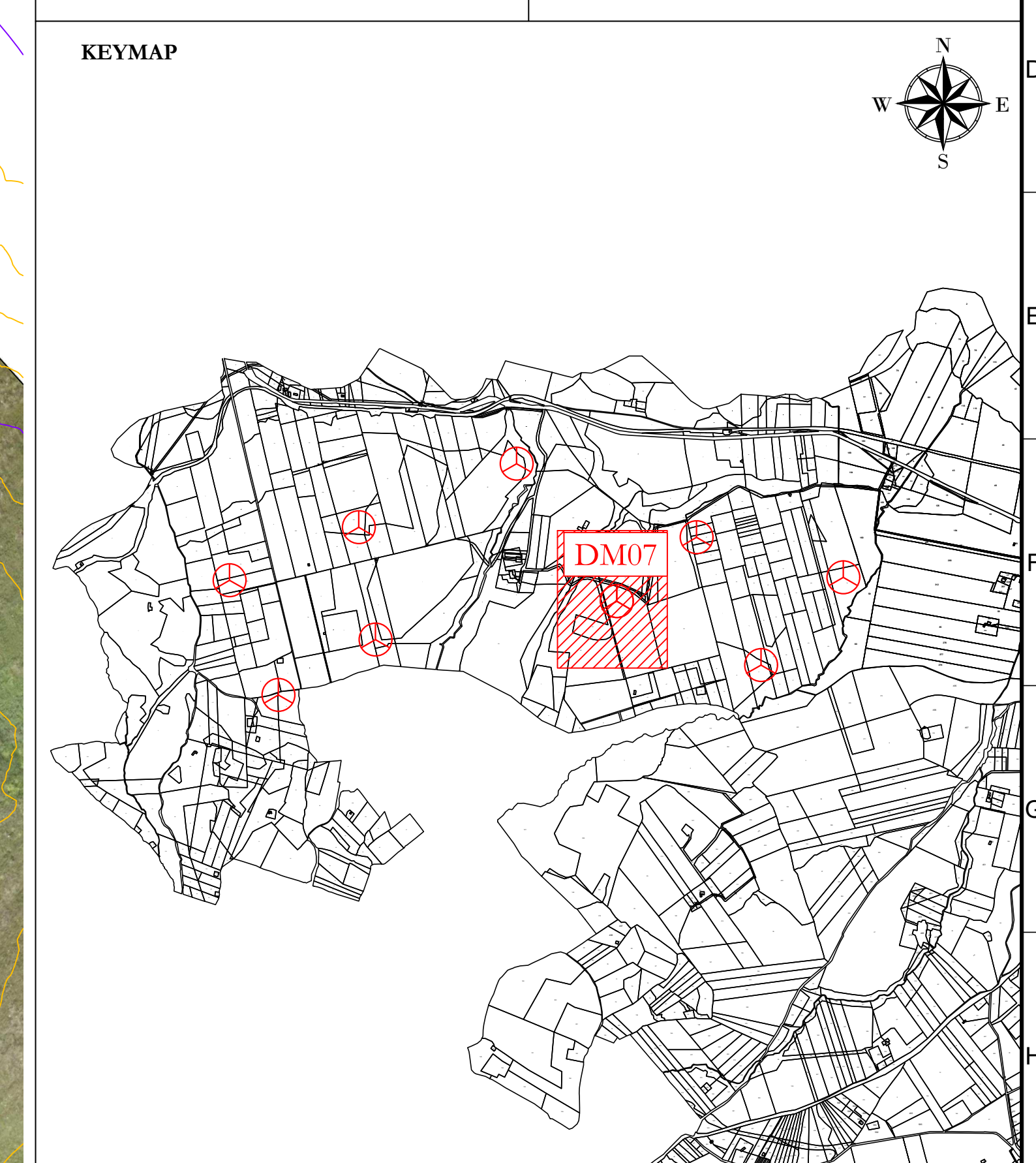
Profilo: Profilo Tracciato DM07 1 di 2 Q.Rif. : 320.00