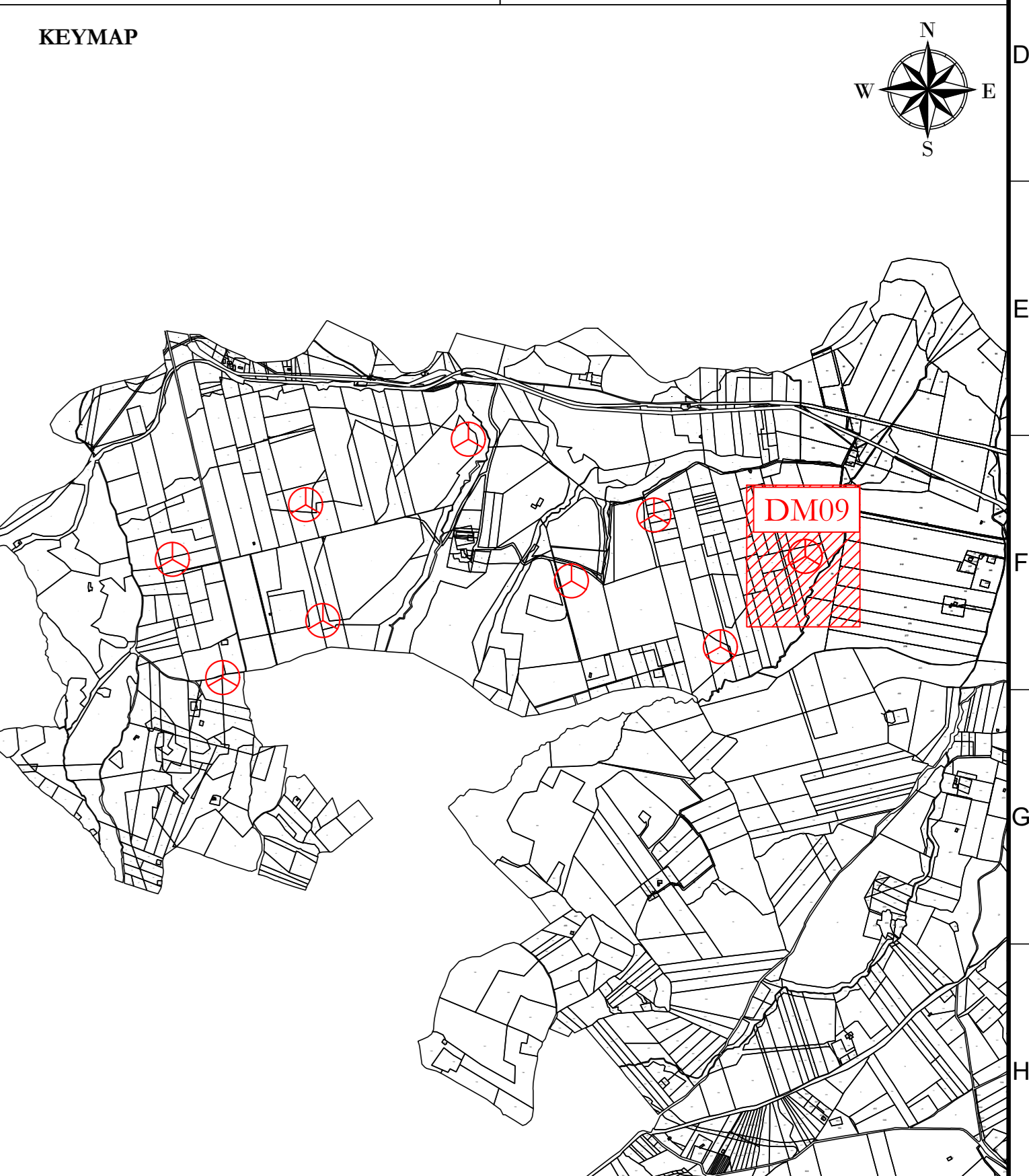
Profilo: Profilo Tracciato DM9 1 di 2 Q.Rif. : 300.00