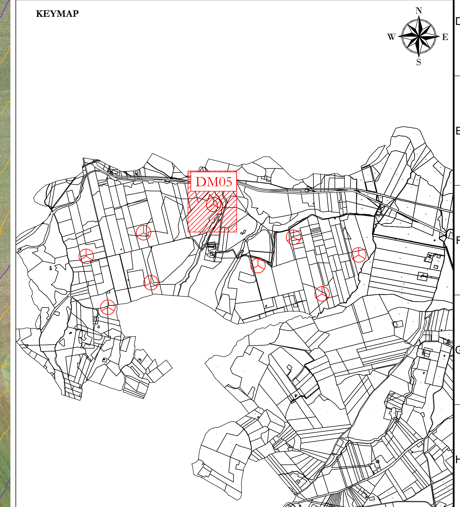
Profilo: Profilo Tracciato DM05 2 di 3 Q.Rif. : 330.00