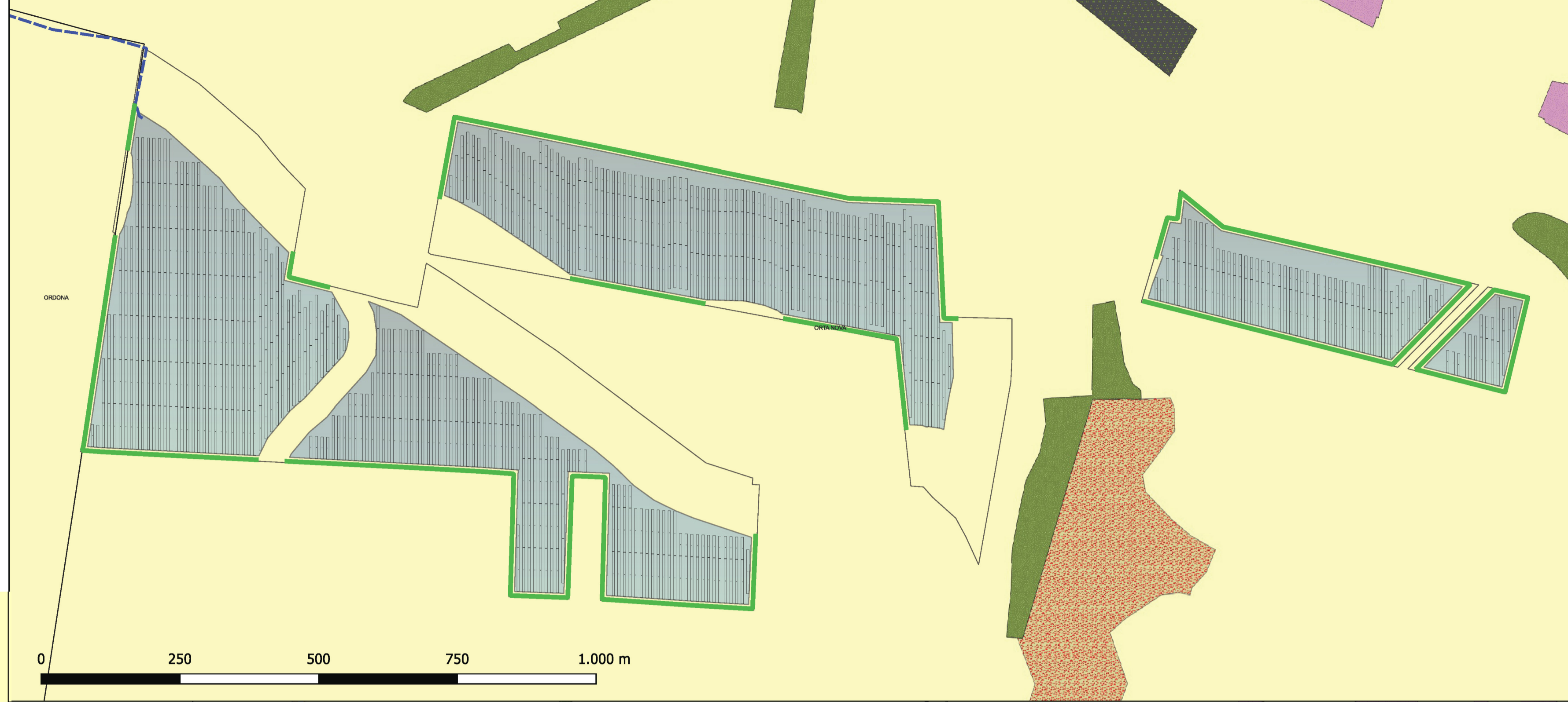
DETTAGLIO AREE IMPIANTO AGRIVOLTAICO ORTA NOVA 36.5 SCALA 1:6.000