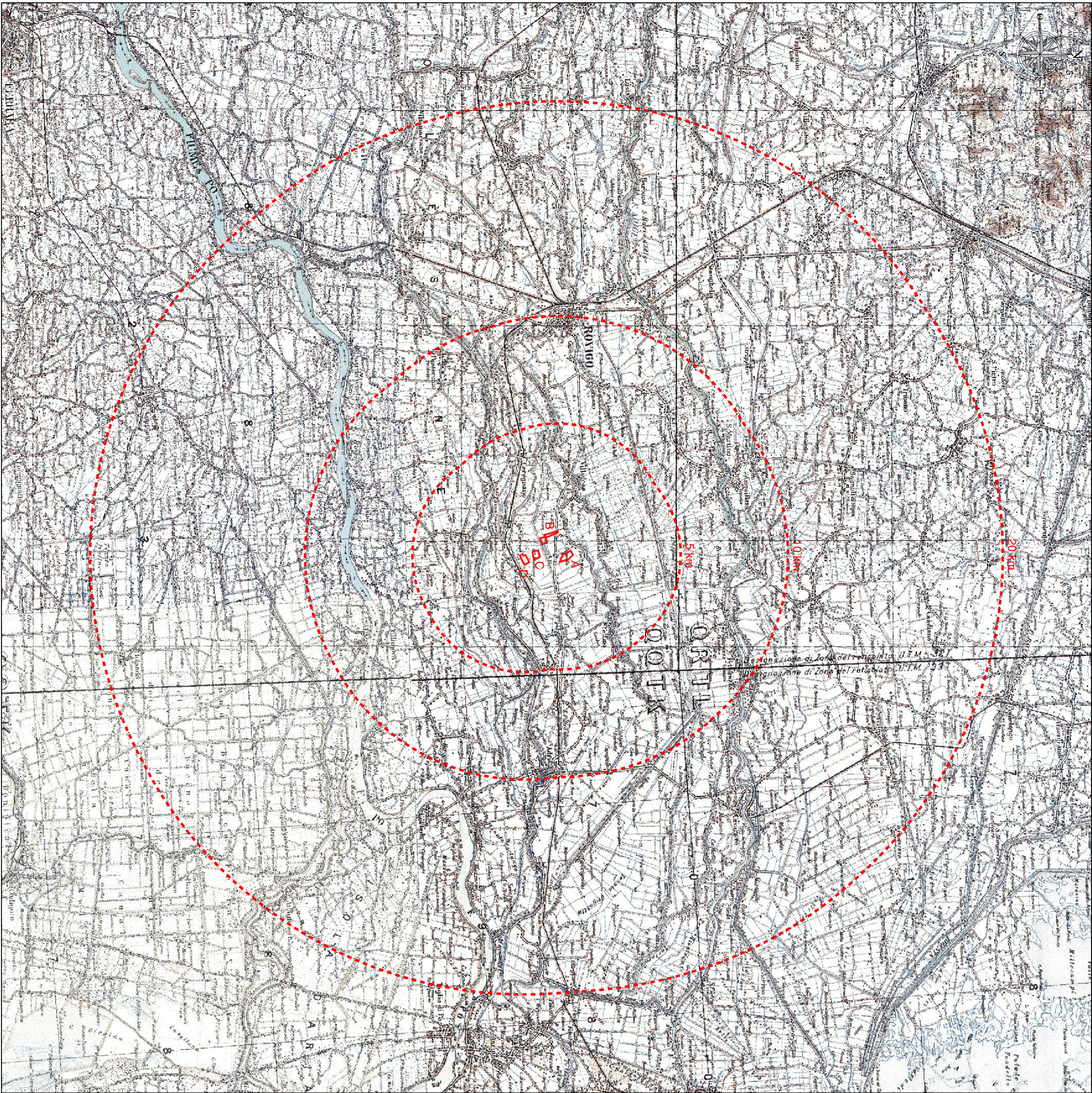
ESTRATTO CARTA D'ITALIA scala 1:100.000