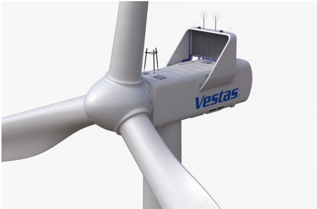
Figura 5 – Rappresentazione della navicella