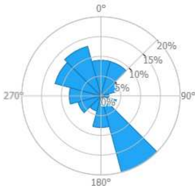
Figura 3 – Distribuzione media del vento nell’area del Progetto

Nel presente documento, per determinare la producibilità attesa dell’impianto “ Mirabile ”, per motivi di prossimità geografica, si assumono i dati di ventosità del sito sopra specificato per tutti gli aerogeneratori di Progetto.