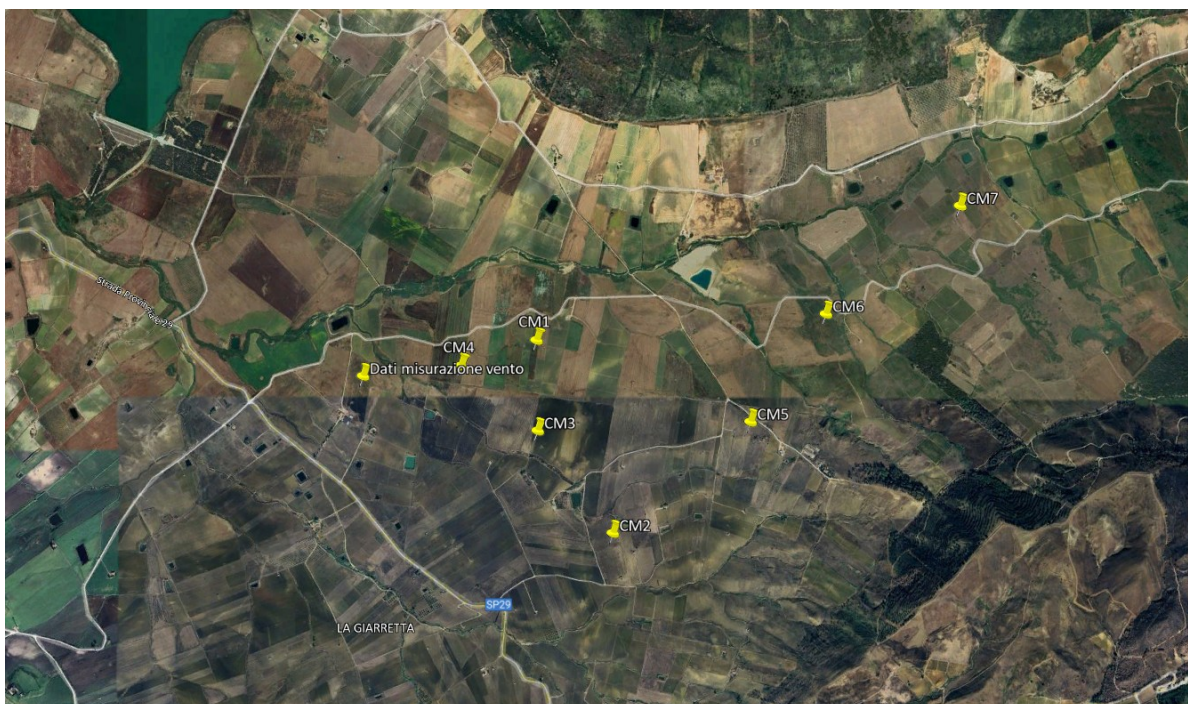
Figura 2 – Localizzazione aerogeneratori Progetto e sito di misurazione dei dati del vento (“ Dati vento ”)

Successivamente, come illustrato nel documento citato, si sono impiegati i dati raccolti dalla stazione di misura anemometrica per stabilire la producibilità annua dell’impianto eolico “ Mirabile ”.