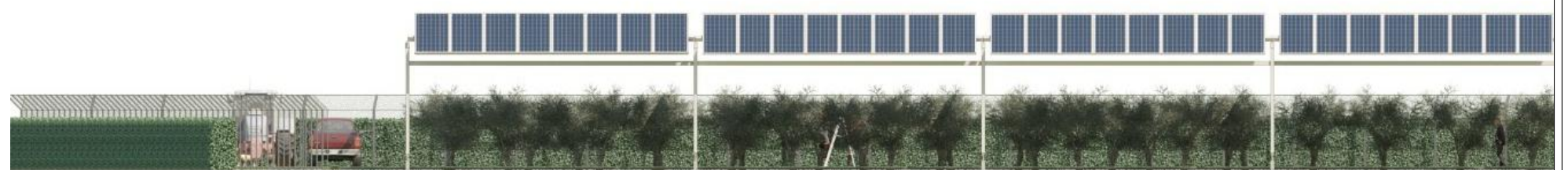
PROSPETTO DETTAGLIO SOTTOCAMPO E