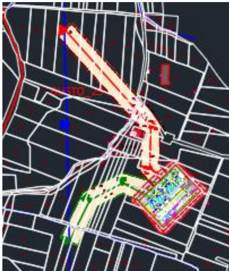
Figura 2: Schema di connessione alla RTN della Futura SE di Buseto 2 150/36kV con doppio entra-esce della Linea 150 kV "Buseto Palizzolo-Fulgatore" e "Buseto Palizzolo-Castellammare del golfo"

(Rif. Dis. S303-GE03-D_ "Planimetria su Ortofoto SE Buseto 2 150/36 kV e raccordi alla linea DT 150kV "Buseto Palizzolo – Fulgatore" e "Buseto Palizzolo – Castellammare Golfo", S303-PR01-D_ "Profilo pianoaltimetrico Linea DT 150 kV "Buseto Palizzolo – Fulgatore" e "Buseto Palizzolo – Castellammare Golfo" - stato di fatto" e S303-PR02-D "Profili pianoaltimetrici raccordi L. 150 kV "Buseto Palizzolo – Fulgatore" e "Buseto Palizzolo – Castellammare Golfo" alla nuova SE 150/36 kV "Buseto 2" - Stato di progetto".