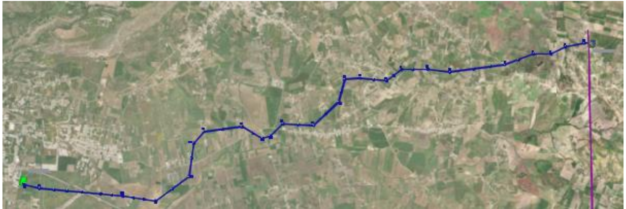
Figura 1: Inquadramento della linea 150 kV "Buseto Palizzolo-CP Ospedaletto"