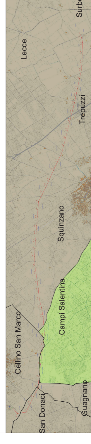
Tavola di insieme con comune interessato