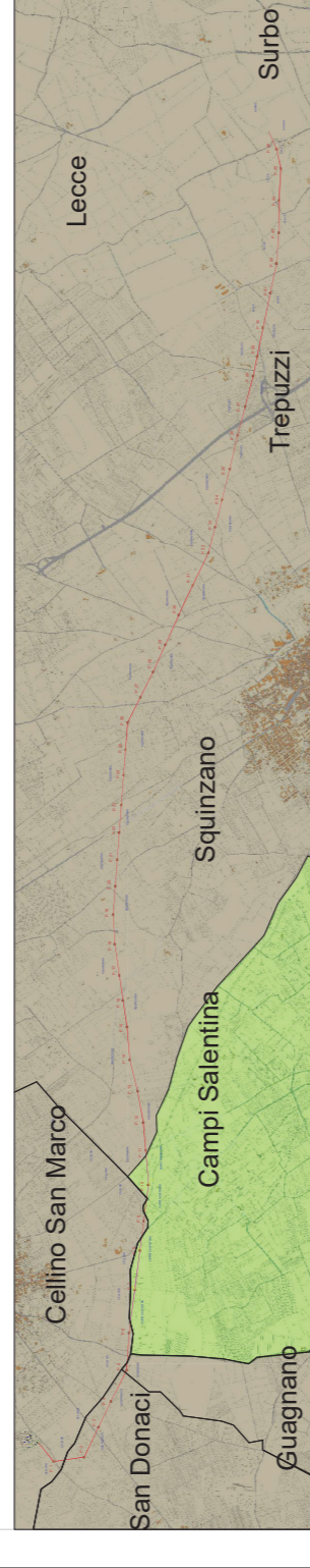
Tavola di insieme con comune interessato

TERNA S.p.A. Viale Egidio Galbani, 70 - 00156 Roma