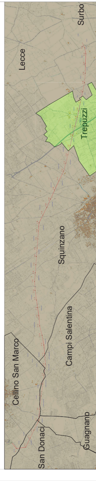
Tavola di insieme con comune interessato