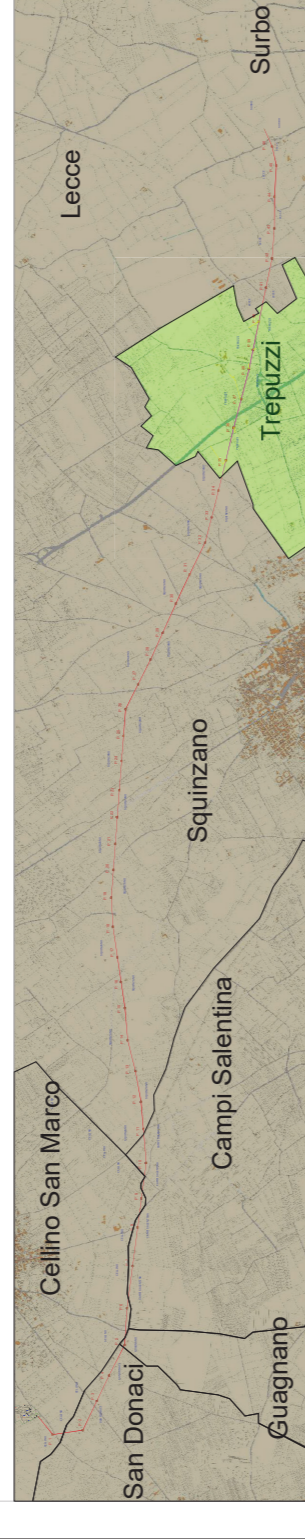
Tavola di insieme con comune interessato