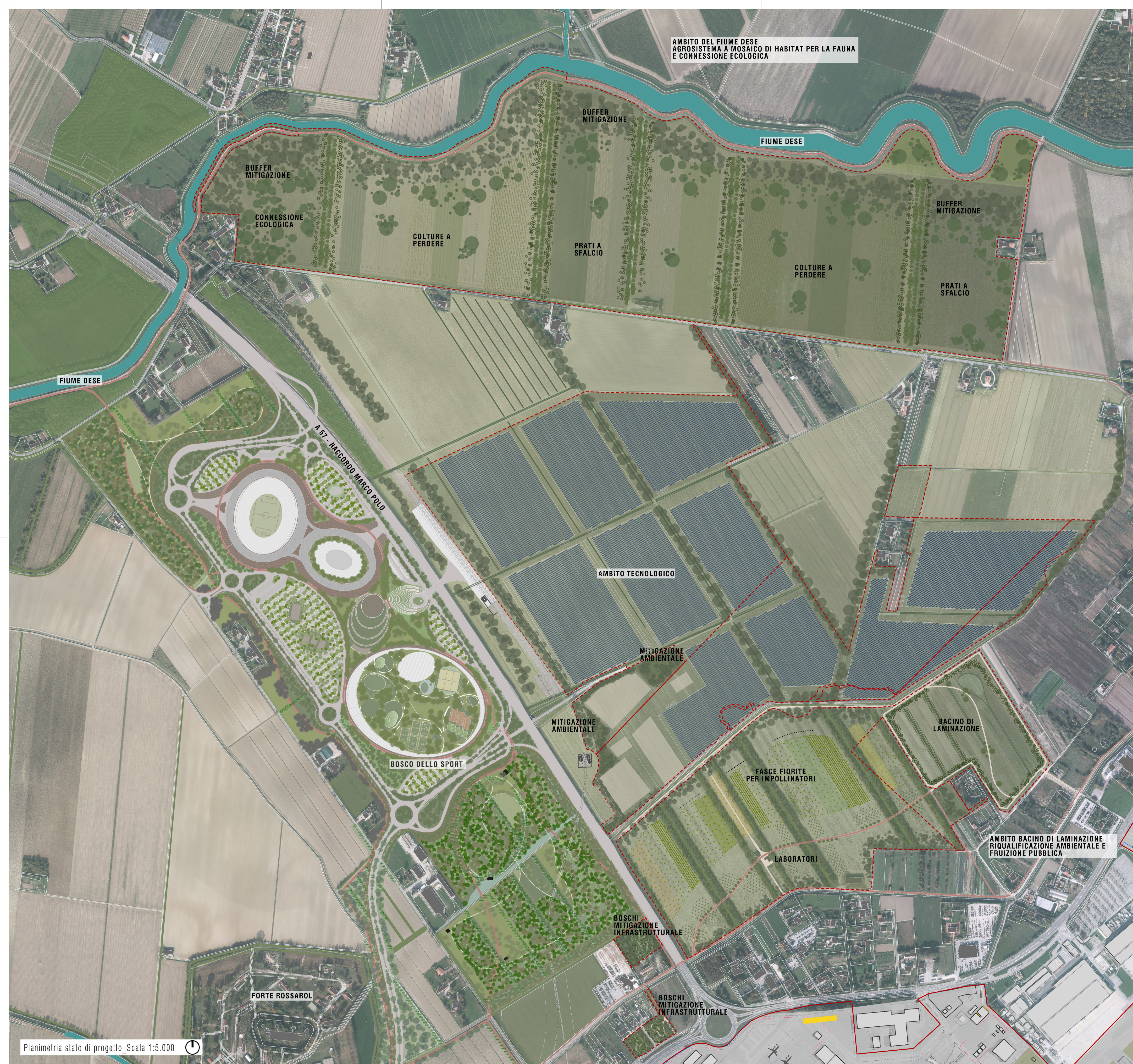
Planimetria stato di progetto_Scala 1:5.000