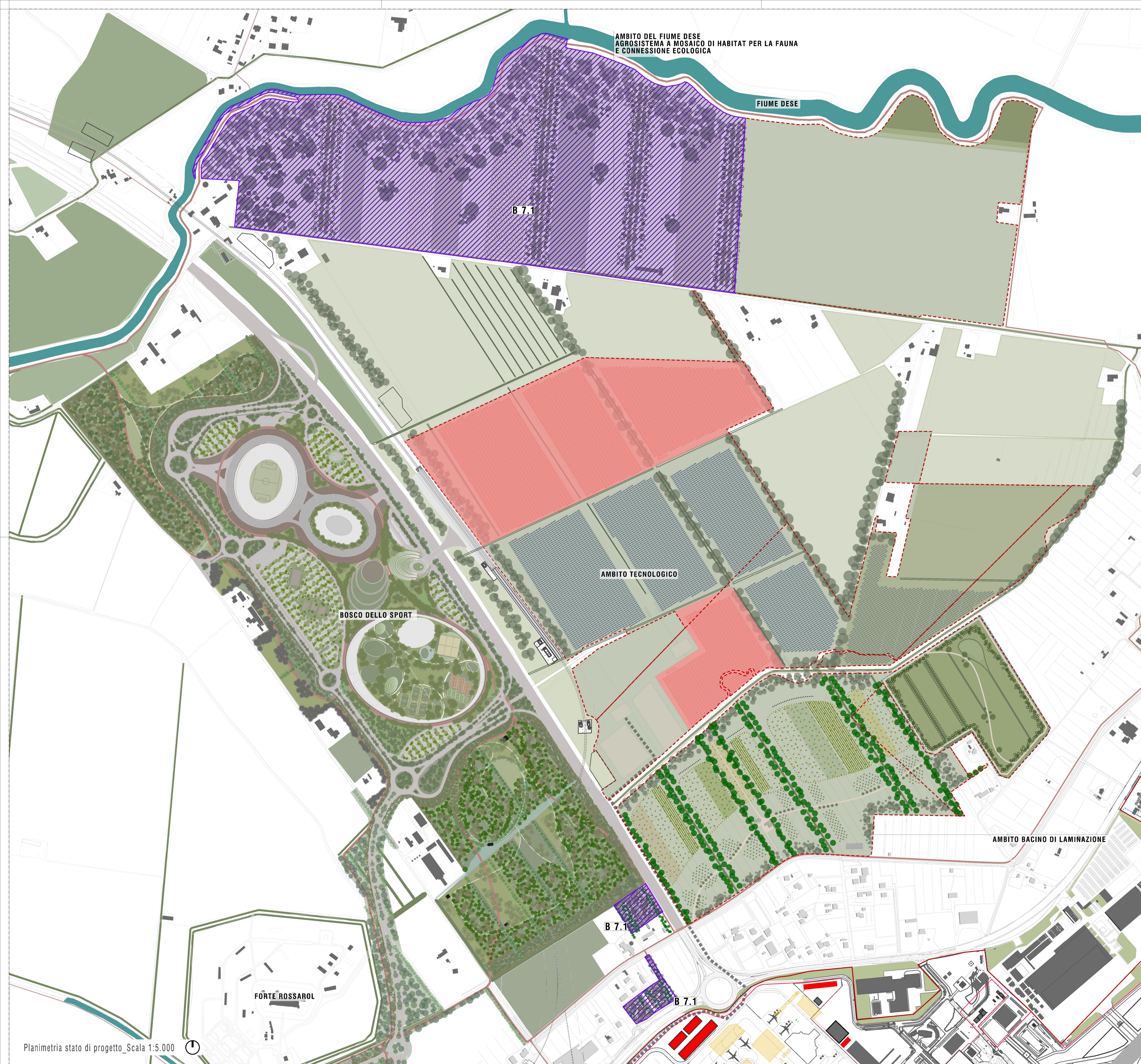
Planimetria stato di progetto_Scala 1:5.000