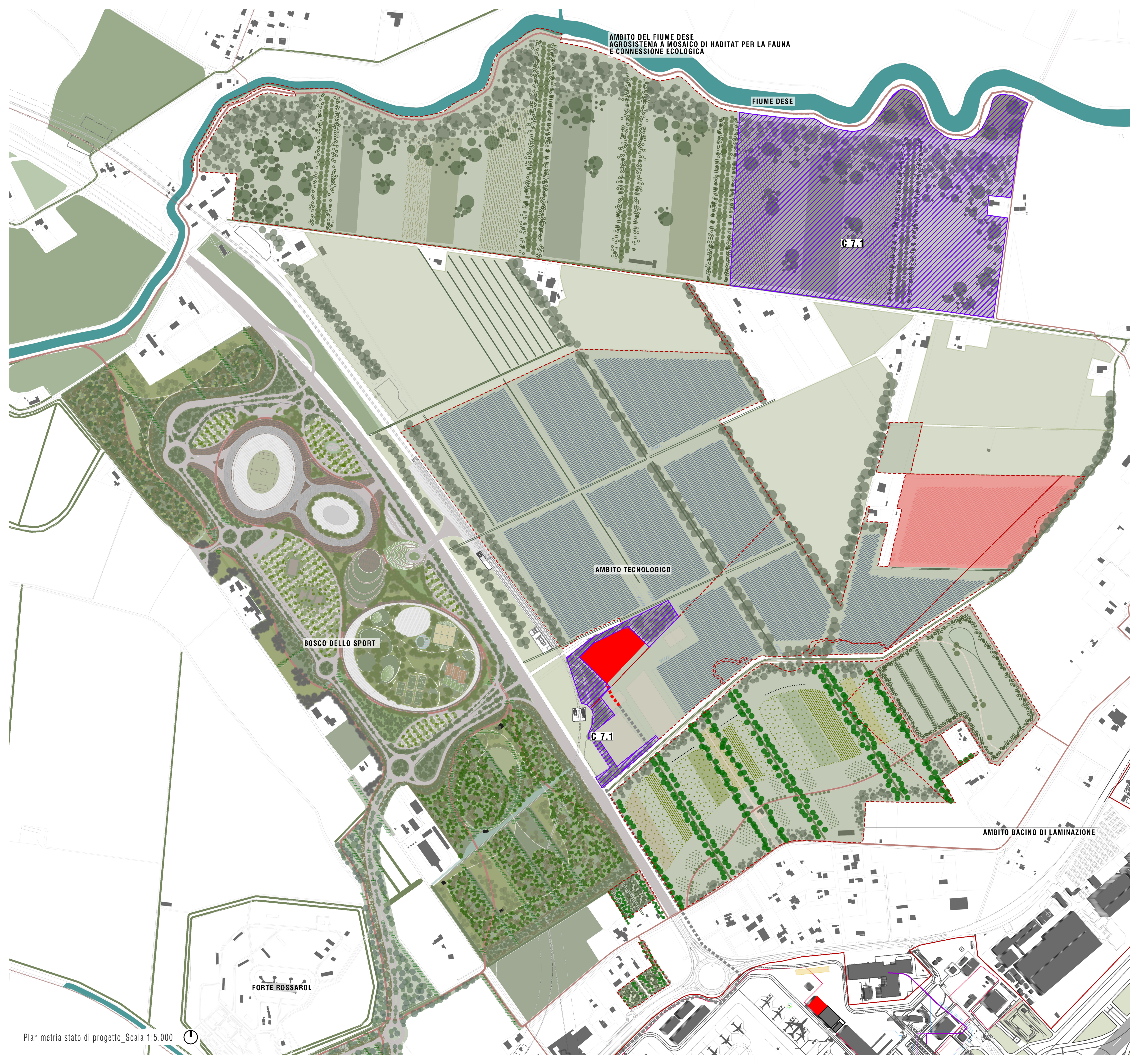
Planimetria stato di progetto_Scala 1:5.000