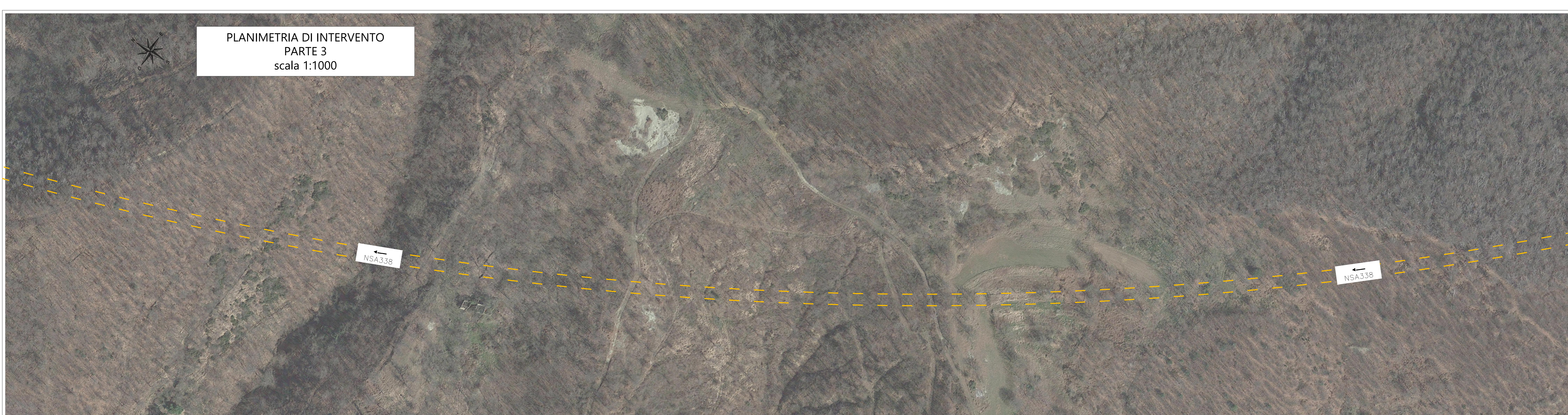
PLANIMETRIA DI INTERVENTO PARTE 3 scala 1:1000

Note: La verifica ultima su: - percorso proposto ed eventuali varianti - le interferenze per i trasporti - le portate dei ponti se richiesti dagli Enti nei nulla osta di transito spetta all'impresa incaricata della movimentazione Le indicazioni presenti nelle tavole grafiche sono connesse con le opere richieste nelle tavole della sezione "interferenze di trasporto" e viceversa