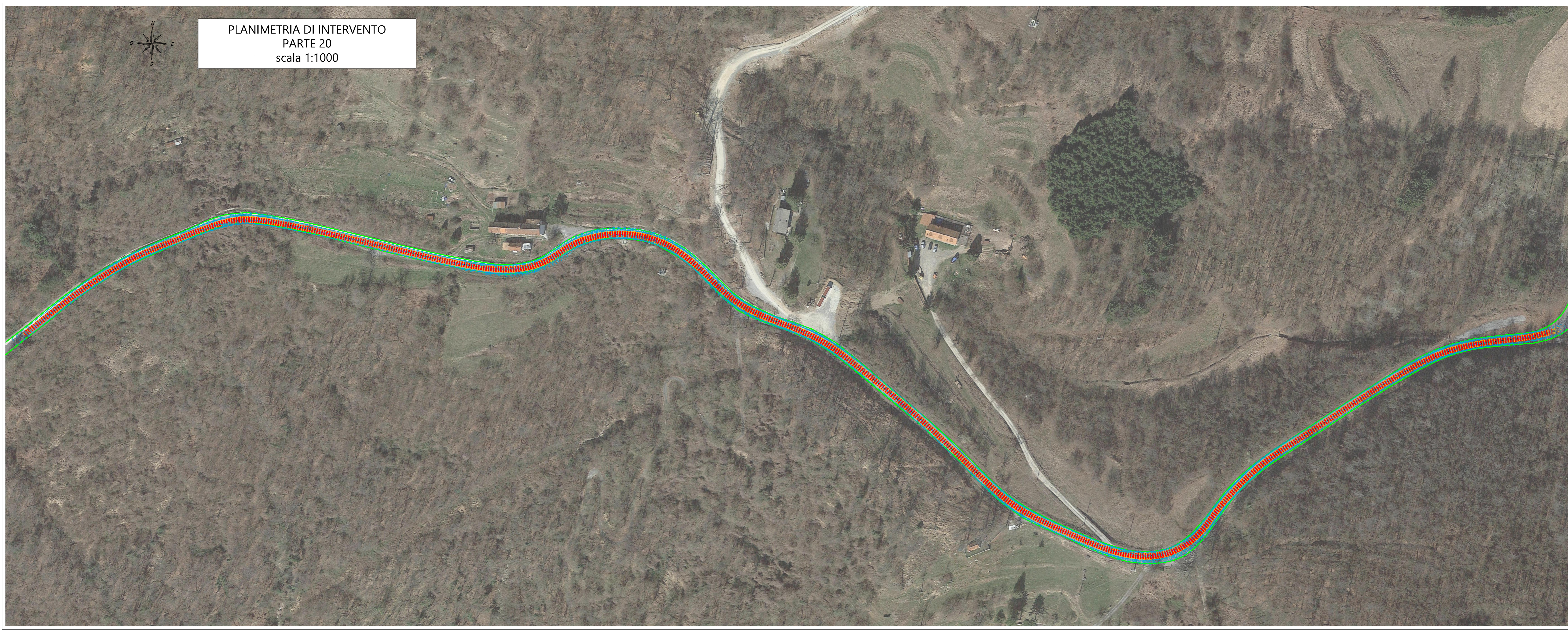
PLANIMETRIA DI INTERVENTO PARTE 20 scala 1:1000

Note: La verifica ultima su: - percorso proposto ed eventuali varianti - le interferenze per i trasporti - le portate dei ponti se richiesto dagli Enti nei nulla osta di transito spetta all'impresa incaricata della movimentazione Le indicazioni presenti nelle tavole grafiche sono connesse con le opere richieste nelle tavole della sezione "interferenze di trasporto" e viceversa