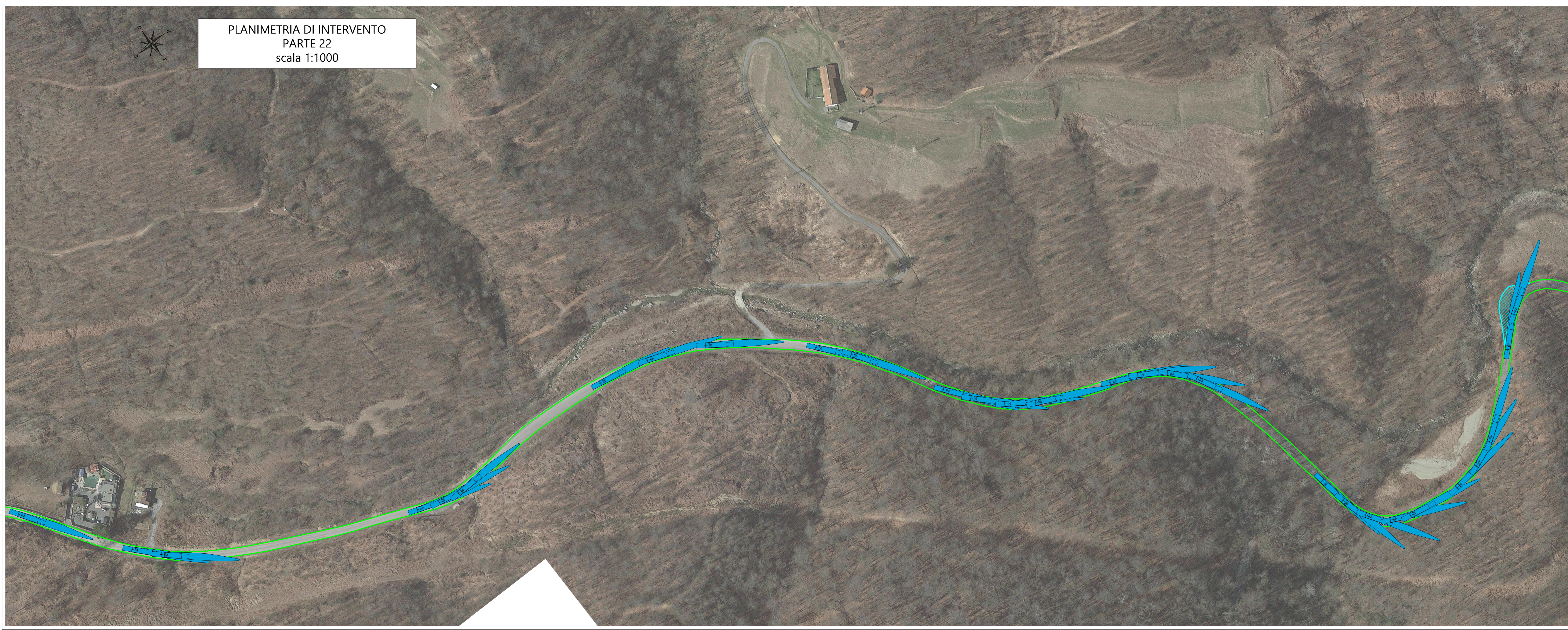
PLANIMETRIA DI INTERVENTO PARTE 22 scala 1:1000