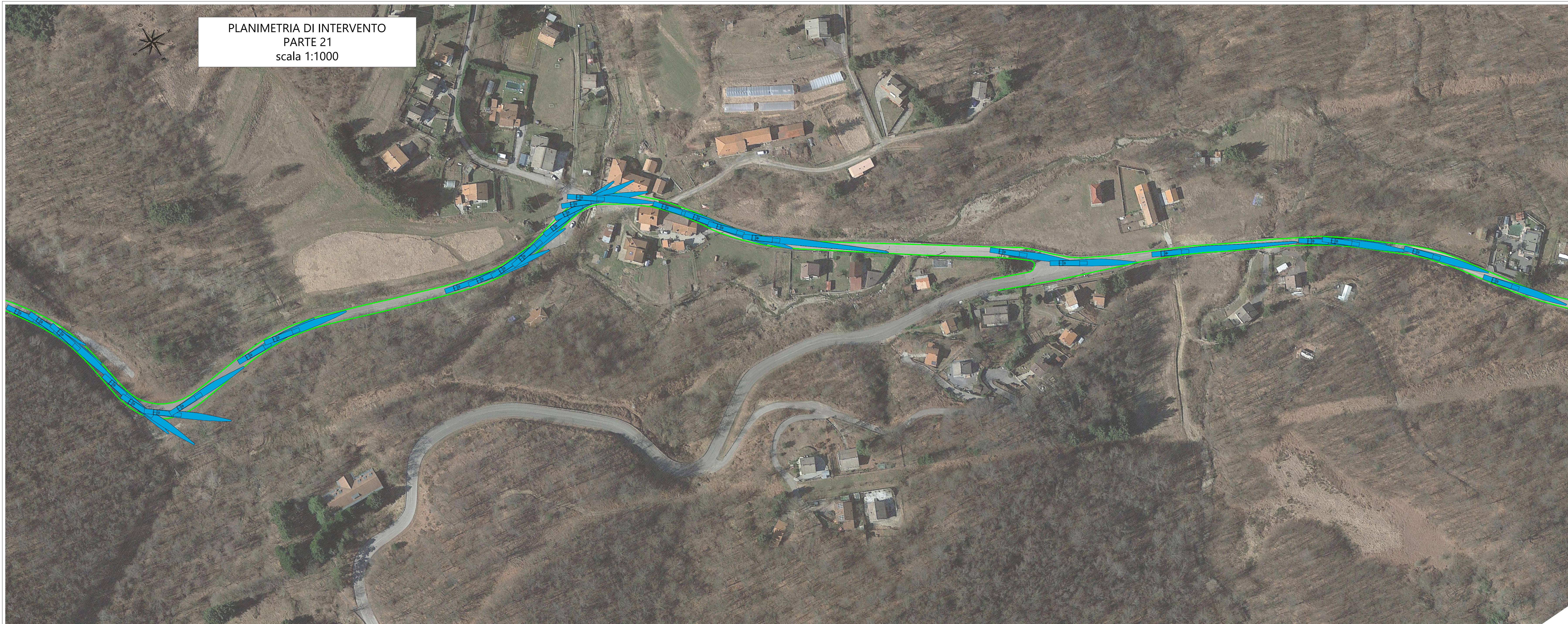
PLANIMETRIA DI INTERVENTO PARTE 21 scala 1:1000