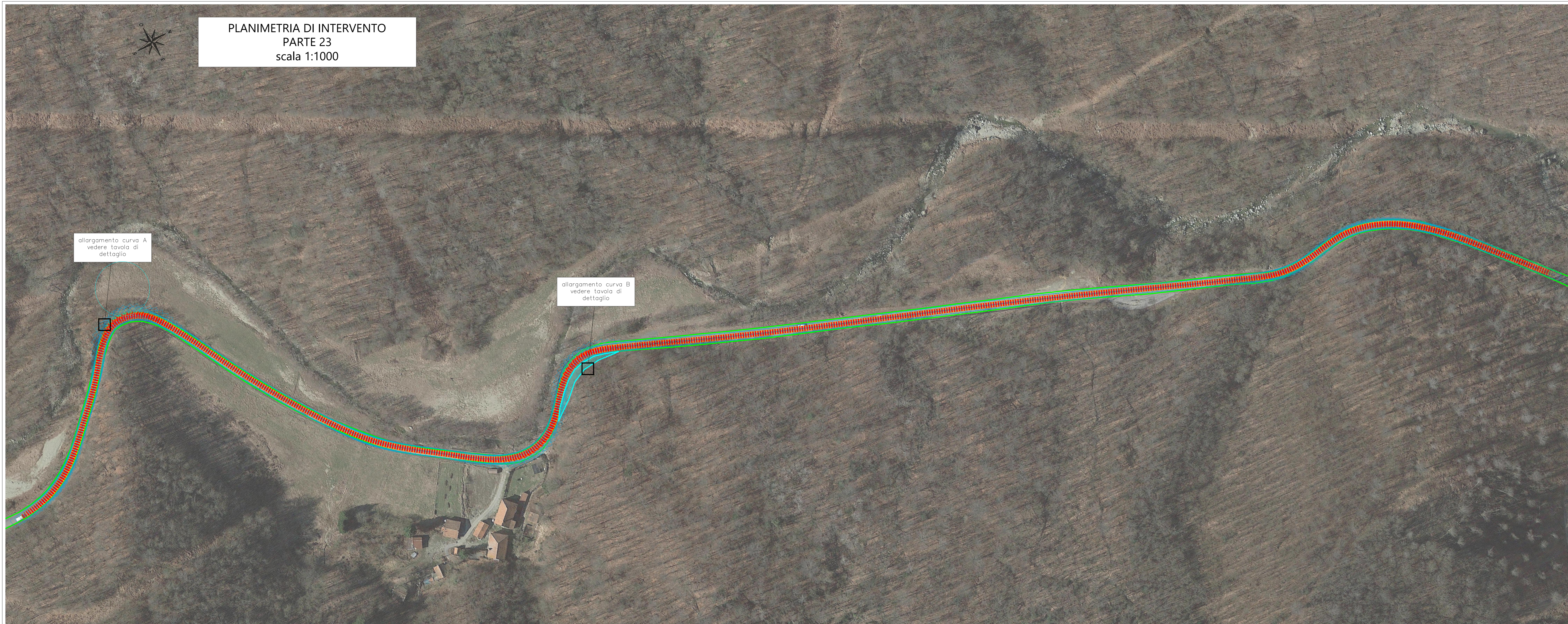
PLANIMETRIA DI INTERVENTO PARTE 23 scala 1:1000