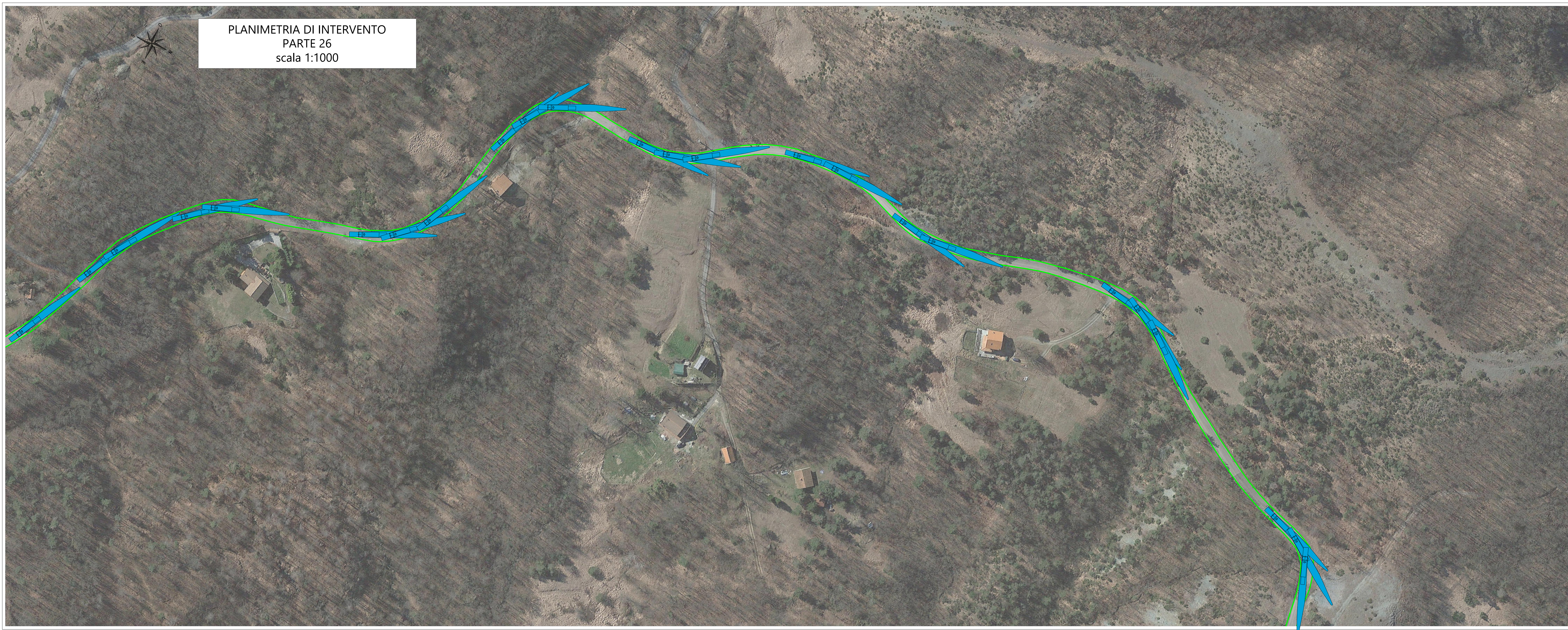
PLANIMETRIA DI INTERVENTO PARTE 26 scala 1:1000