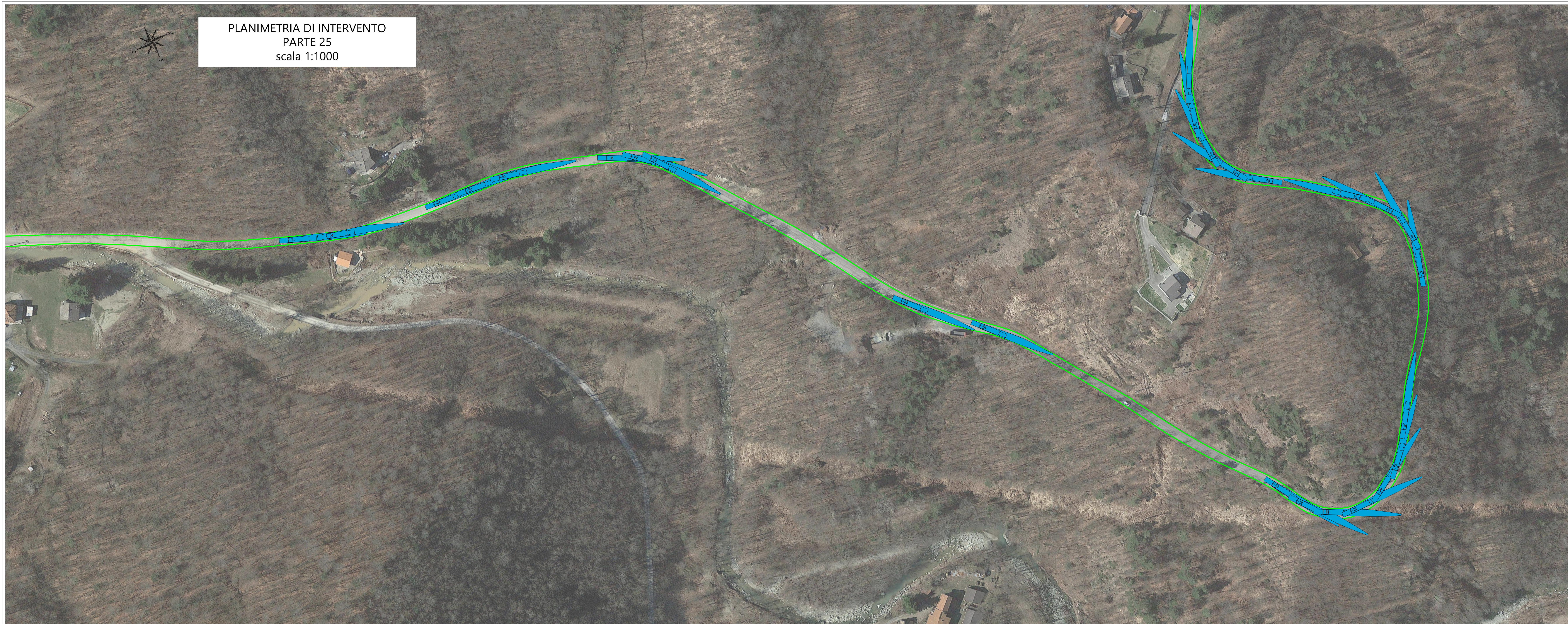
PLANIMETRIA DI INTERVENTO PARTE 25 scala 1:1000