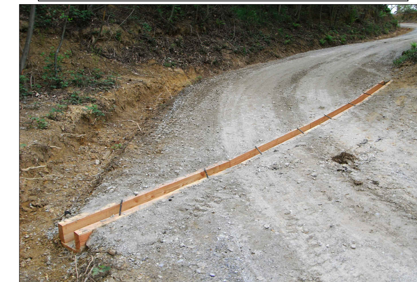
PARTICOLARE OPERE TRASVERSALI DI REGIMAZIONE DELLE ACQUE

https://www.regione.abruzzo.it/system/files/ambiente/tutela-territorio/vinca/160390/elab.05_interventi_di_progetto-signed.pdf