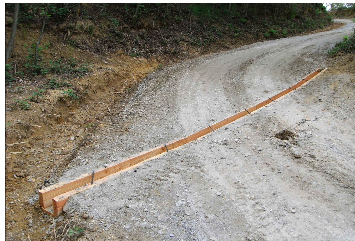
PARTICOLARE OPERE TRASVERSALI DI REGIMAZIONE DELLE ACQUE

https://www.regione.abruzzo.it/system/files/ambiente/tutela-territorio/vinca/100390/elab_05_interventi_di_progetto-signed.pdf