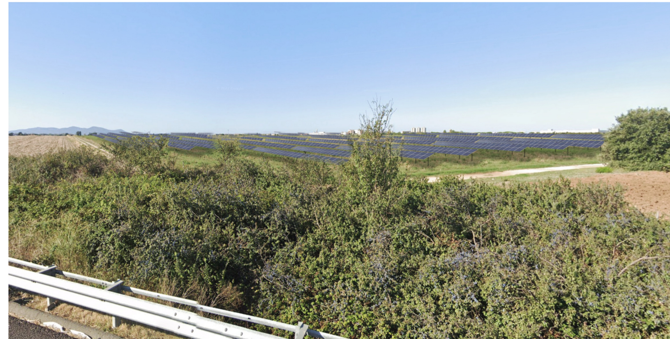
Foto 2.1: Vista dell'impianto dalla strada E80, al km 184 senza opere di mascheramento.