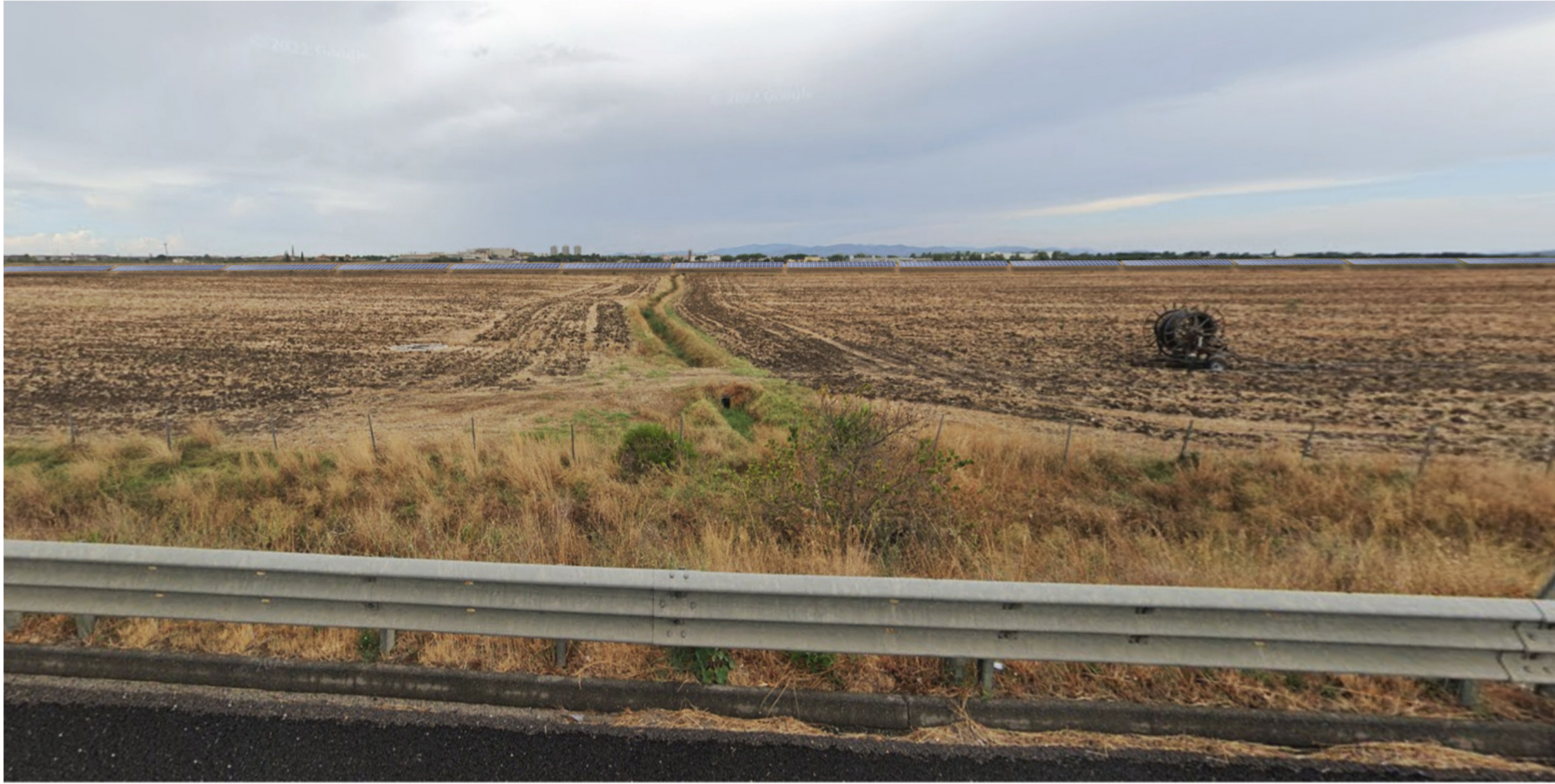
Foto 1.1: Vista dell'impianto dalla strada E80, al km 183 senza opere di mascheramento.