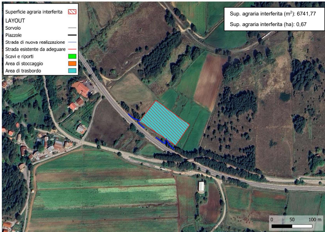
Figura 129 – Superficie agraria interferita dall'area di trasbordo.

Nella tabella seguente vengono riassunti i valori della superficie agricola interferita dalle opere in progetto, nei dintorni di ogni aerogeneratore.