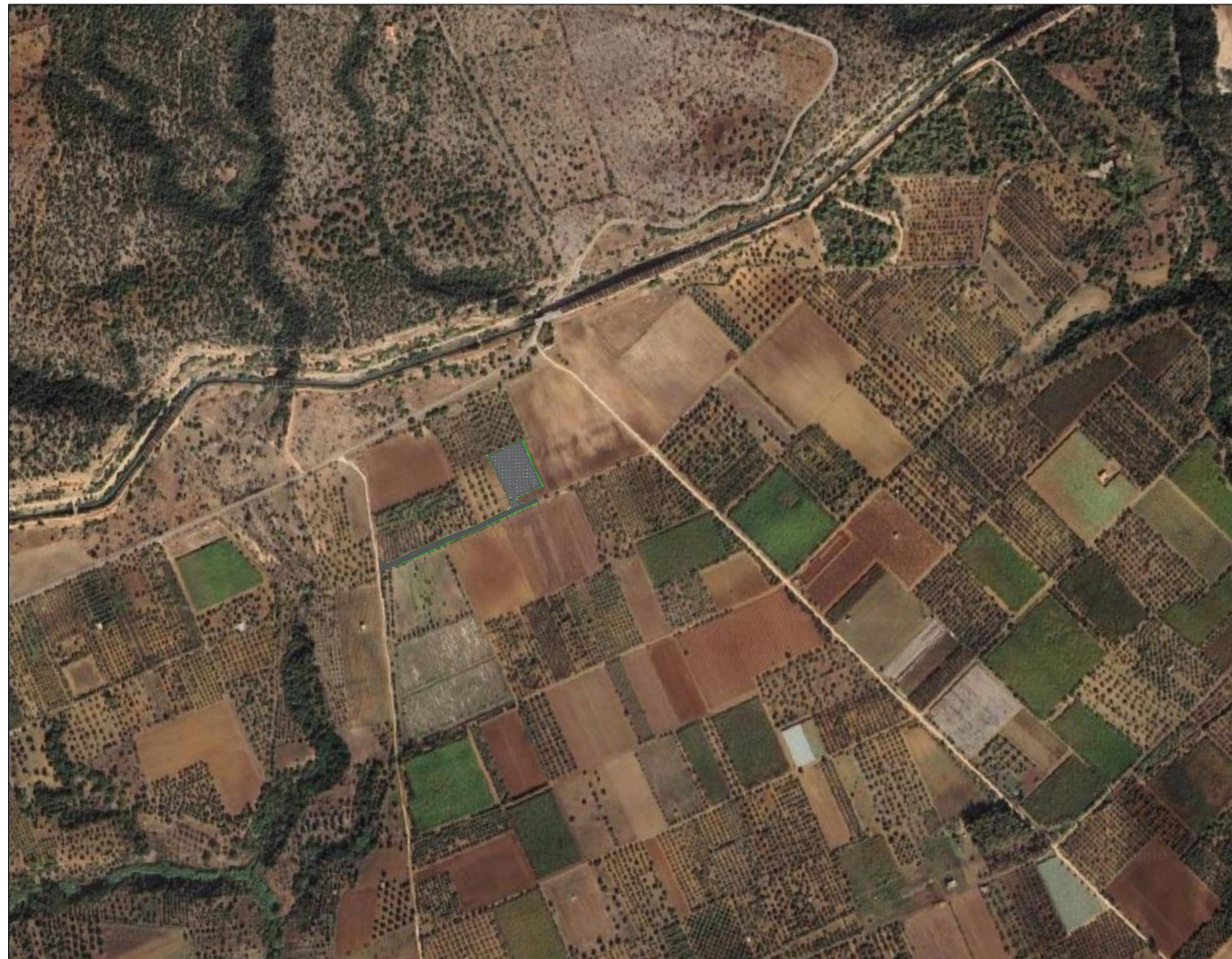
Inquadramento Area Trasbordo su Ortofoto 1.10000