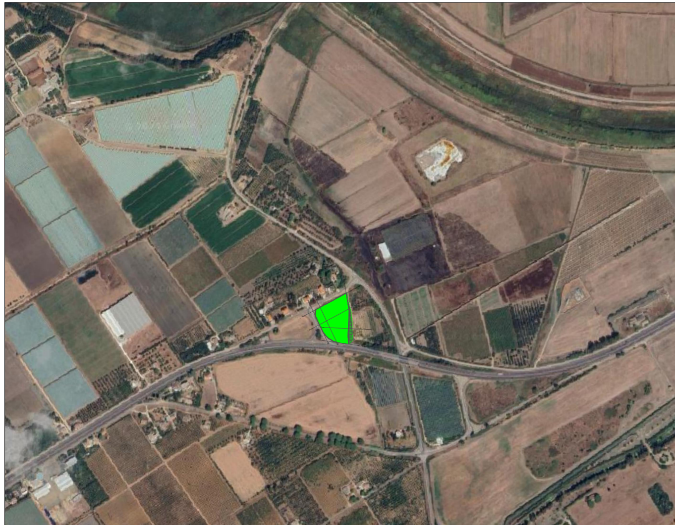
Inquadramento Area Trarbordo su Ortofoto 1.10000