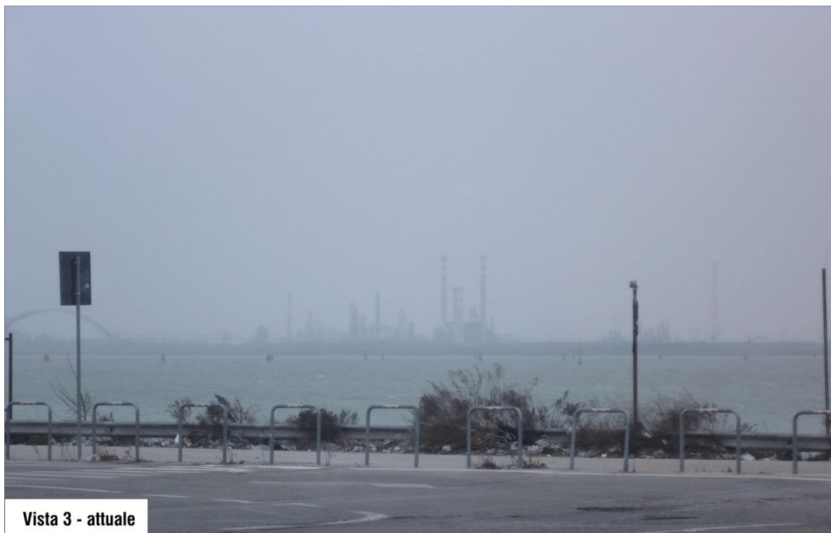
Vista 3 - attuale