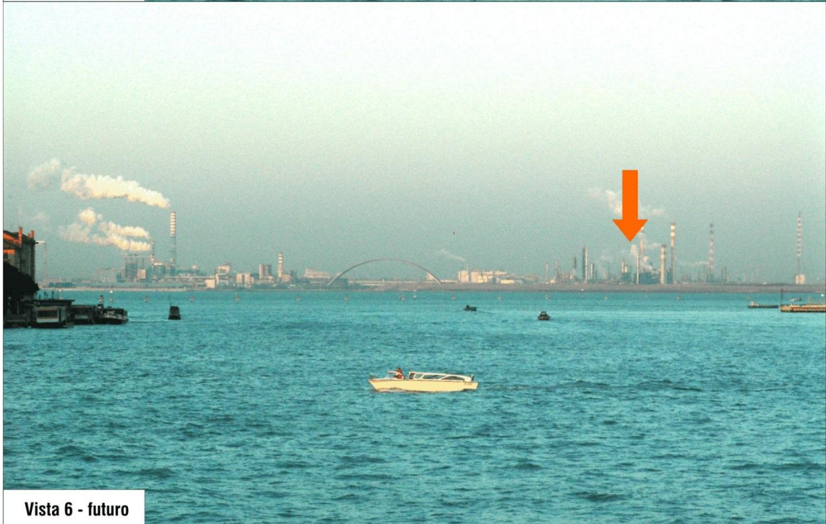
Vista 6 - futuro