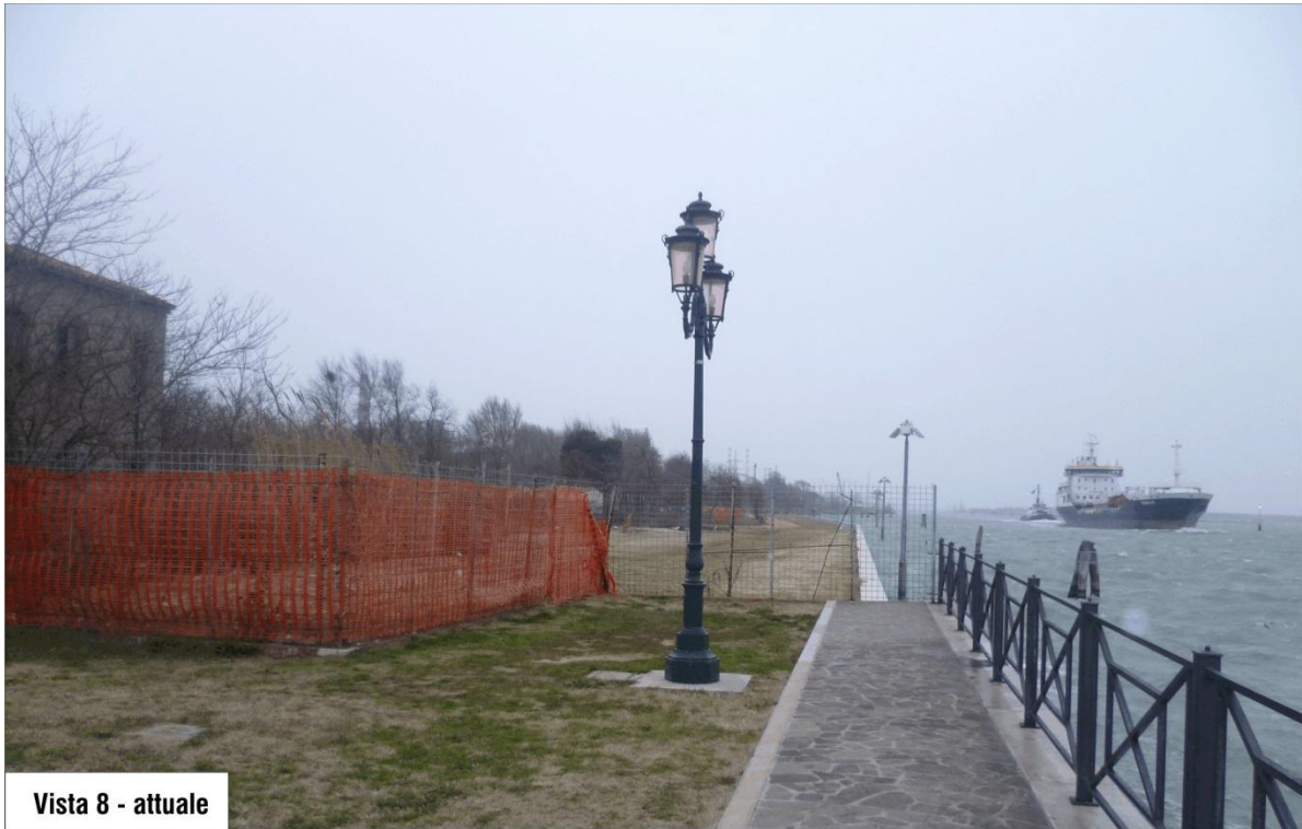
Vista 8 - attuale