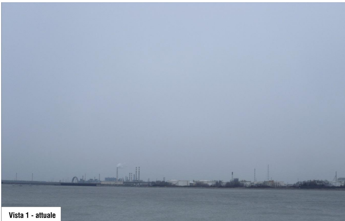
Vista 1 - attuale