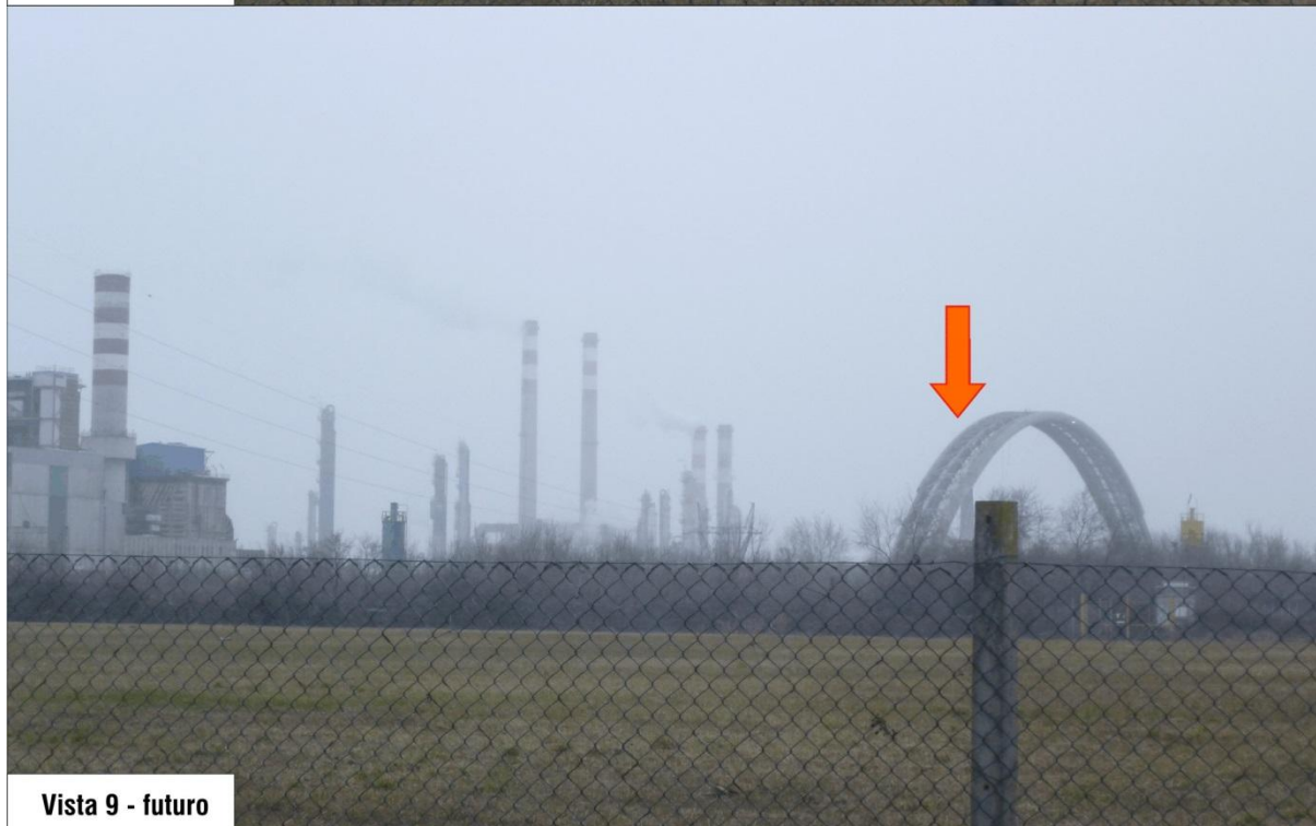
Vista 9 - futuro