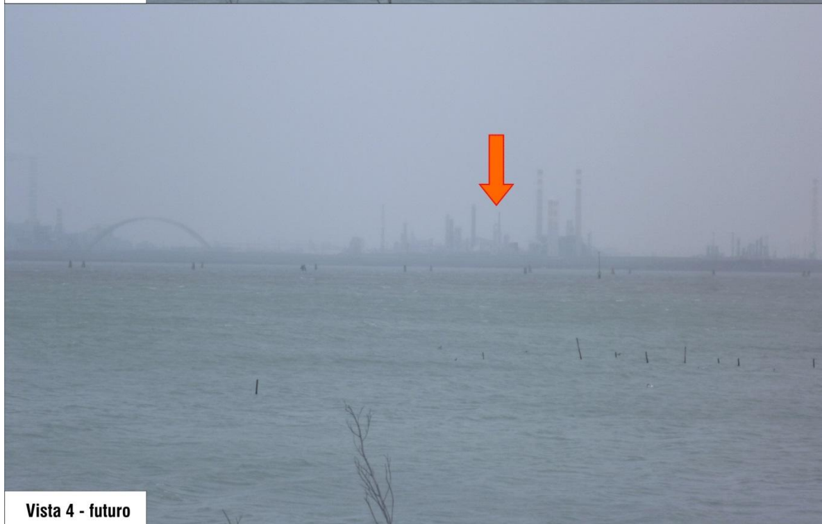
Vista 4 - futuro