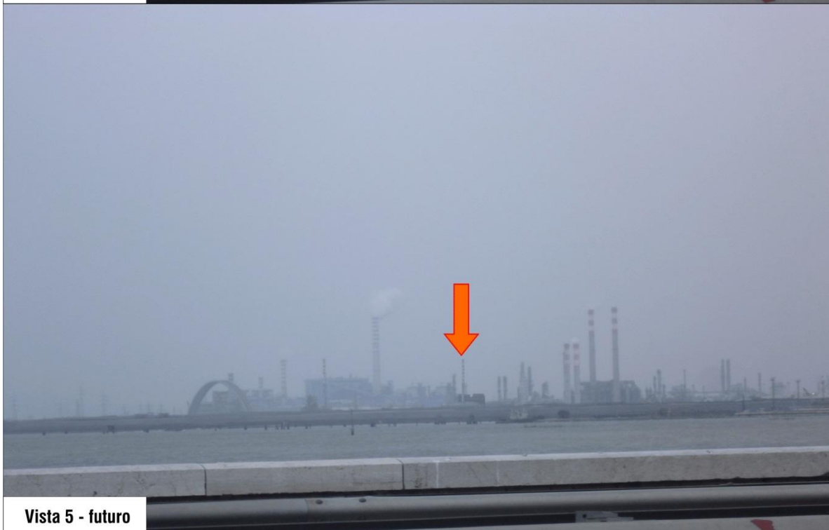
Vista 5 - futuro