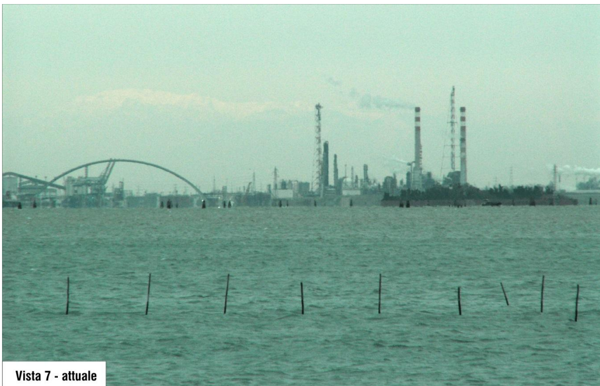
Vista 7 - attuale