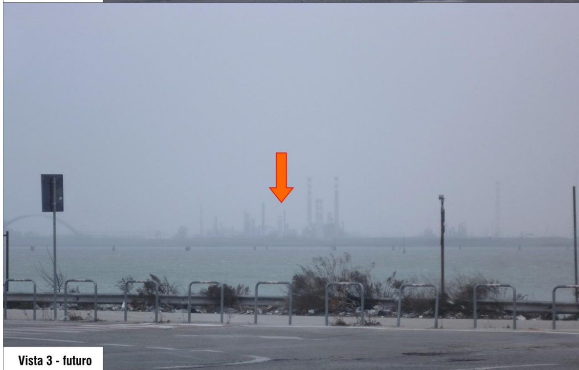
Vista 3 - futuro