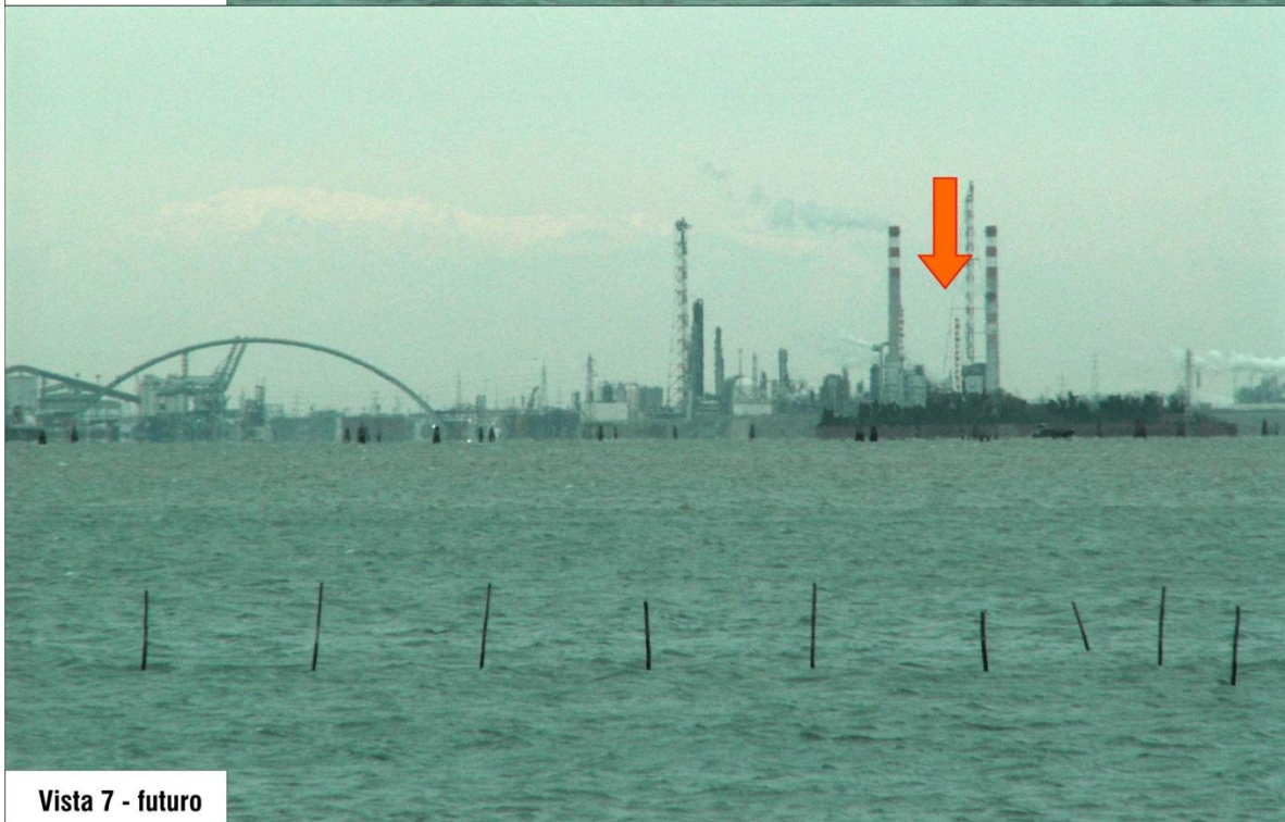
Vista 7 - futuro