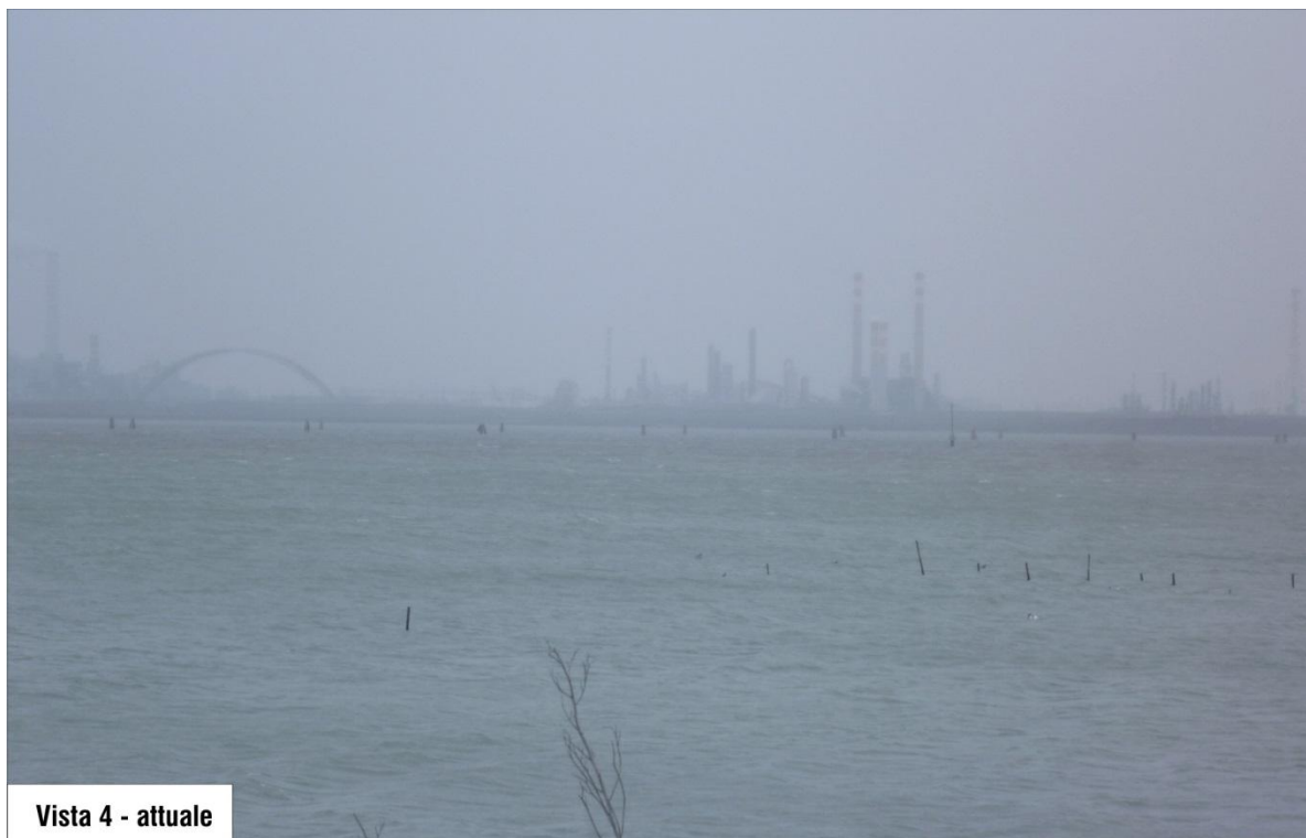
Vista 4 - attuale