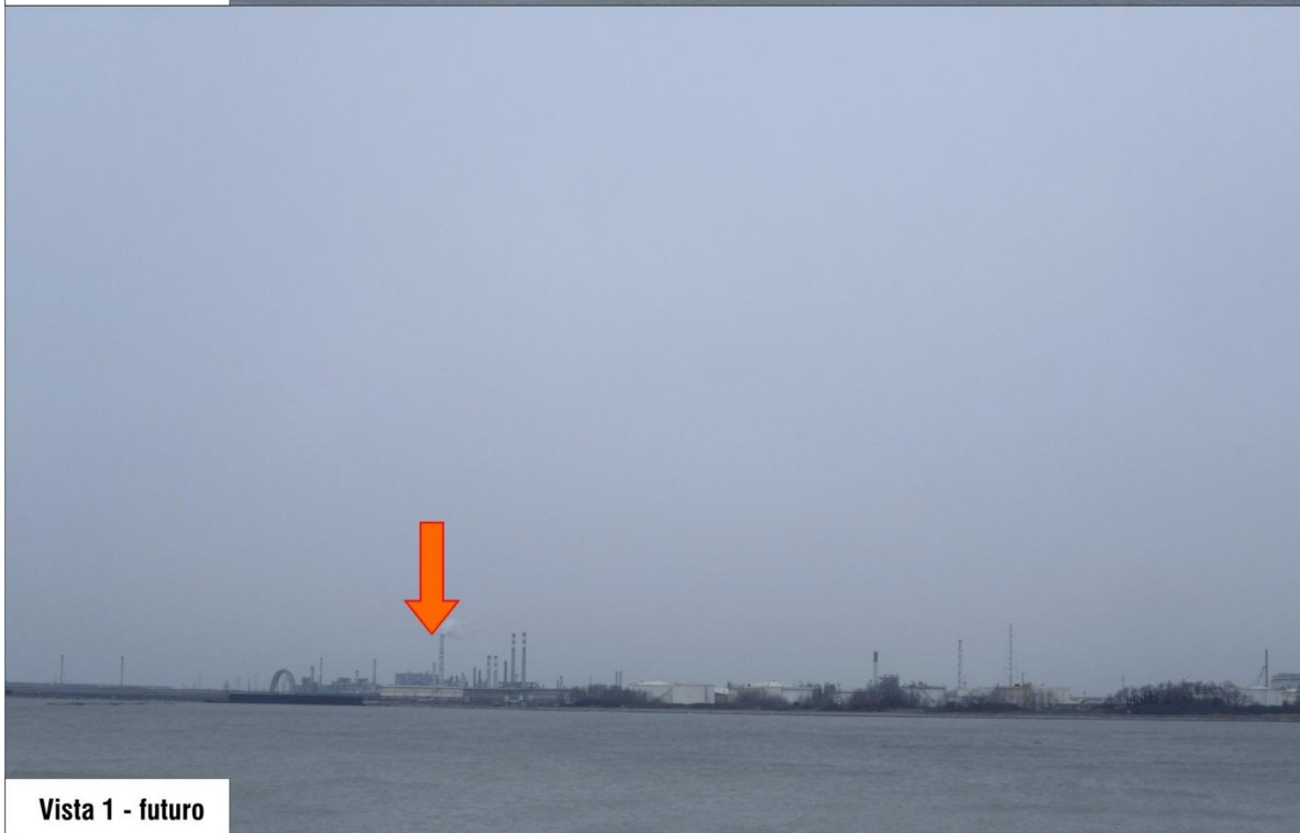
Vista 1 - futuro