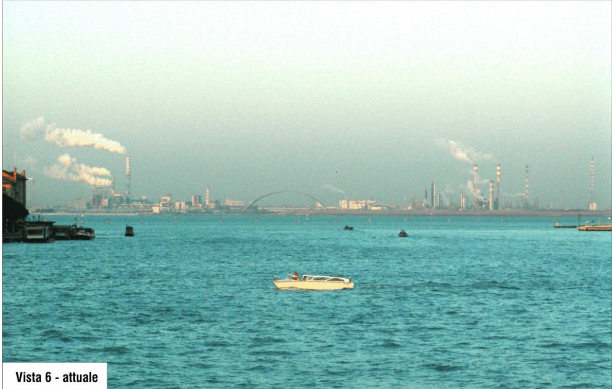
Vista 6 - attuale