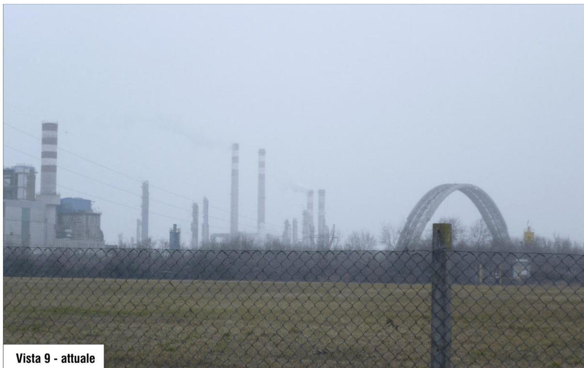
Vista 9 - attuale