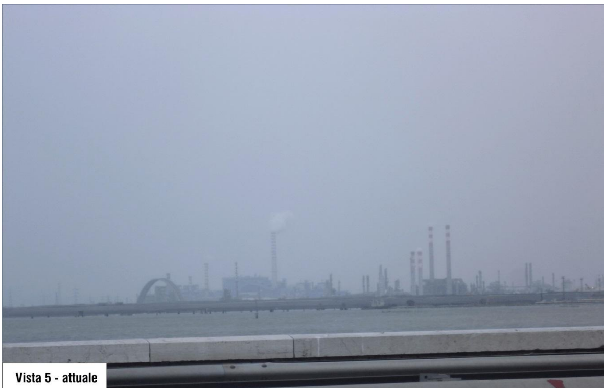
Vista 5 - attuale