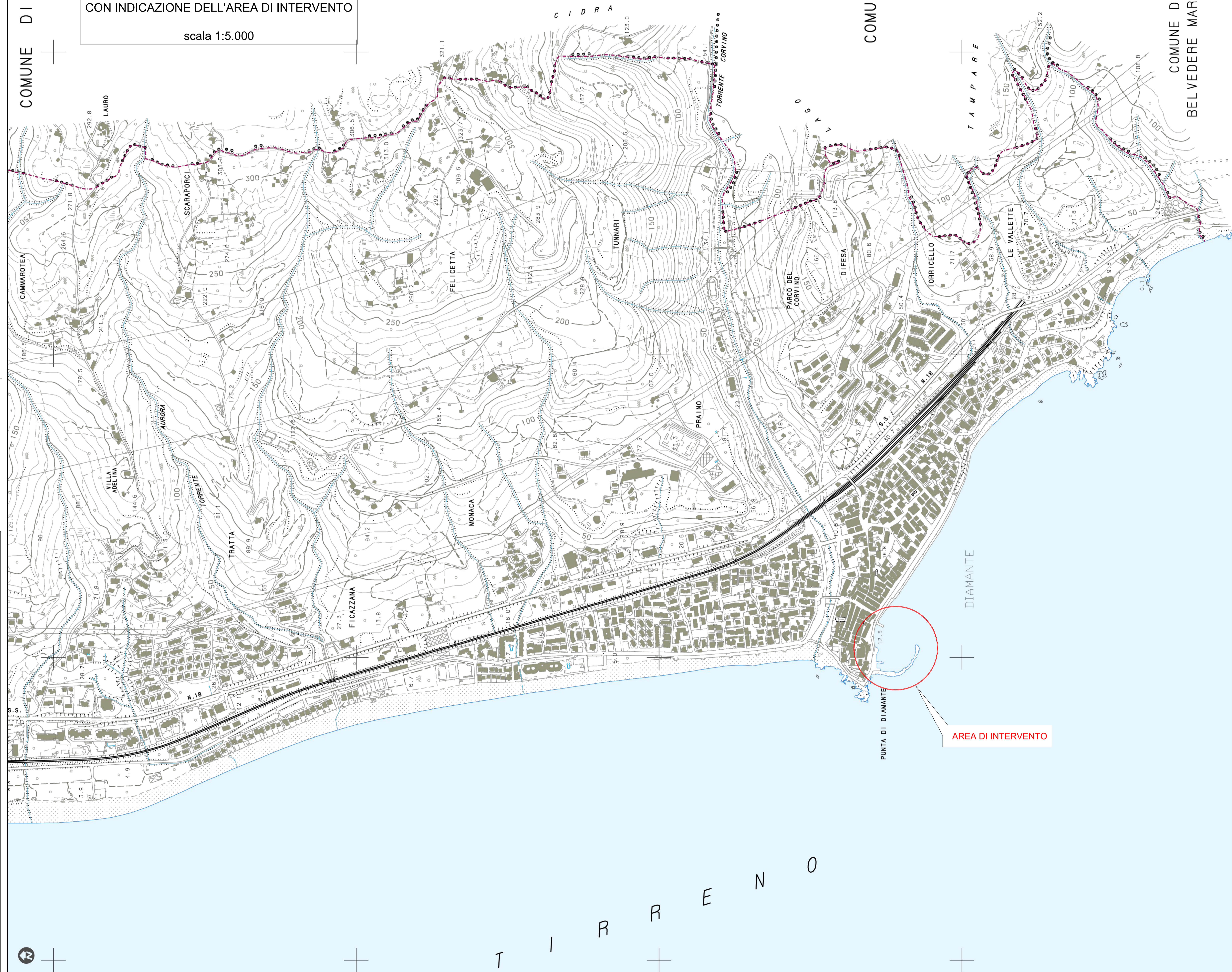
TAVOLA -1- : STRALCIO AEROFOTOGRAMMETRICO CON INDICAZIONE DELL'AREA DI INTERVENTO scala 1:5.000