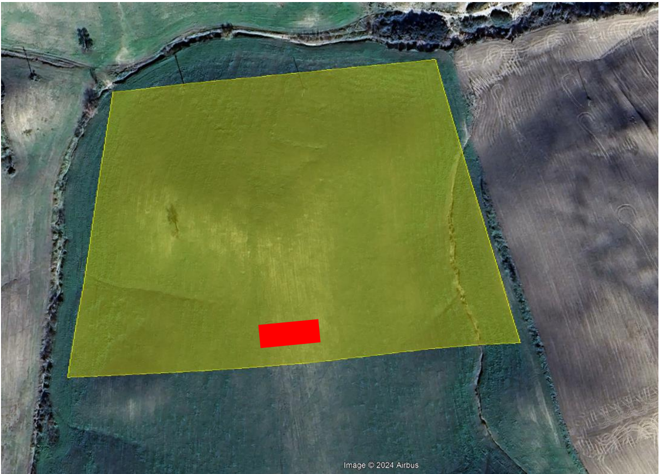
Figura 5 - Ipotesi di un'area potenzialmente idonea all'ubicazione dell'apiario