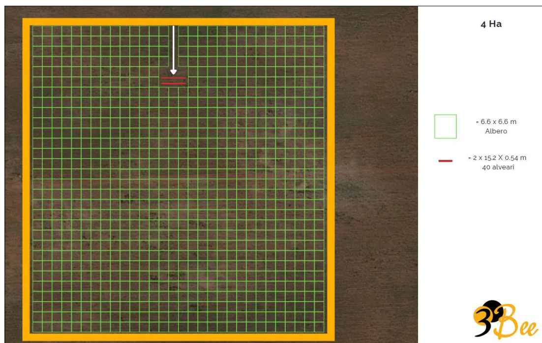
Figura 4 - Schema piantumazione e posizionamento alveari

La conformazione del lotto da destinare al progetto Oasi della Biodiversità è riportata schematicamente nella figura seguente: tale configurazione costituisce il modulo minimo da destinare alla compensazione ambientale del progetto e si presenta come una griglia che si sviluppa attorno ai 40 alveari previsti. La posizione degli alveari è strategica, in questo modo le api saranno facilmente raggiungibili dagli addetti ai lavori, e le stesse potranno raggiungere in modo agevole le piantumazioni nettariifere nelle immediate vicinanze.