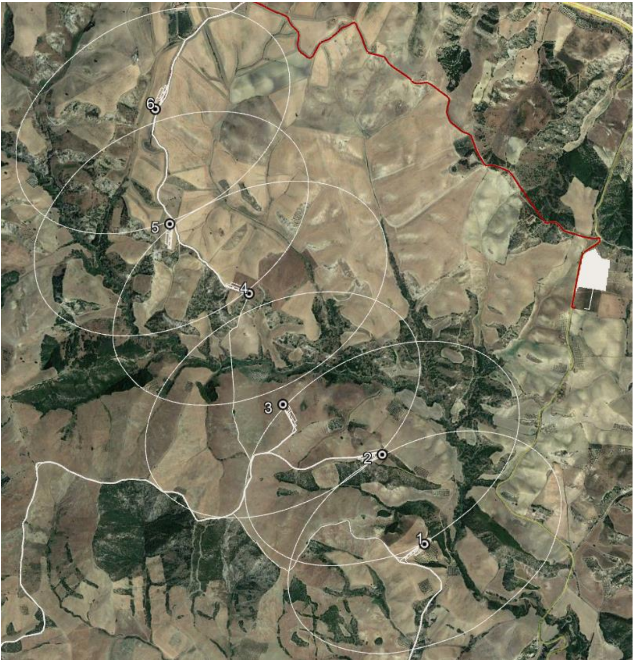
Figura 1 - Inquadramento impianto eolico su ortofoto