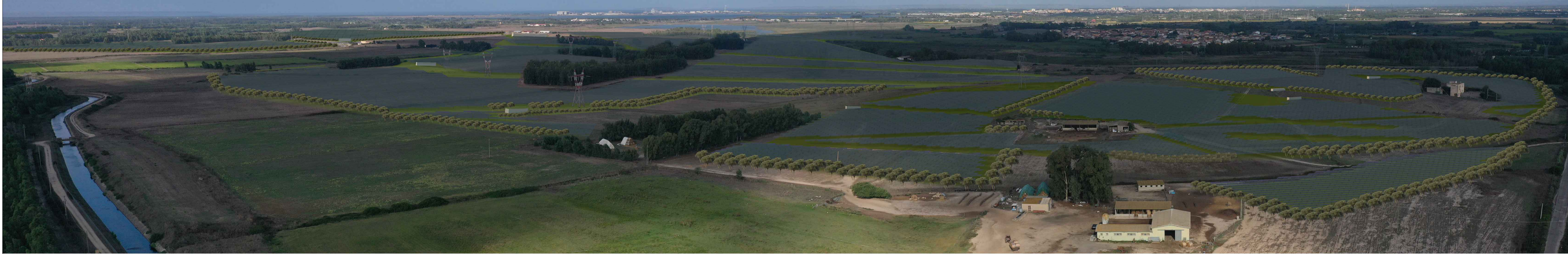
VISTA ZENITALE STATO DI FATTO Comune di Palmas Arborea Provincia di Oristano (OR), Italia