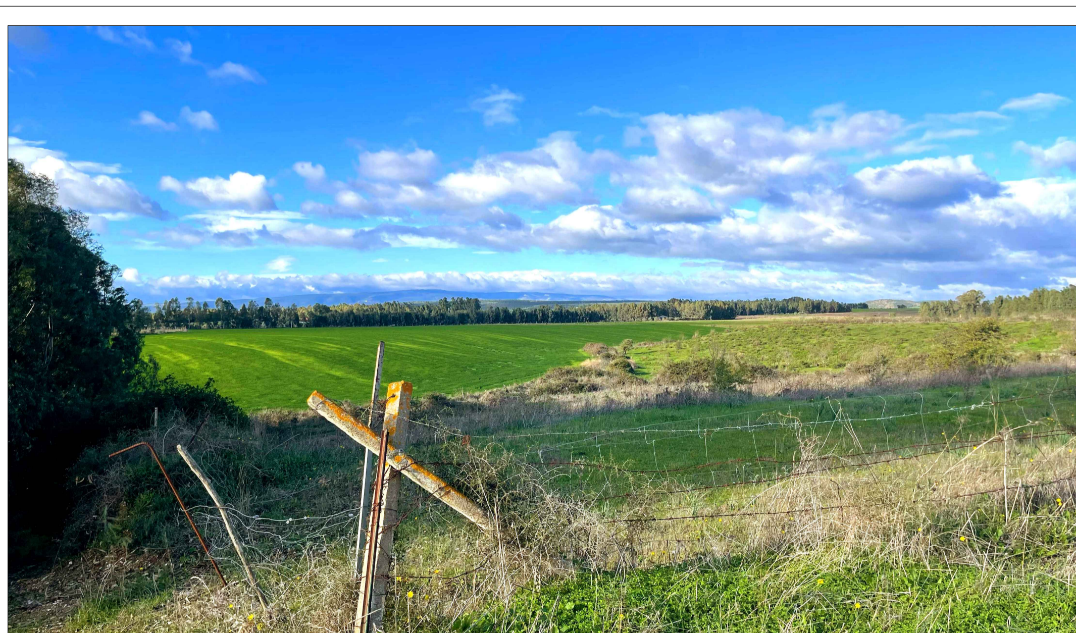
FOTOINSEERIMENTO 2 - STATO DI FATTO