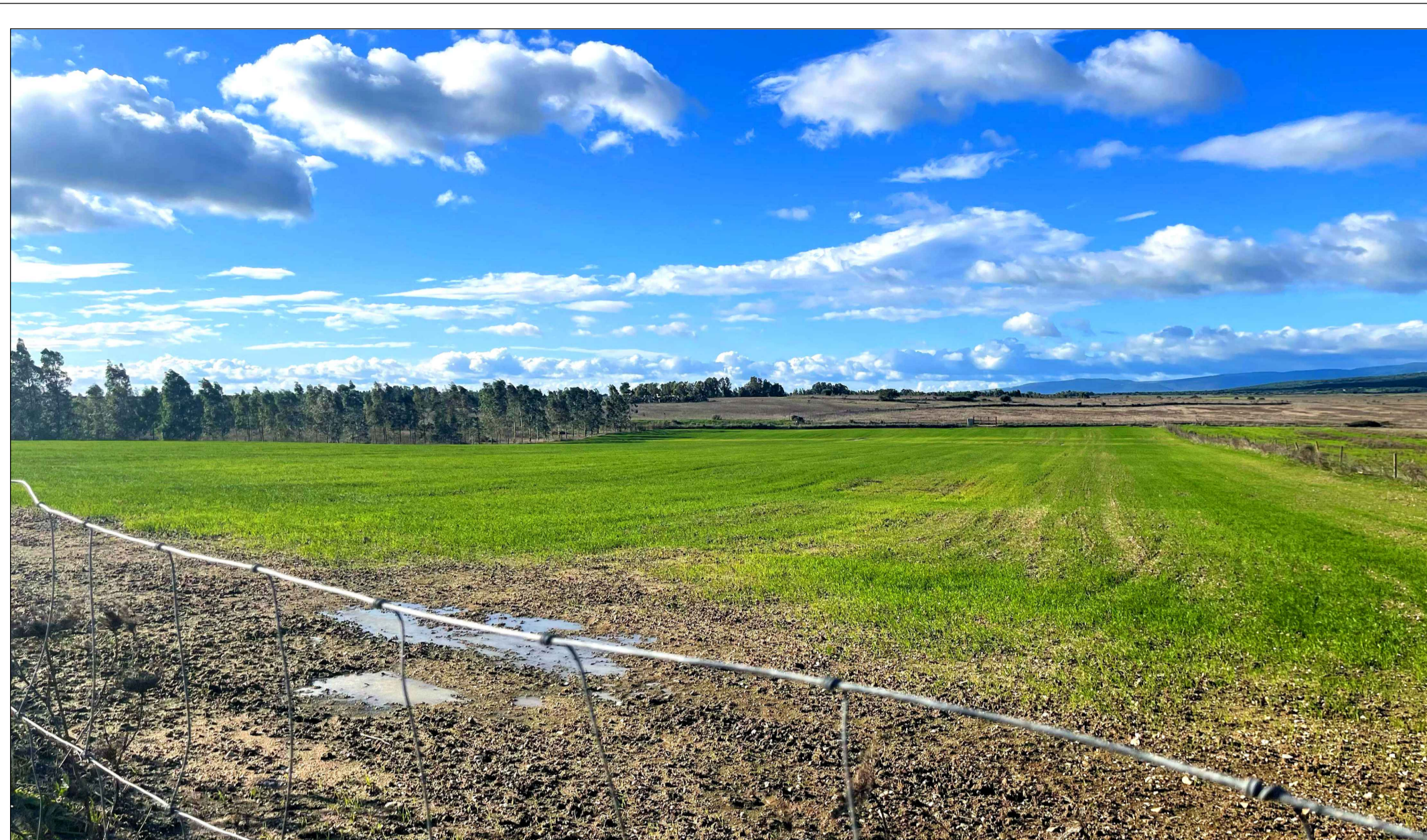
FOTOINSEERIMENTO 1 - STATO DI FATTO