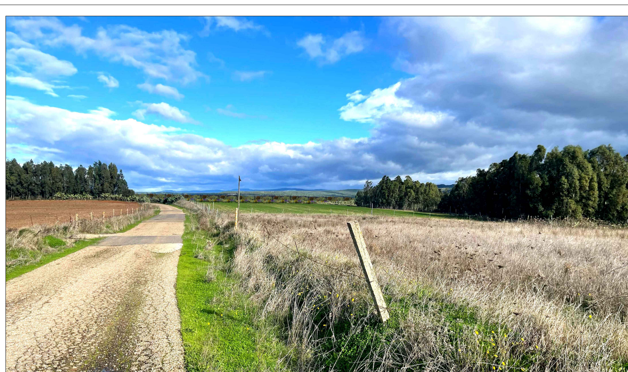
FOTOINSEERIMENTO 3 - STATO DI PROGETTO