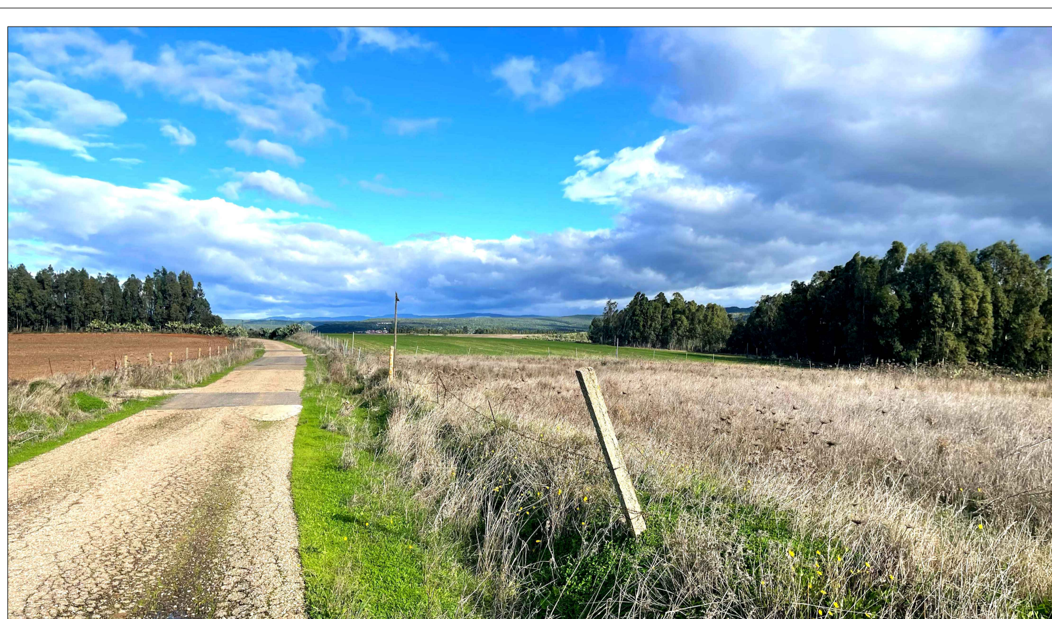
FOTOINSEERIMENTO 3 - STATO DI FATTO