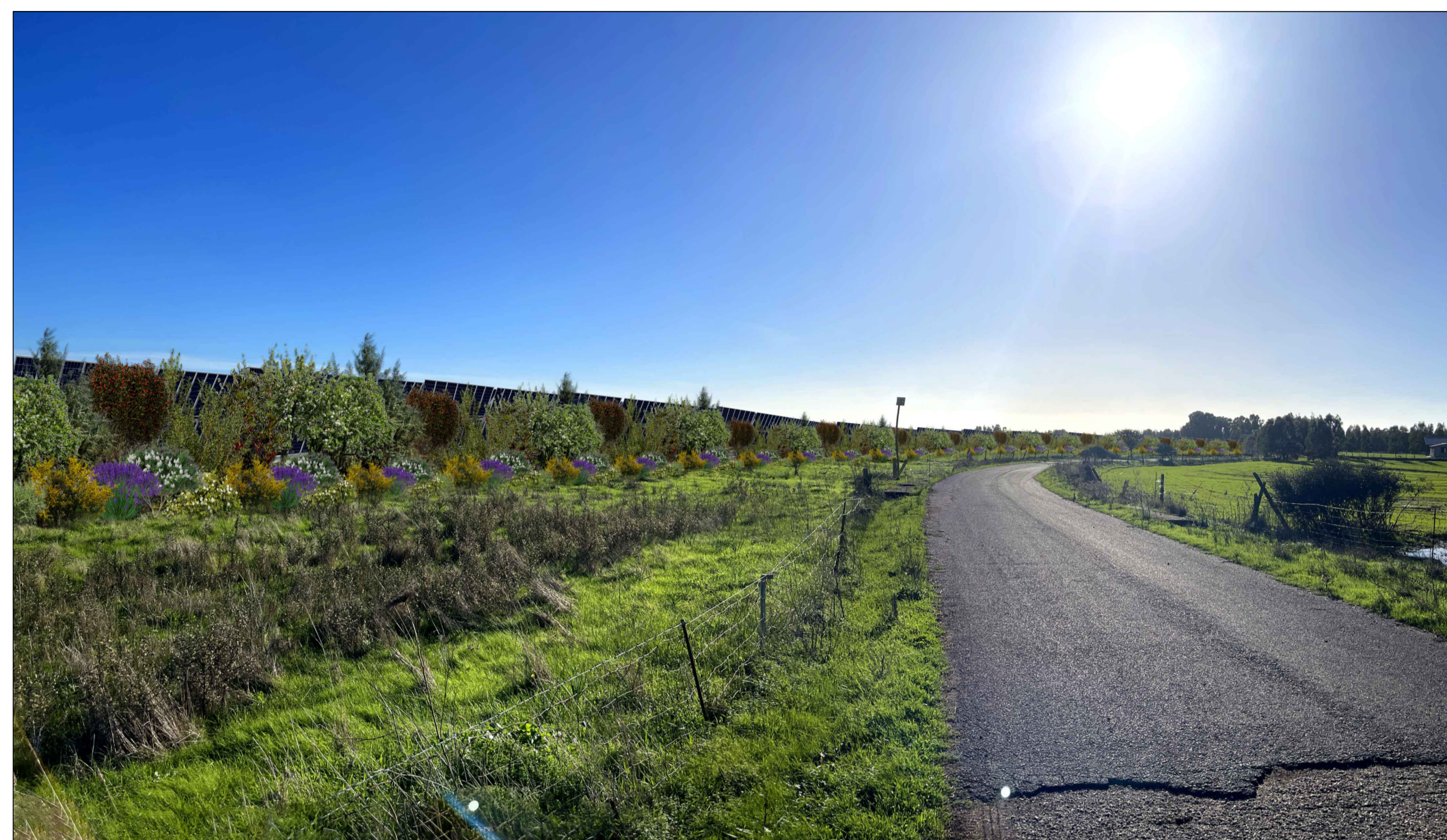
FOTOINSENERIMENTO 7 - STATO DI PROGETTO