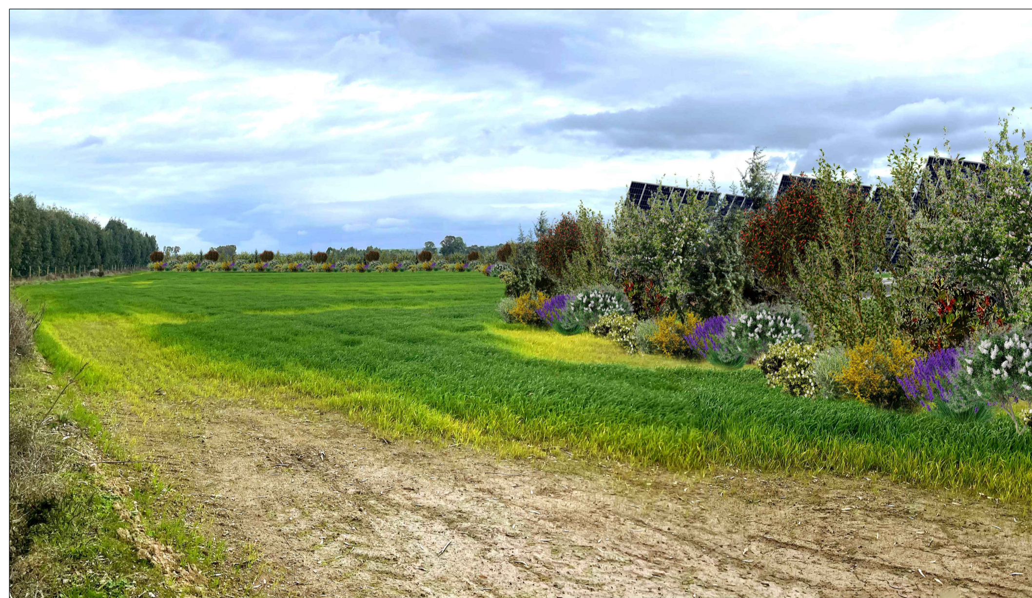
FOTOINSENERIMENTO 8 - STATO DI PROGETTO