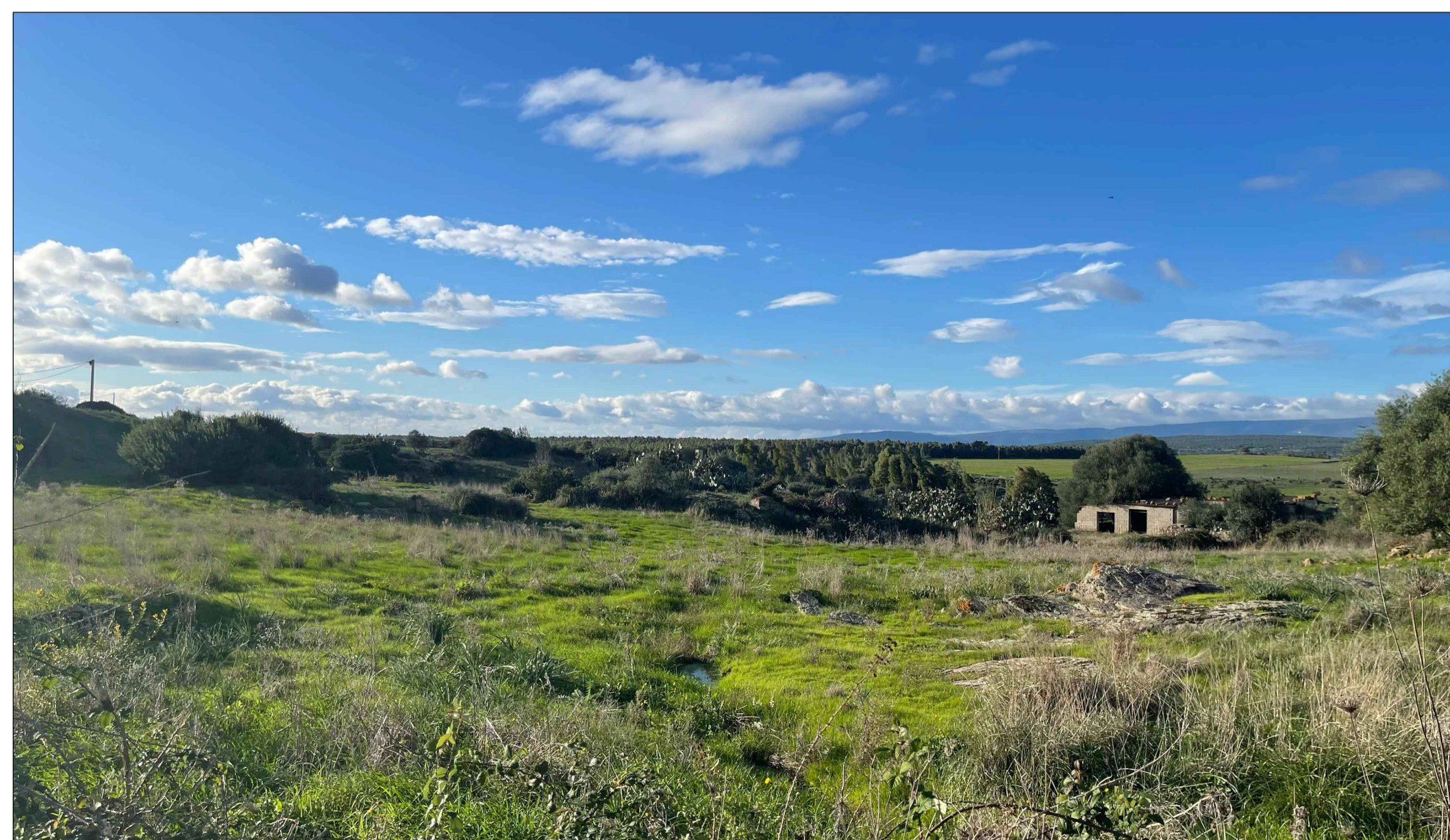
PUNTO DI PRESA FOTOGRAFICA 10