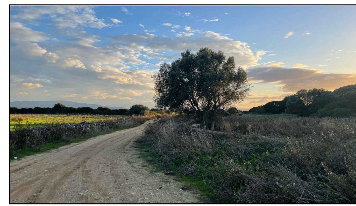
PUNTO DI PRESA FOTOGRAFICA 11