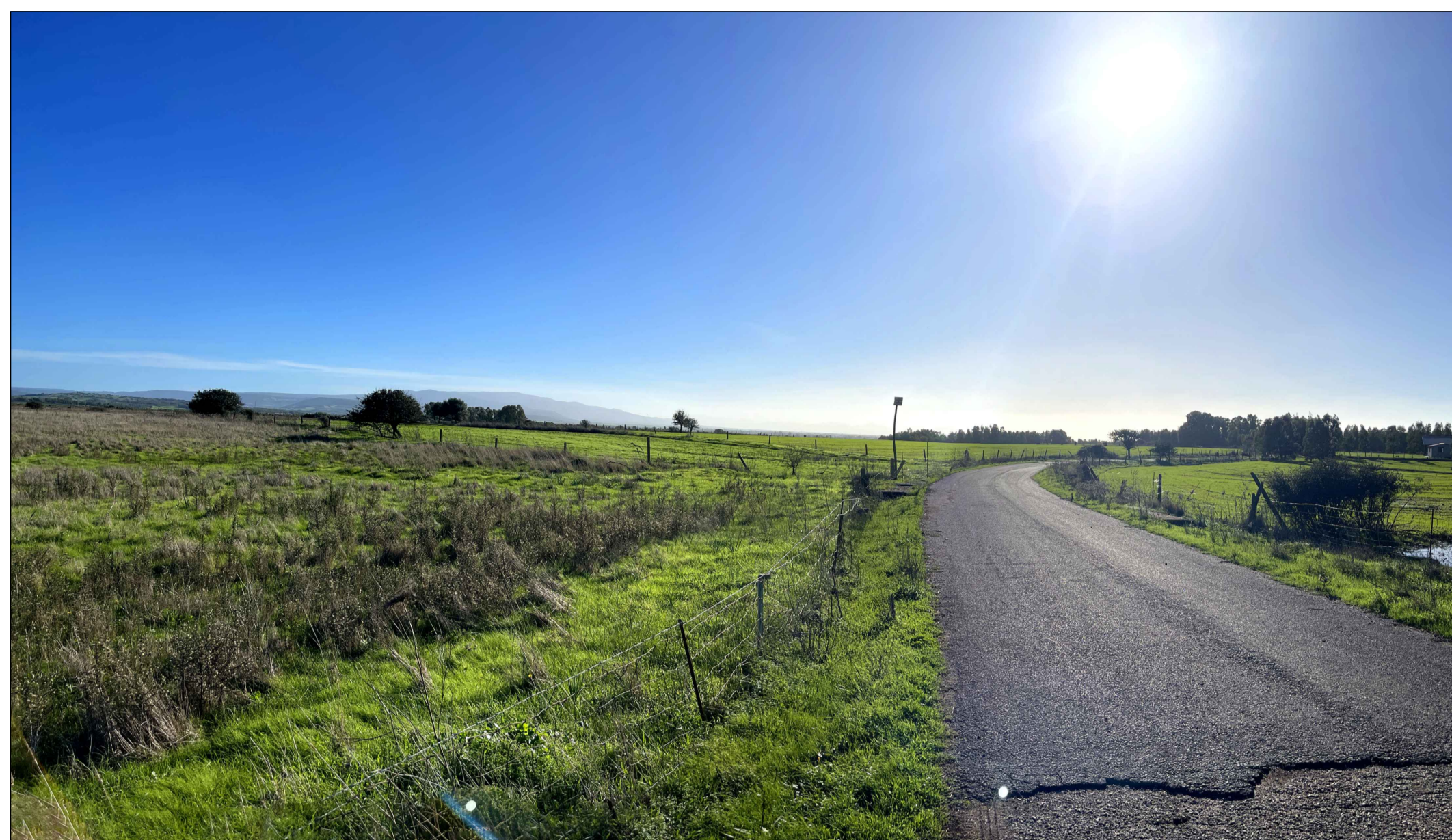
FOTOINSENERIMENTO 7 - STATO DI FATTO