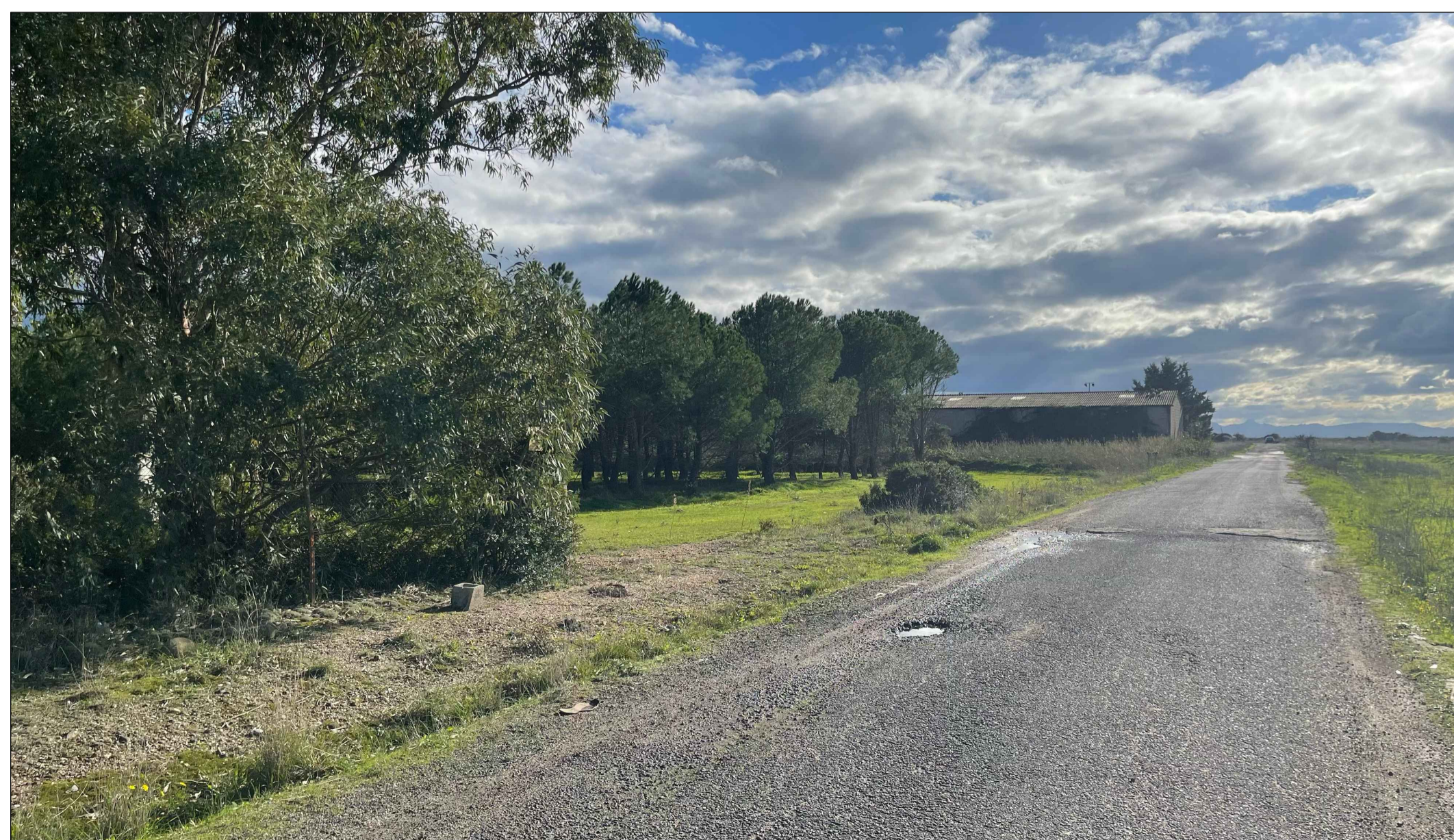
PUNTO DI PRESA FOTOGRAFICA 9