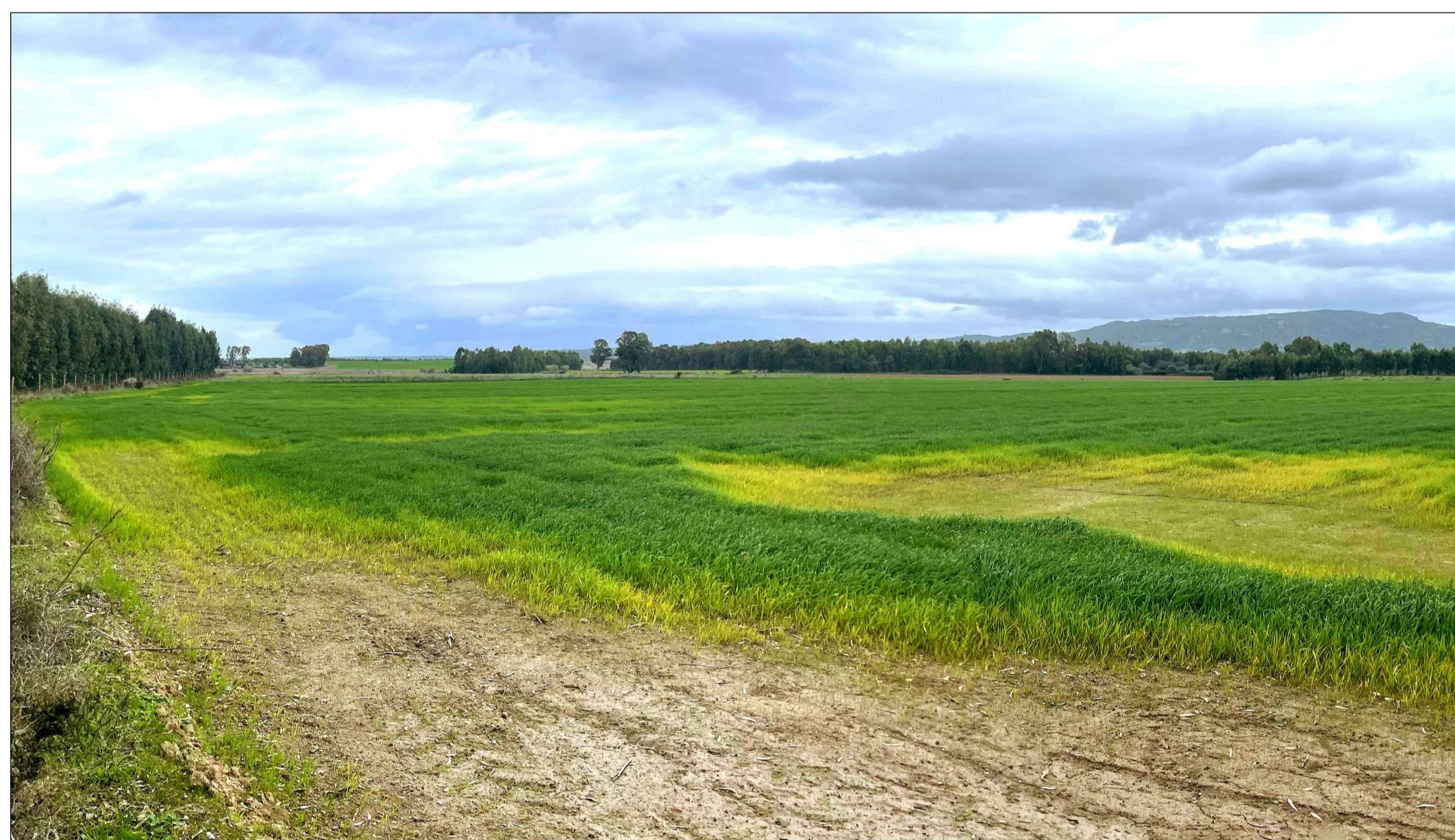
FOTOINSENERIMENTO 8 - STATO DI FATTO