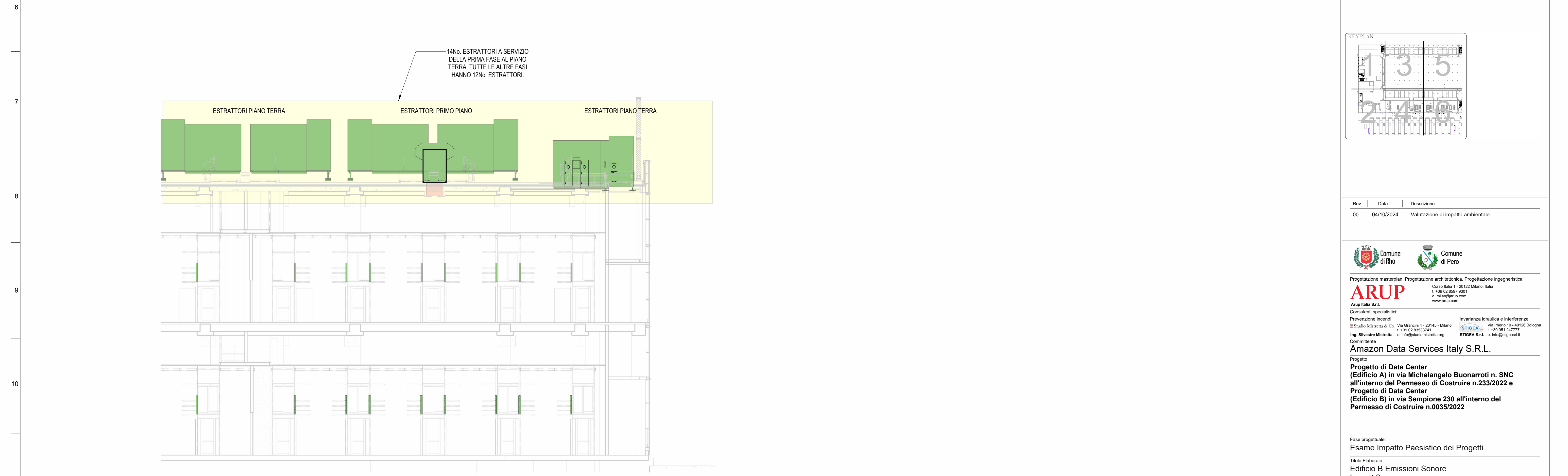
2 SECTION BB Scale/Scala 1 : 125