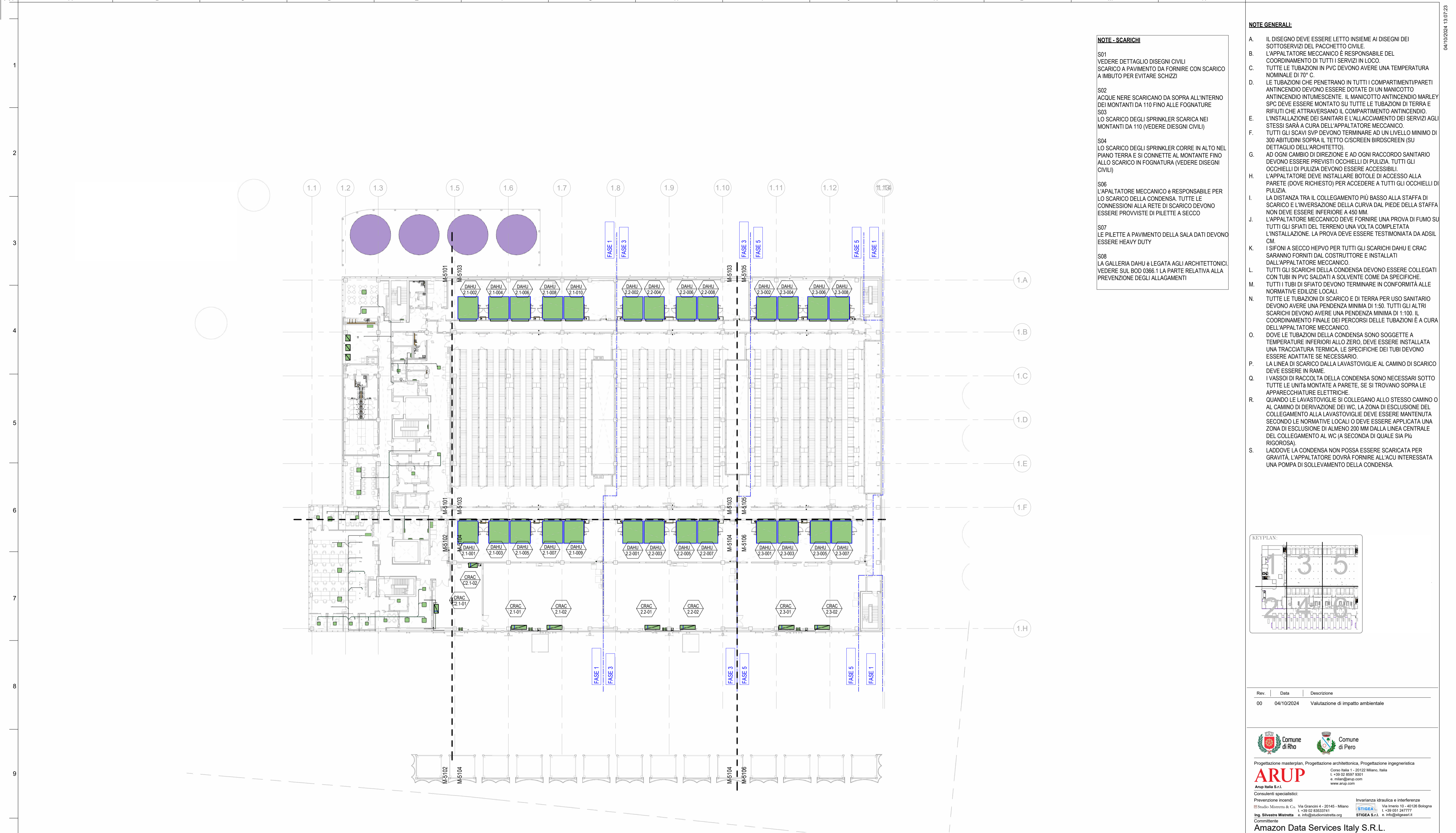
1 LAYOUT GENERALE SCARICHI PRIMO PIANO Scale/Scala NTS

NOTE - SCARICHI S01 VEDERE DETTAGLIO DISEGNI CIVILI SCARICO A PAVIMENTO DA FORNIRE CON SCARICO A IMBUTO PER EVITARE SCHIZZI S02 ACQUE NERE SCARICANO DA SOPRA ALL'INTERNO DEI MONTANTI DA 110 FINO ALLE FOGNATURE S03 LO SCARICO DEGLI SPRINKLER SCARICA NEI MONTANTI DA 110 (VEDERE DISEGNI CIVILI) S04 LO SCARICO DEGLI SPRINKLER CORRE IN ALTO NEL PIANO TERRA E SI CONNETTE AL MONTANTE FINO ALLO SCARICO IN FOGNATURA (VEDERE DISEGNI CIVILI) S06 L'APPALTATORE MECCANICO è RESPONSABILE PER LO SCARICO DELLA CONDENZA. TUTTE LE CONNESSIONI ALLA RETE DI SCARICO DEVONO ESSERE PROVISTE DI PILETTE A SECCO S07 LE PILETTE A PAVIMENTO DELLA SALA DATI DEVONO ESSERE HEAVY DUTY S08 LA GALLERIA DAHU È LEGATA AGLI ARCHITETTONICI. VEDERE SUL BOD 0366.1 LA PARTE RELATIVA ALLA PREVENZIONE DEGLI ALLAGAMENTI