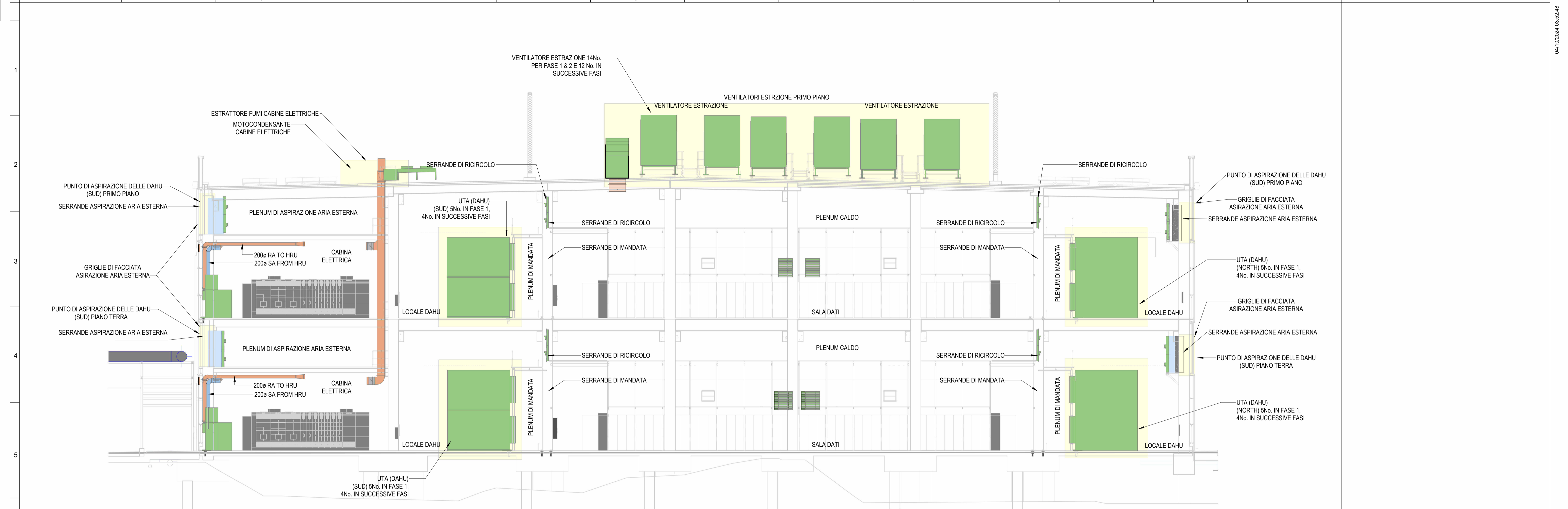
1 SEZIONE AA Scale/Scala 1 : 125