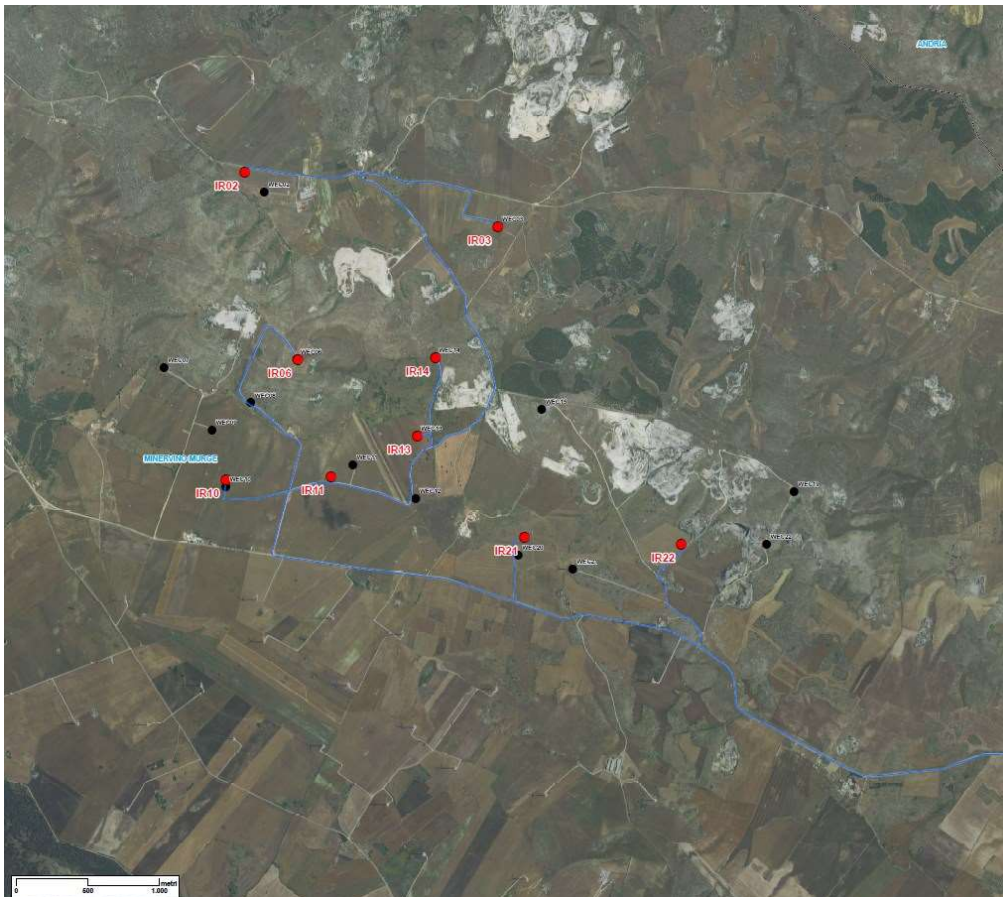
Figura 1 – Inquadramento territoriale del progetto

In Figure 1 e 2 è mostrato l'inquadramento territoriale del progetto.