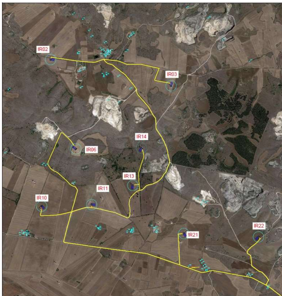
Figura 2 – Ortofoto delle aree interessate dal progetto.