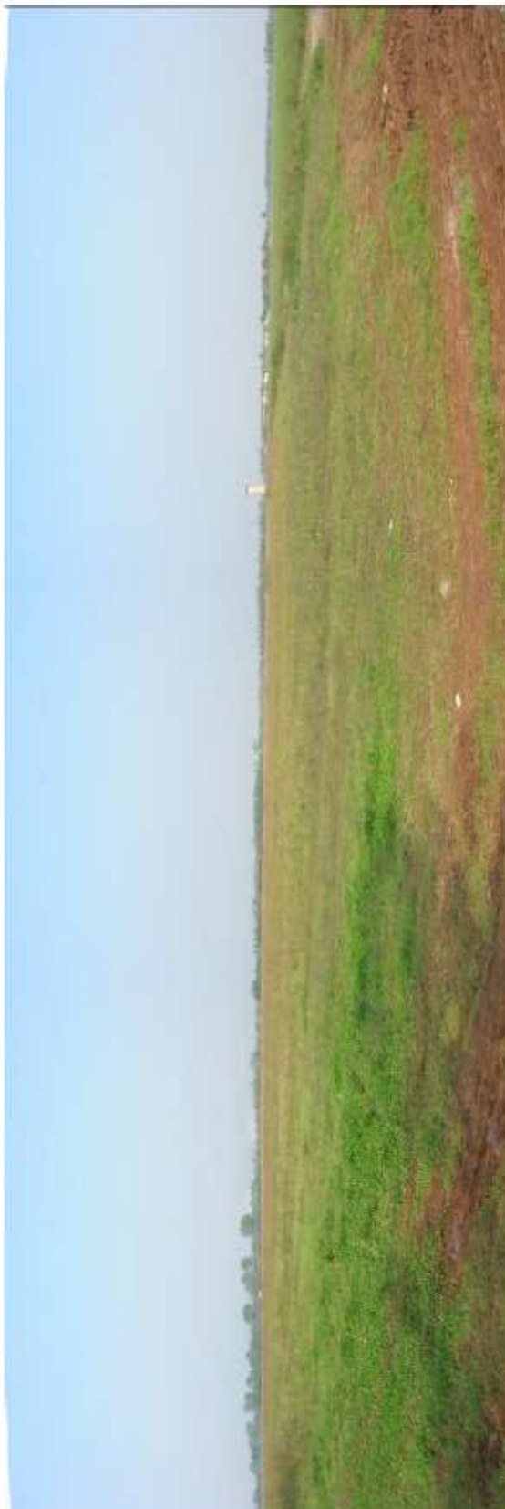
Foto 3 - Area di cava vista da Sud-Est