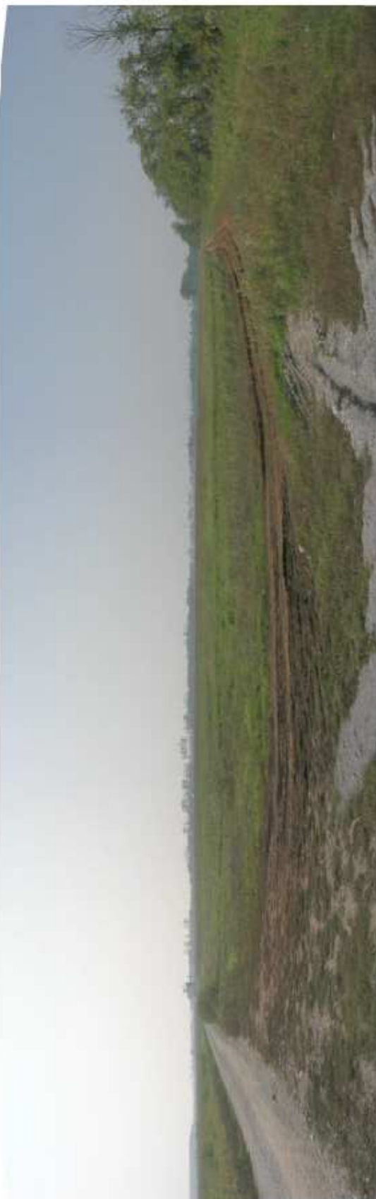
Foto 2 - Panoramica dell'area di cava vista da Nord-Est