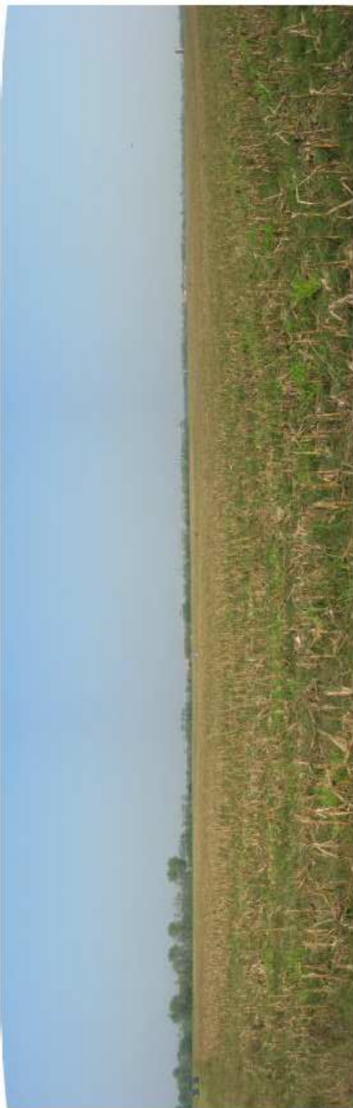
Foto 4 - Panoramica dell'area di cava vista da Sud-Ovest