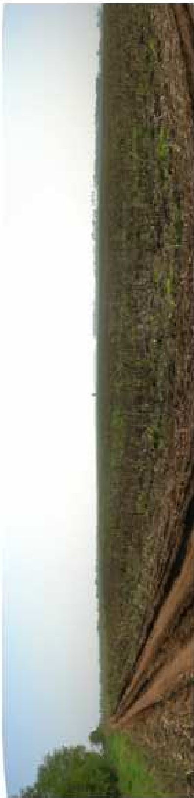
Foto 1 - Panoramica dell'area di cave vista da Nord-Ovest