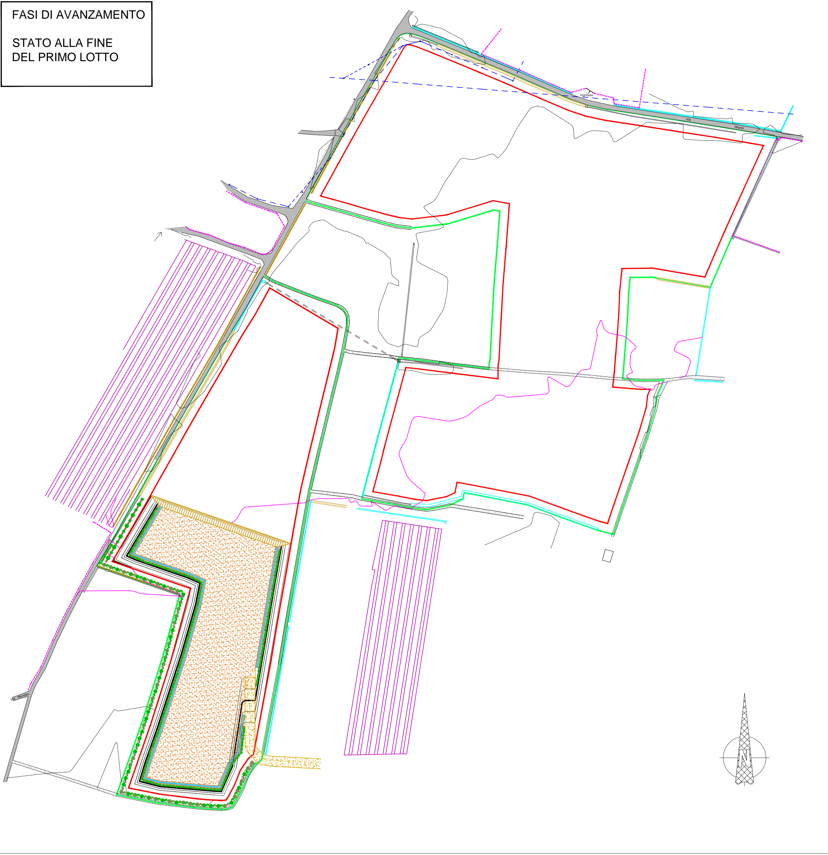
FASI DI AVANZAMENTO STATO ALLA FINE DEL PRIMO LOTTO