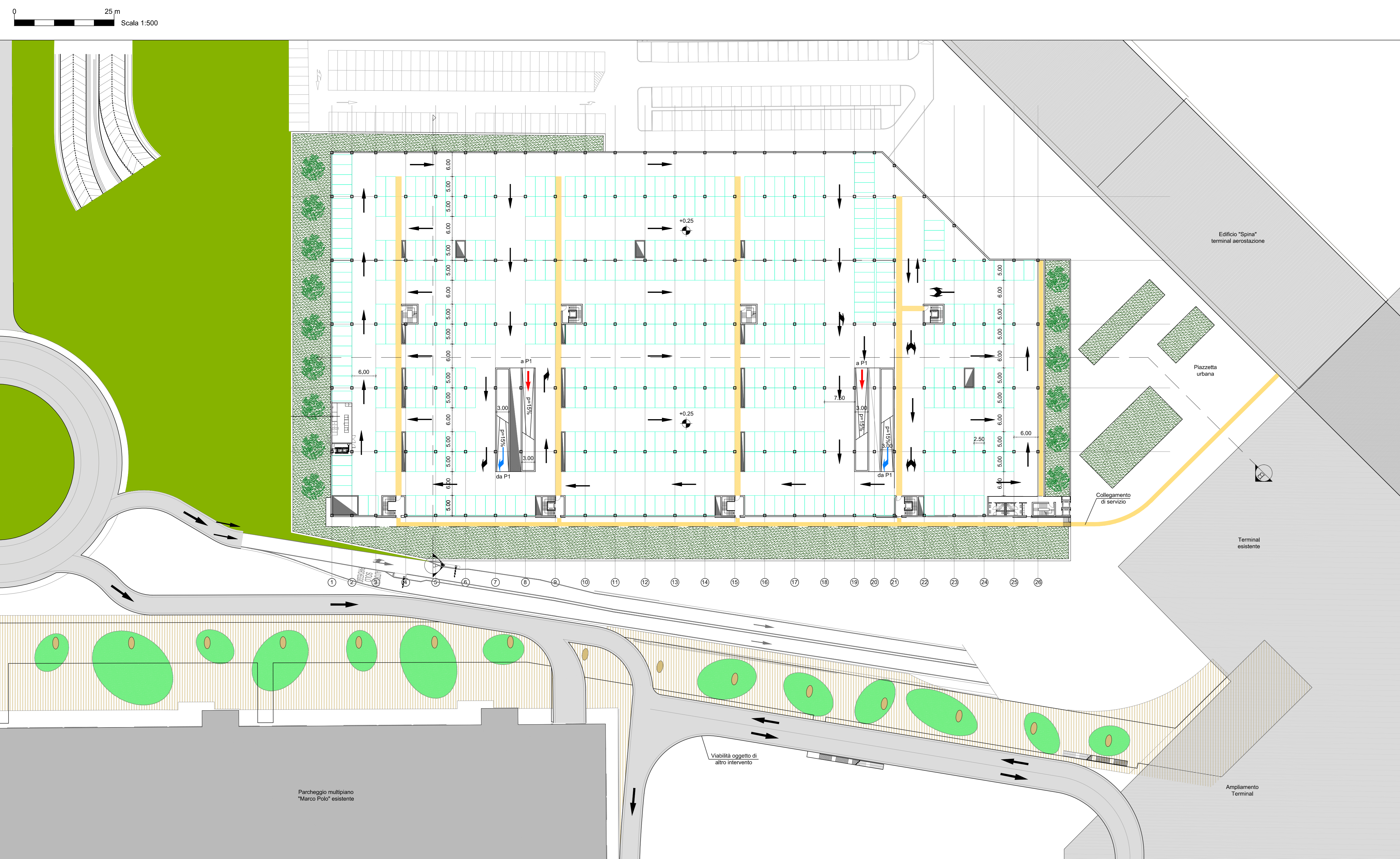
Pianta piano terra (quota +0.25)