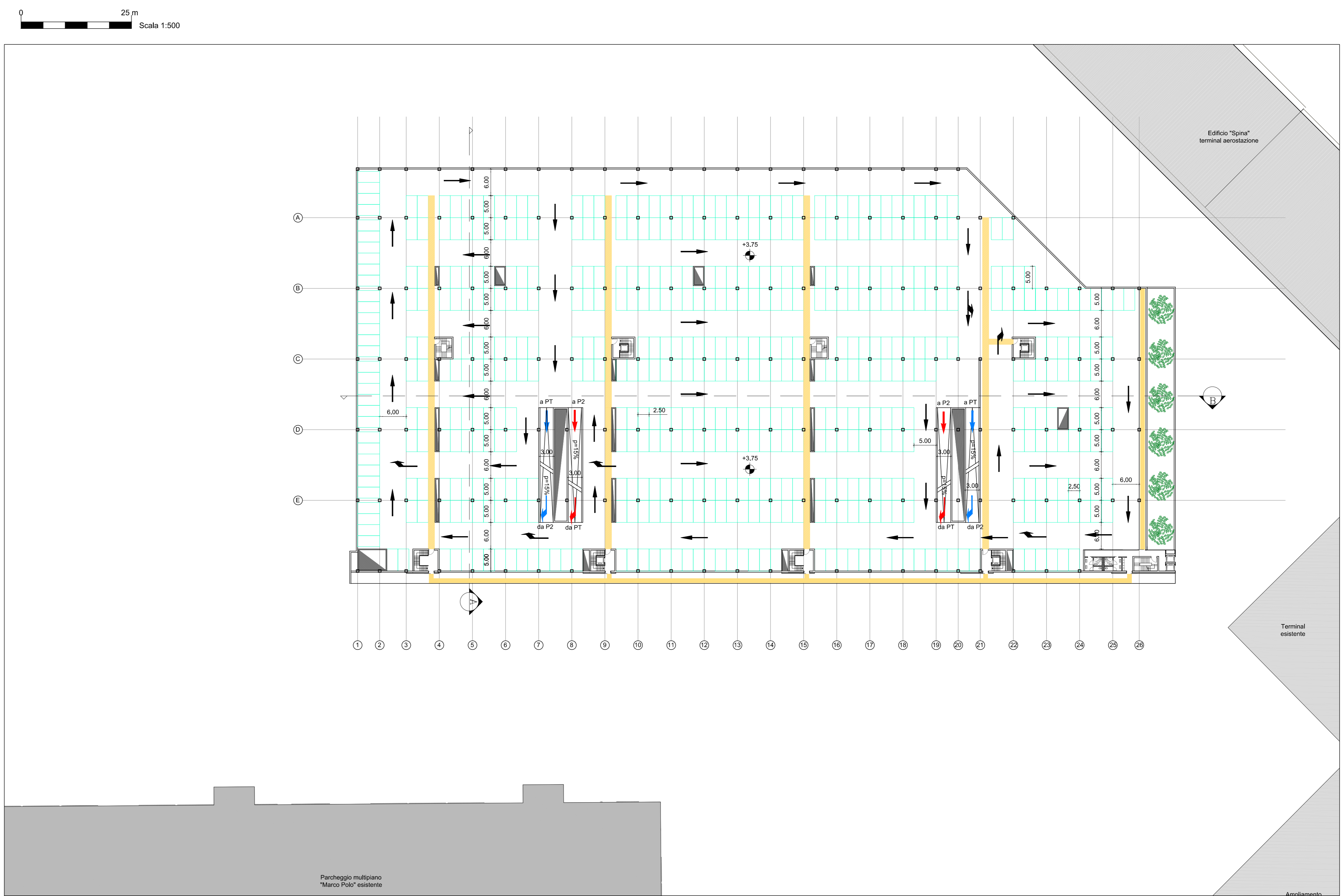
Pianta primo piano (quota +3.75)