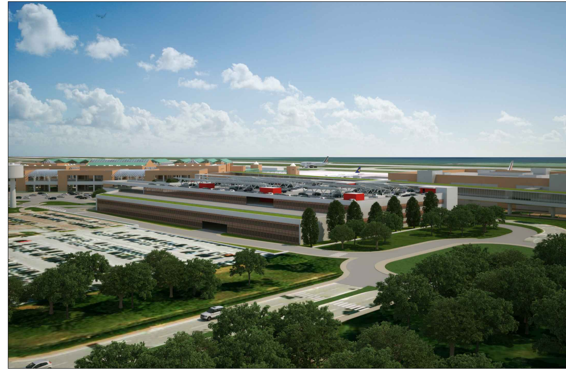
Vista prospettica facciata NW