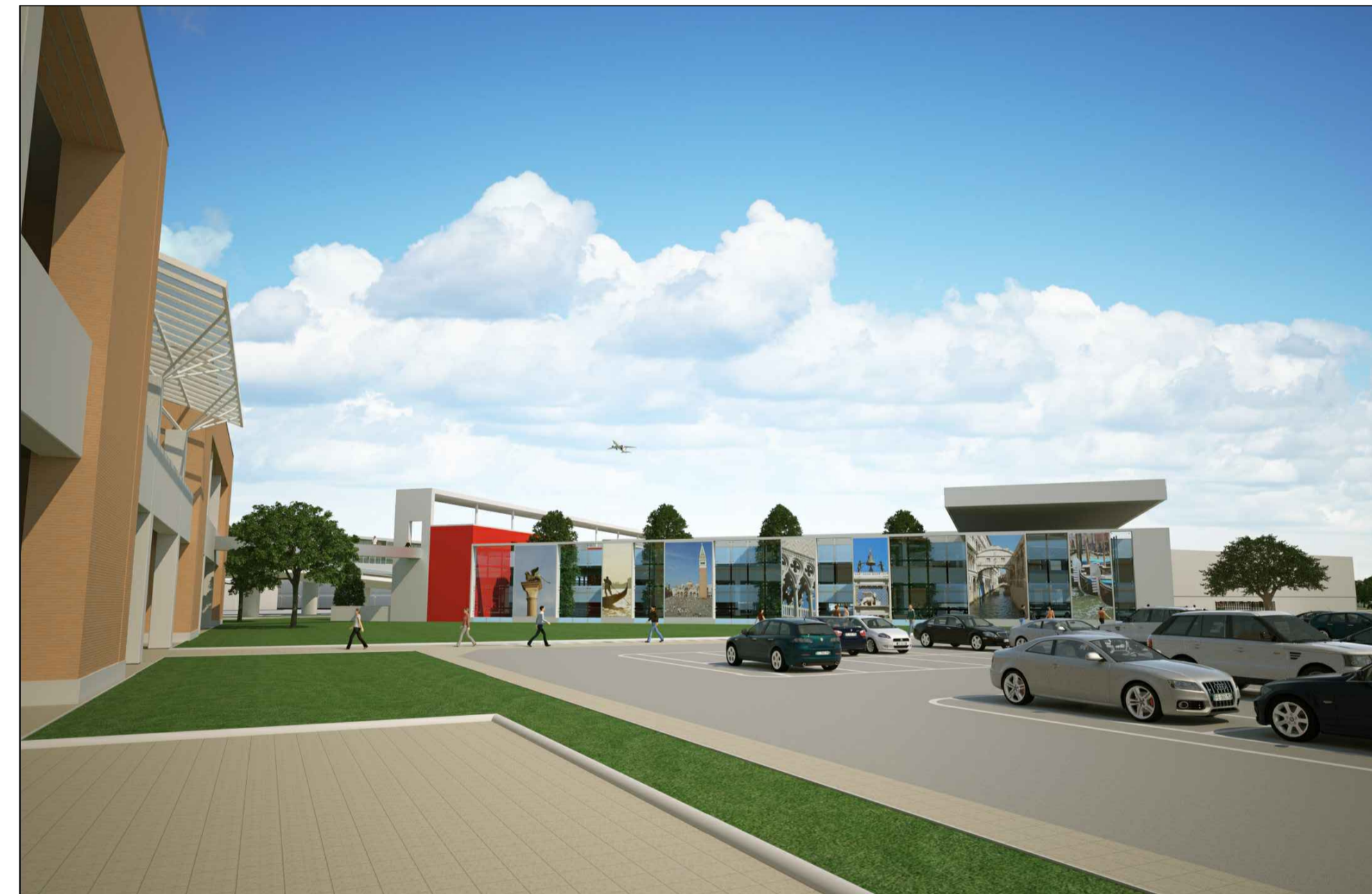
Vista prospettica facciata di comunicazione NE