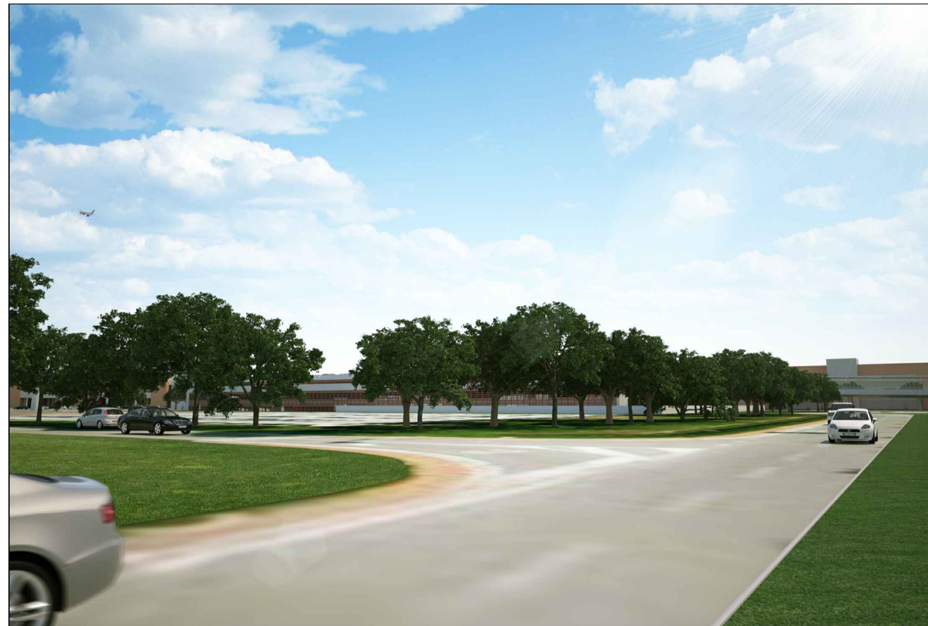
Vista prospettica da via Galileo Galilei facciata NW