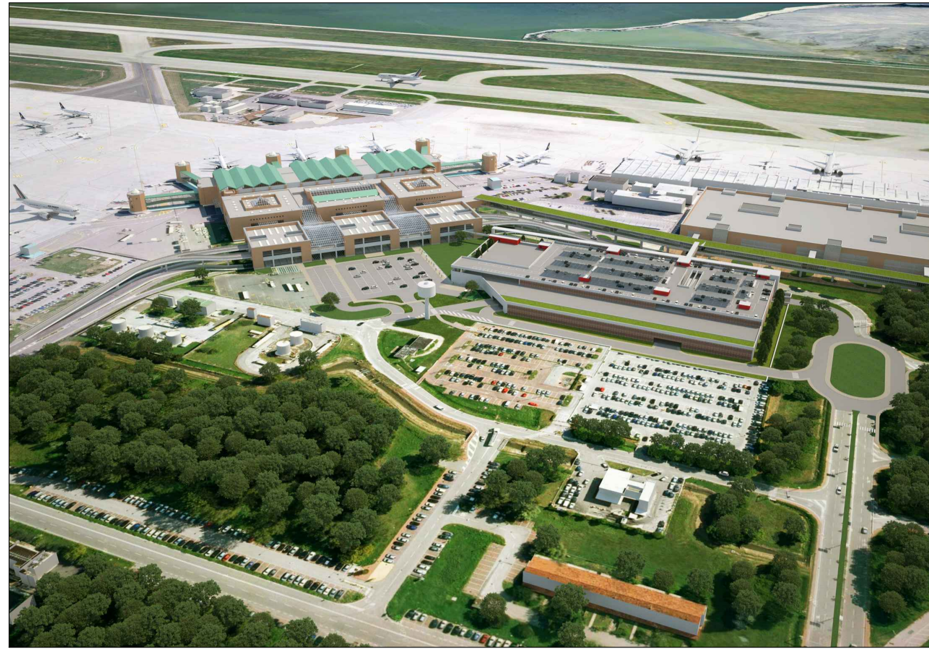
Vista aerea fase transitoria