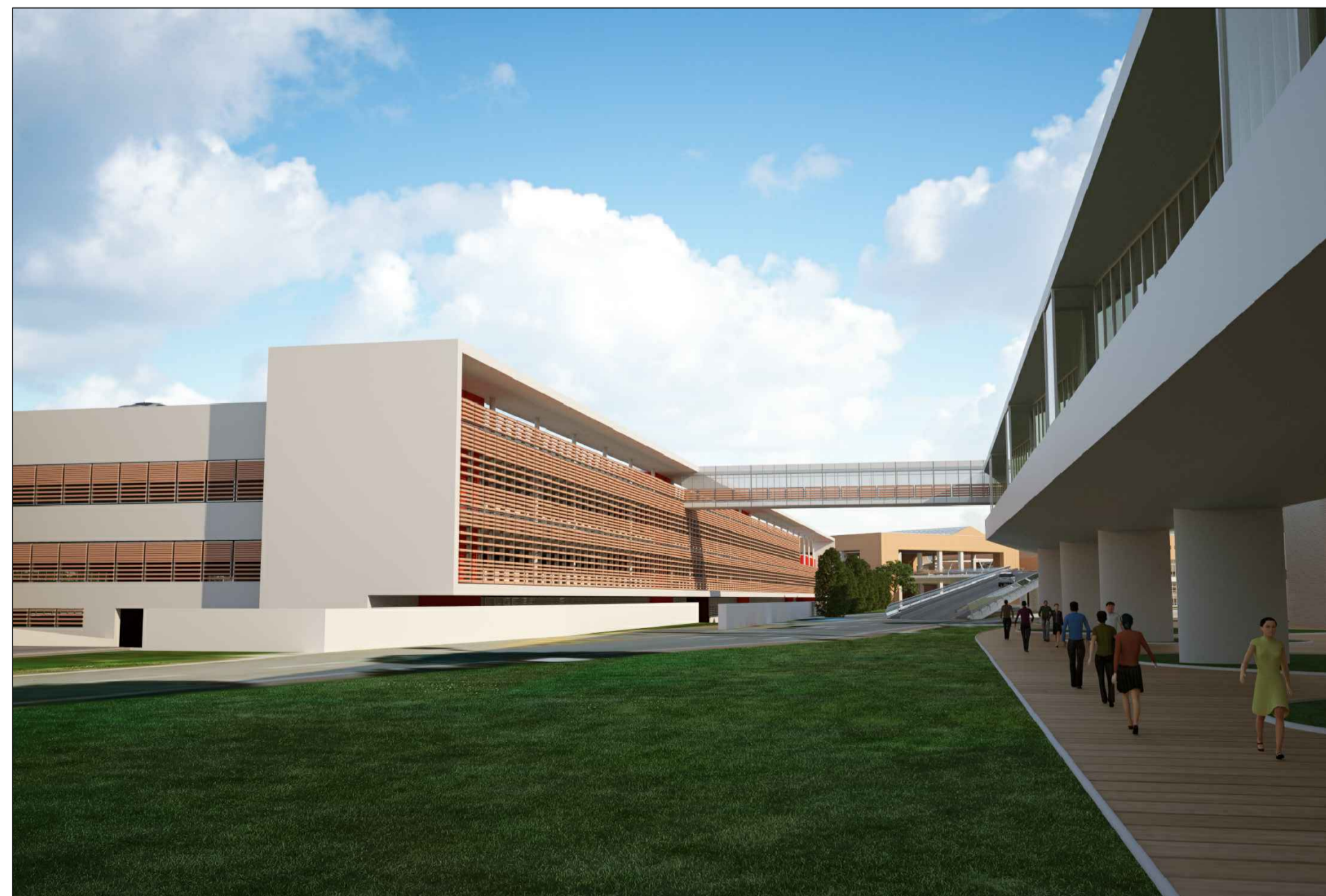
Vista facciata SE dalla darsena