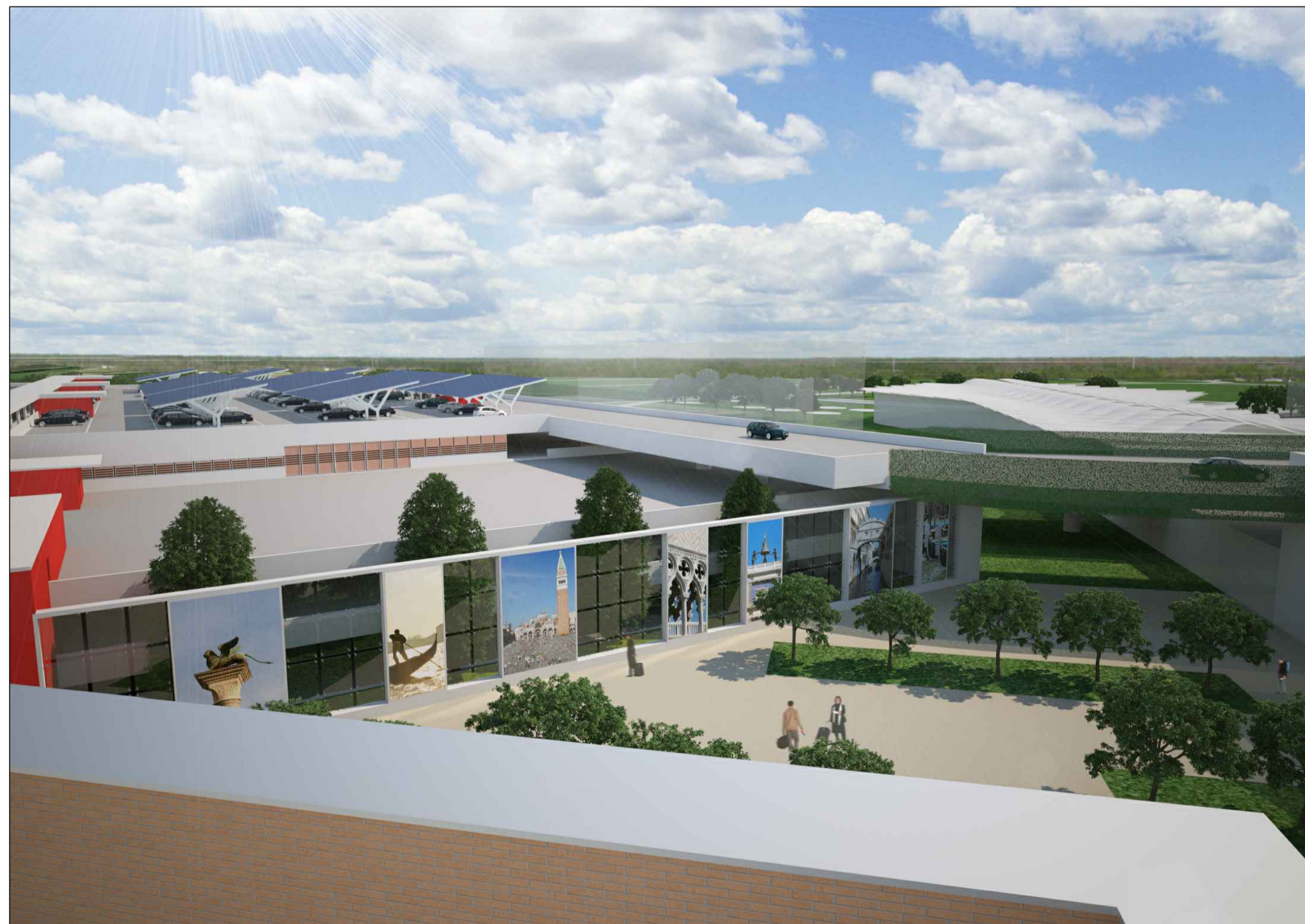
Vista prospettica facciata NE dal Terminal