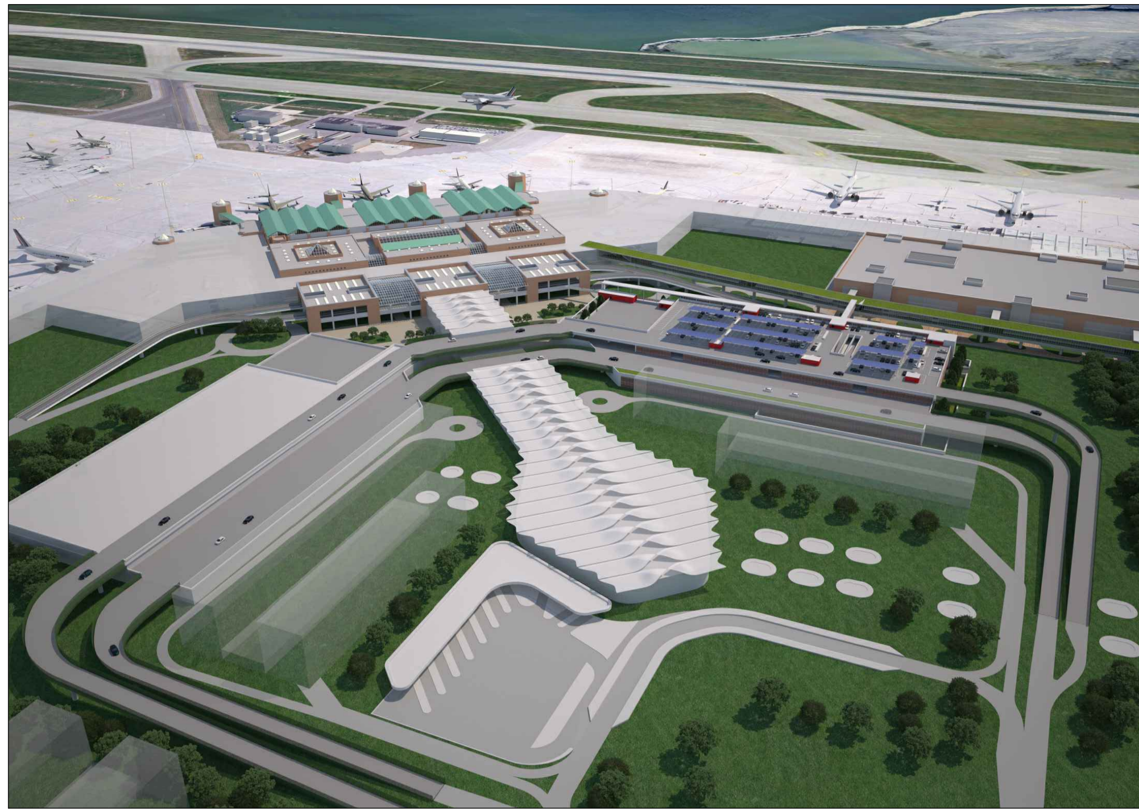
Vista aerea soluzione definitiva