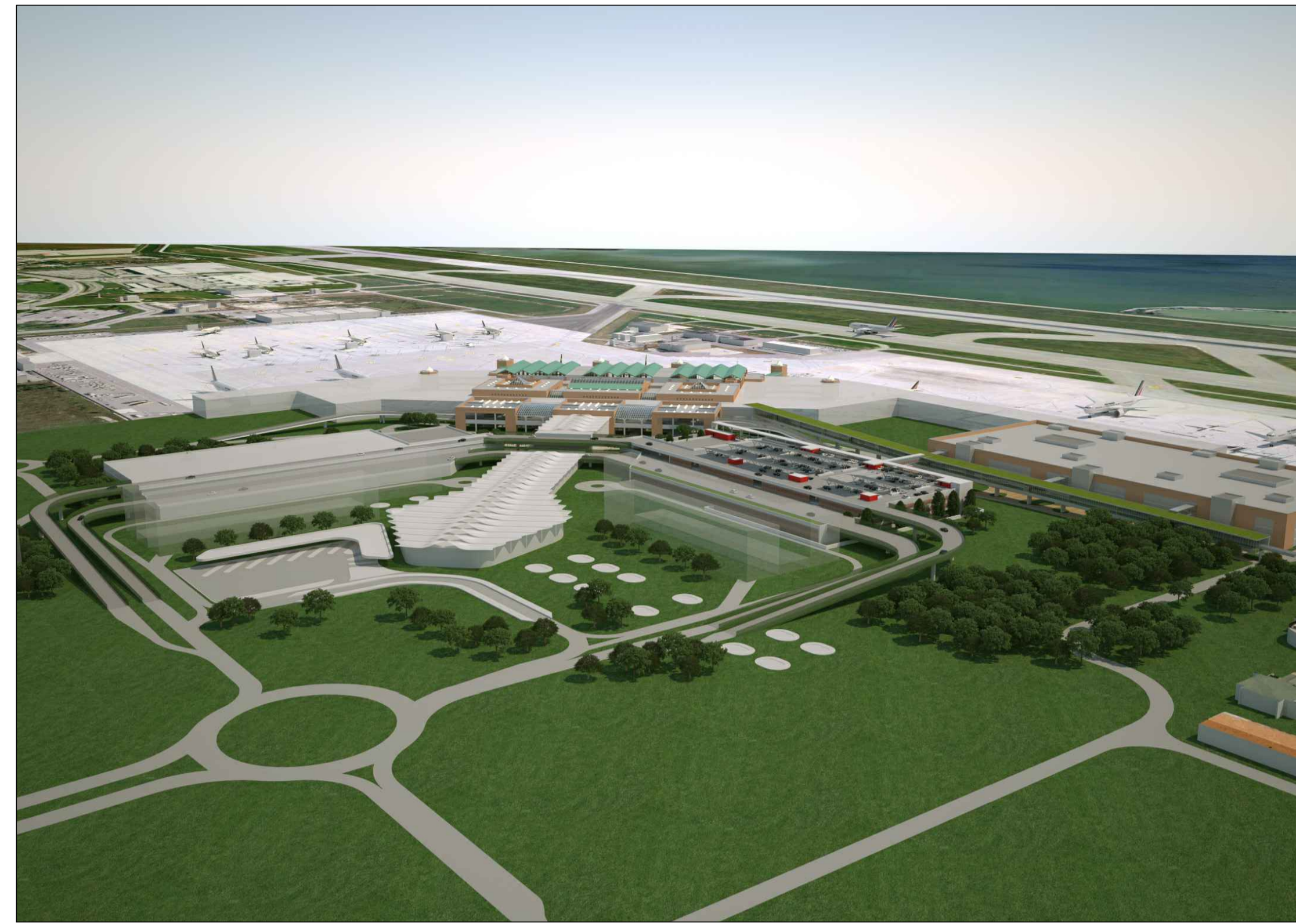
Vista aerea da SW soluzione definitiva