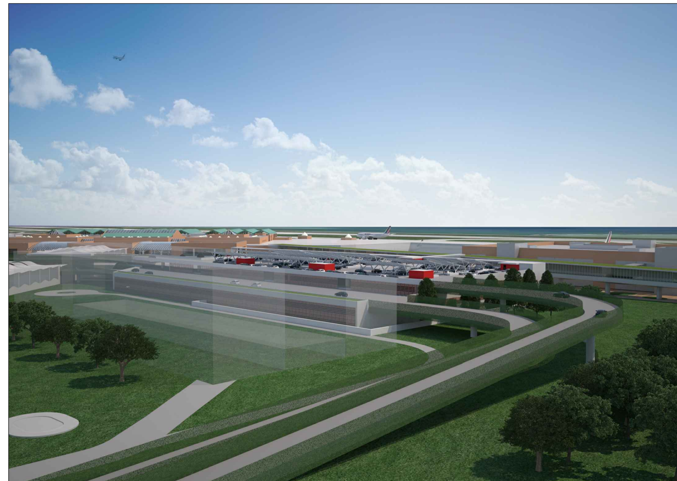
Vista ravvicinata aerea da SW soluzione definitiva