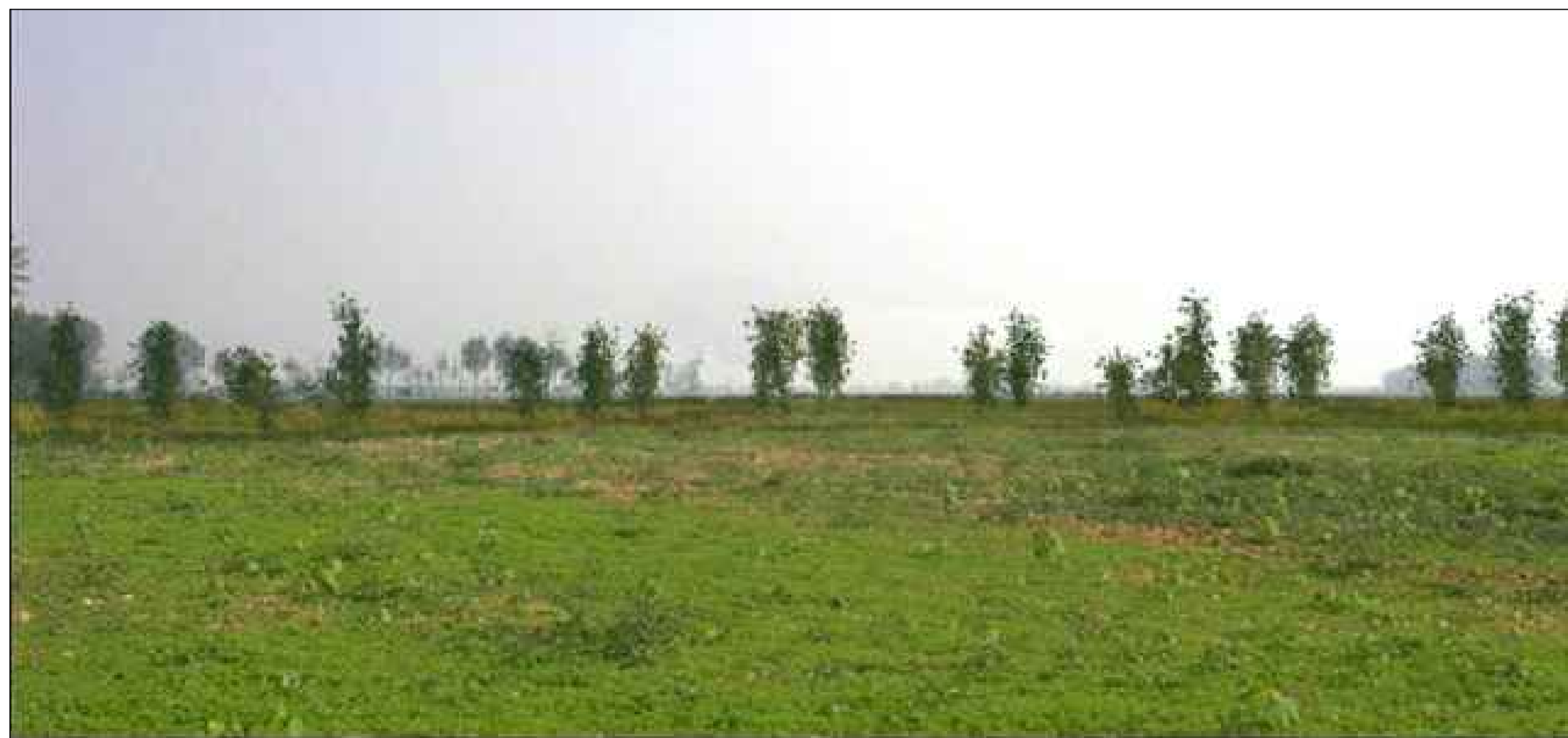
CAVA BS3B Vista da NORD OVEST Post Opera