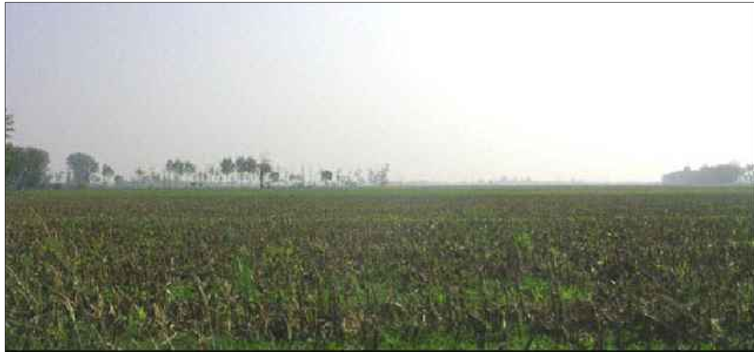
CAVA BS3B Vista da NORD OVEST Situazione attuale