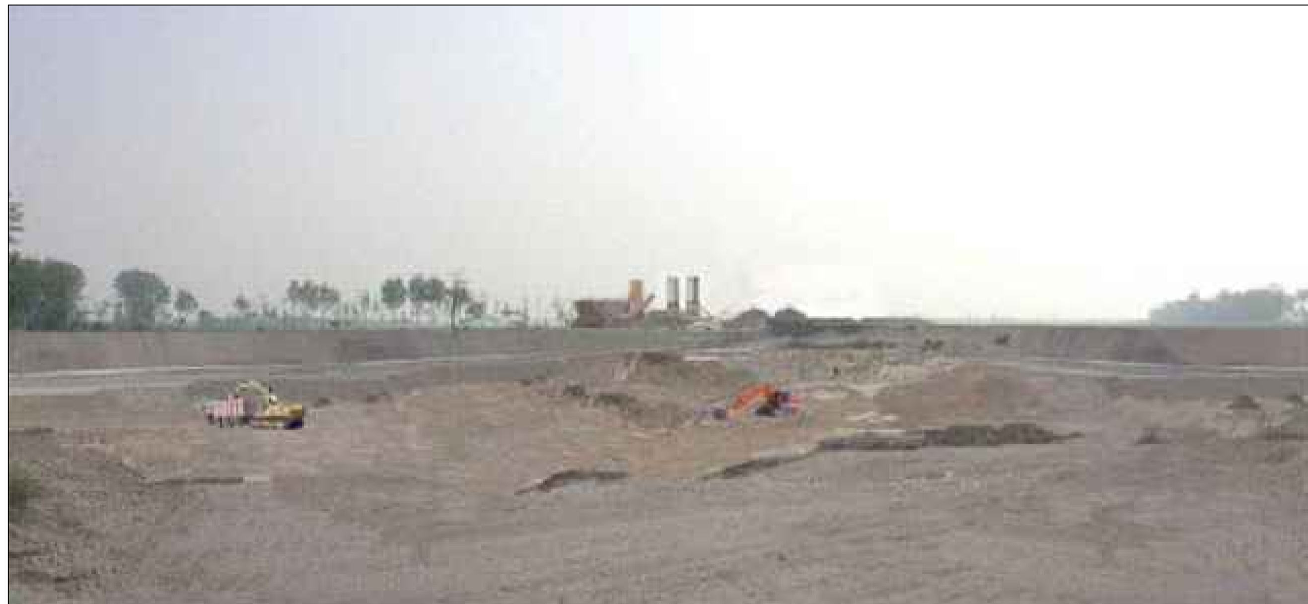
CAVA BS3B Vista da NORD OVEST In corso d'opera