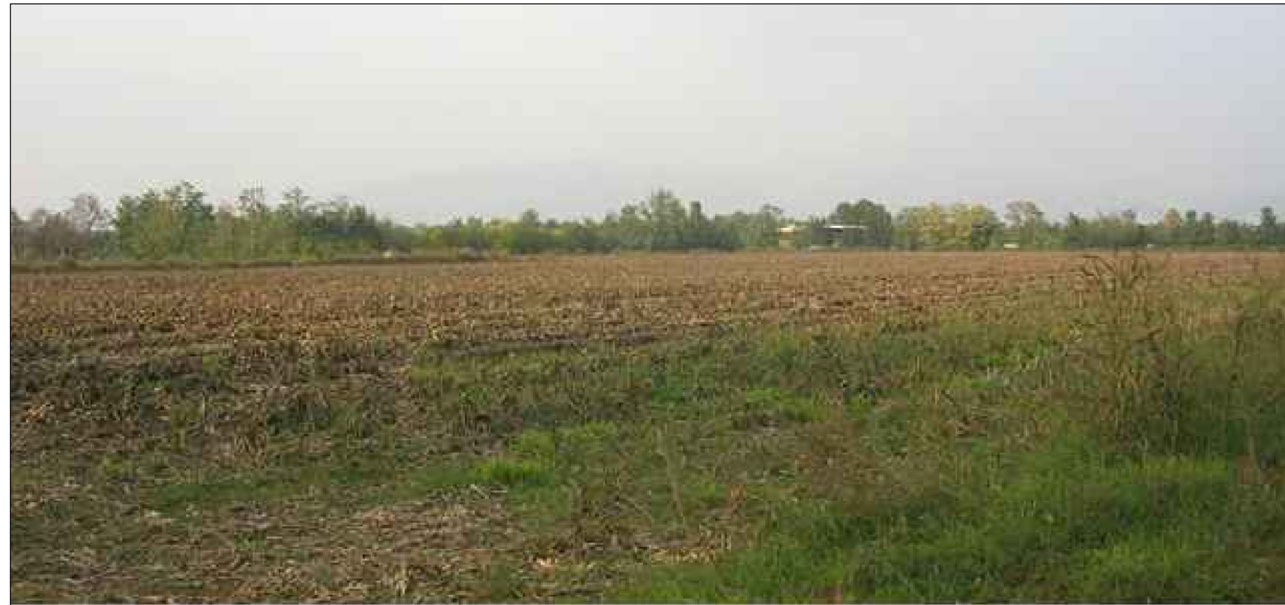
CAVA BS4 - Vista da SUD-EST Situazione attuale