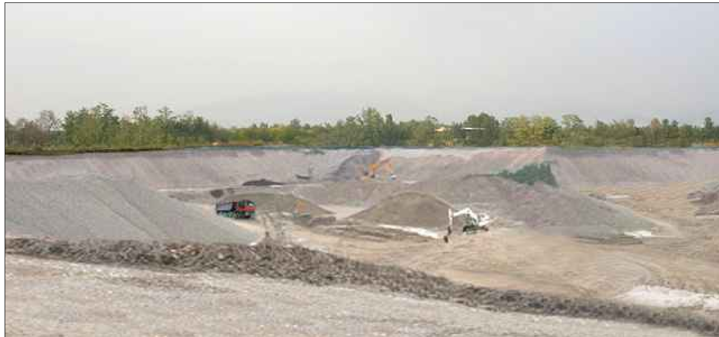
CAVA BS4 - Vista da SUD-EST In corso d'opera