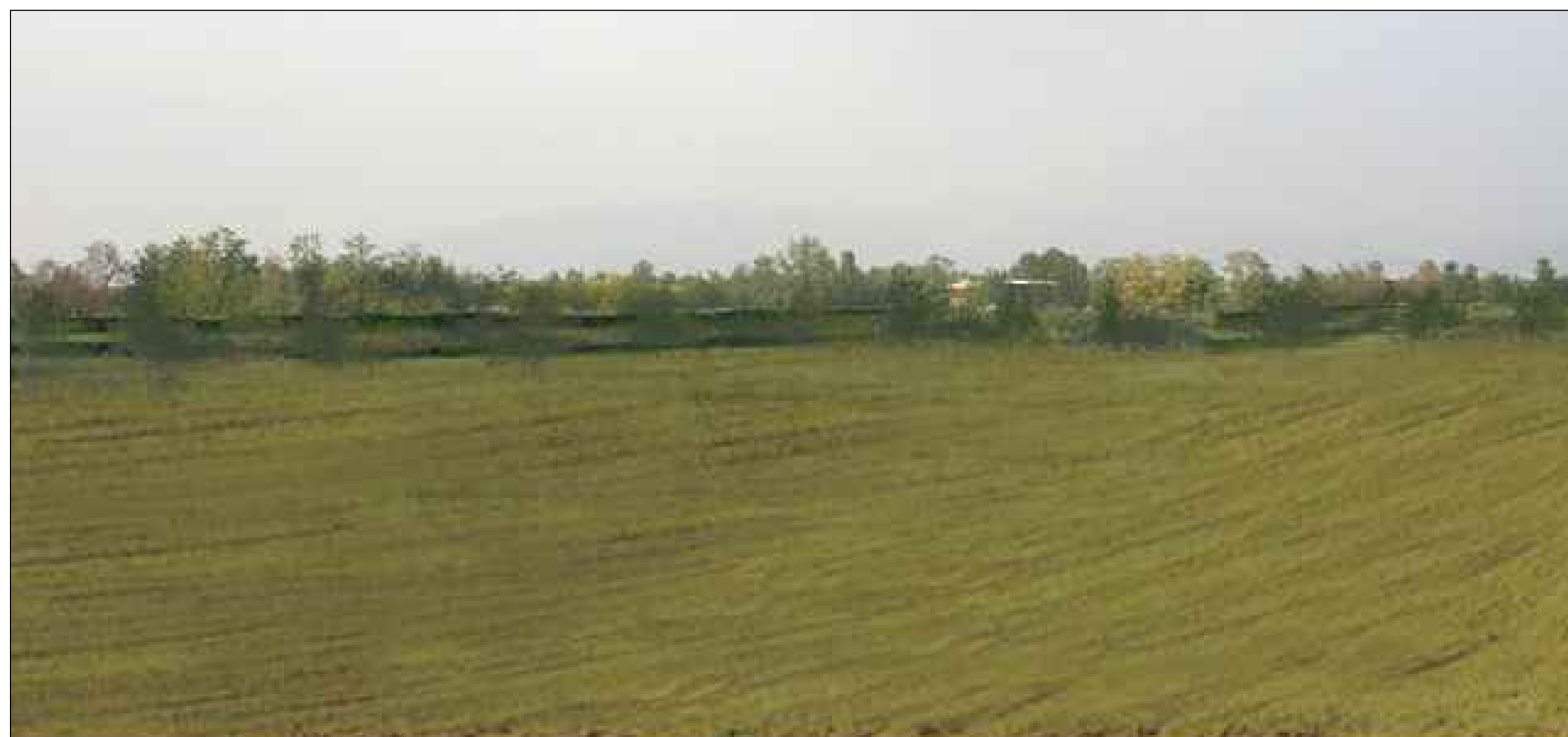
CAVA BS4 - Vista da SUD-EST Post-opera