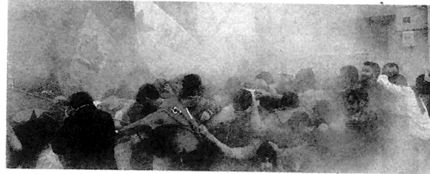
Un'immagine della protesta contro Erdogan a Istanbul