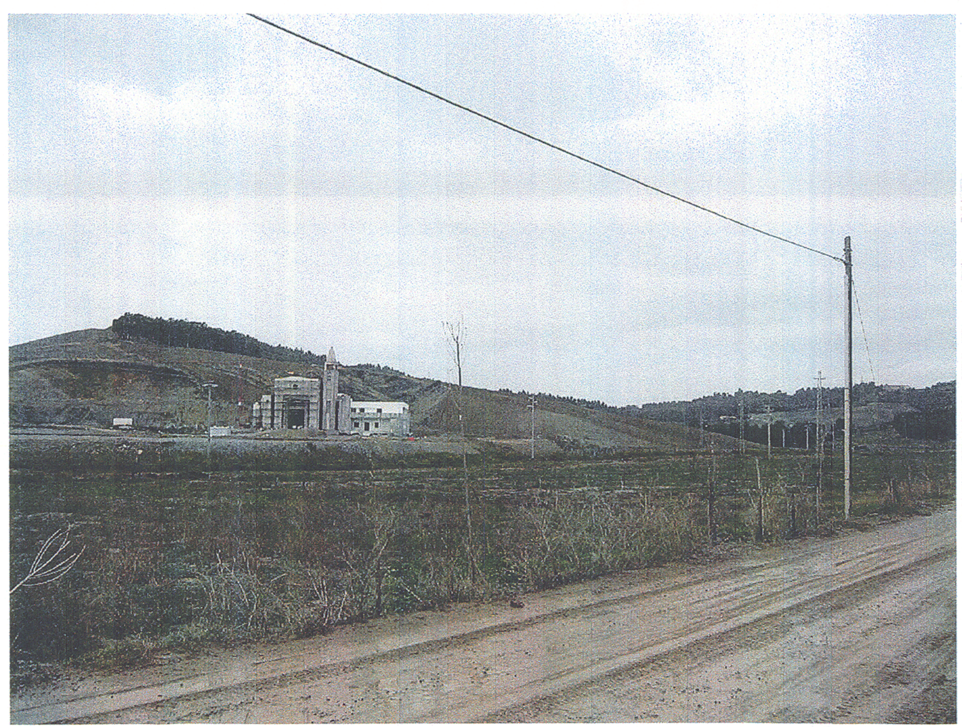
FOTOGRAFIA ANTE OPERAM