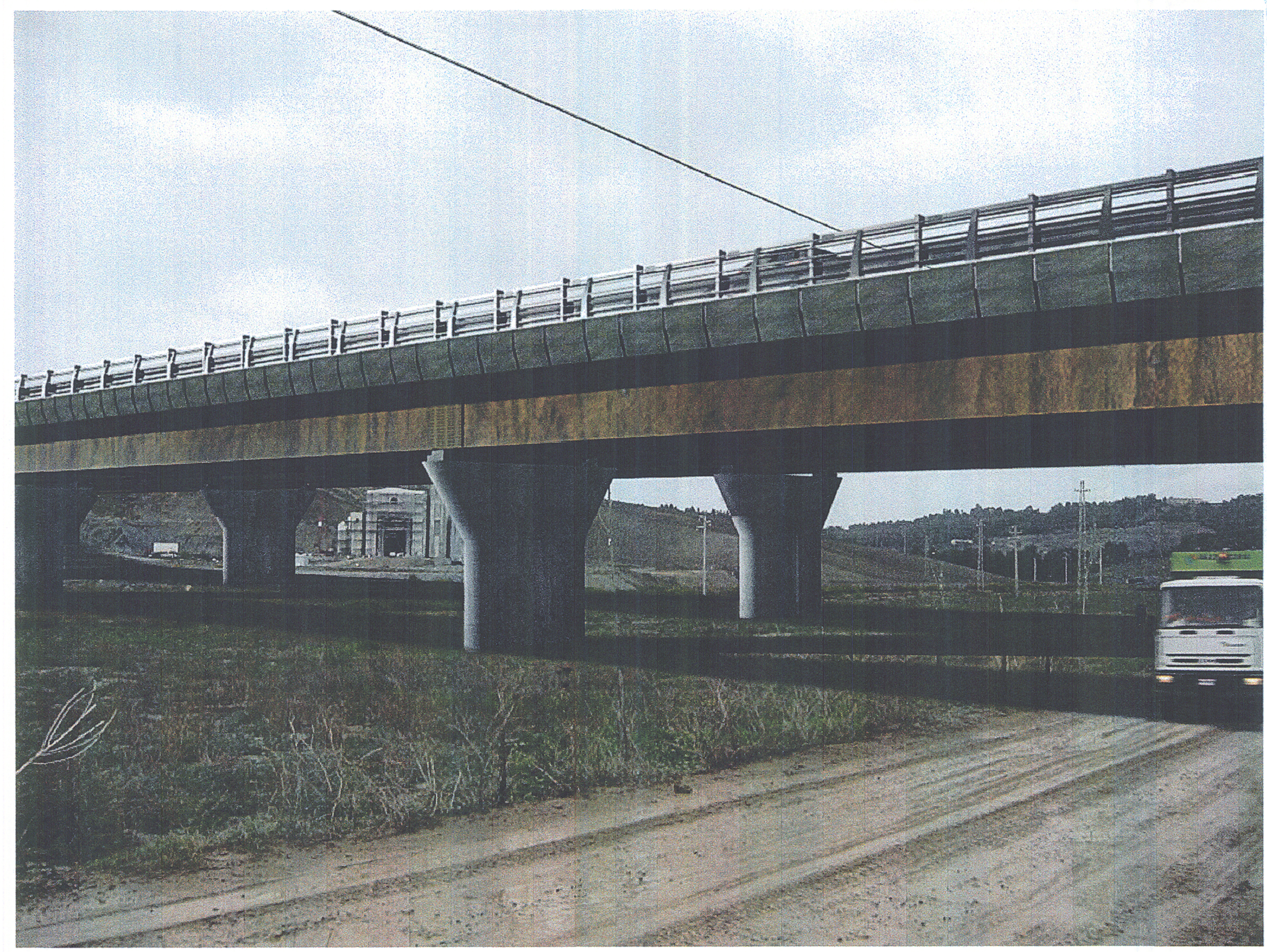
FOTOSIMULAZIONE POST OPERAM