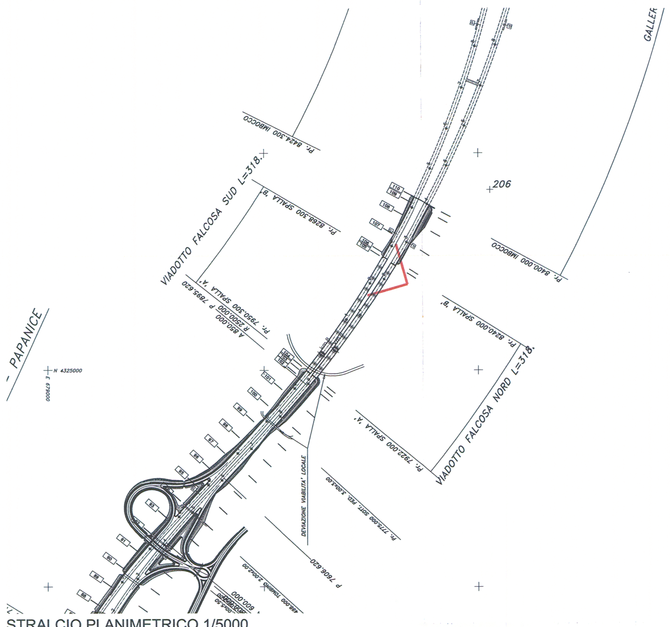
STRALCIO PLANIMETRICO 1/5000