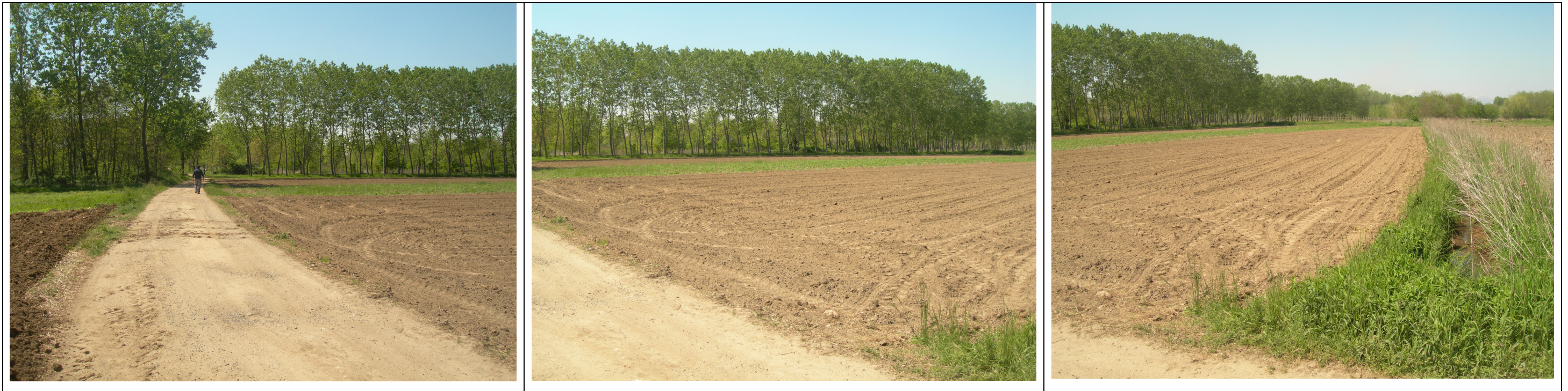
Foto 1. Panoramica dell'area della futura postazione Carpignano Sesia 1 Dir dalla roggia che ne costeggia il lato Est. Direzione di scatto Nord – Ovest