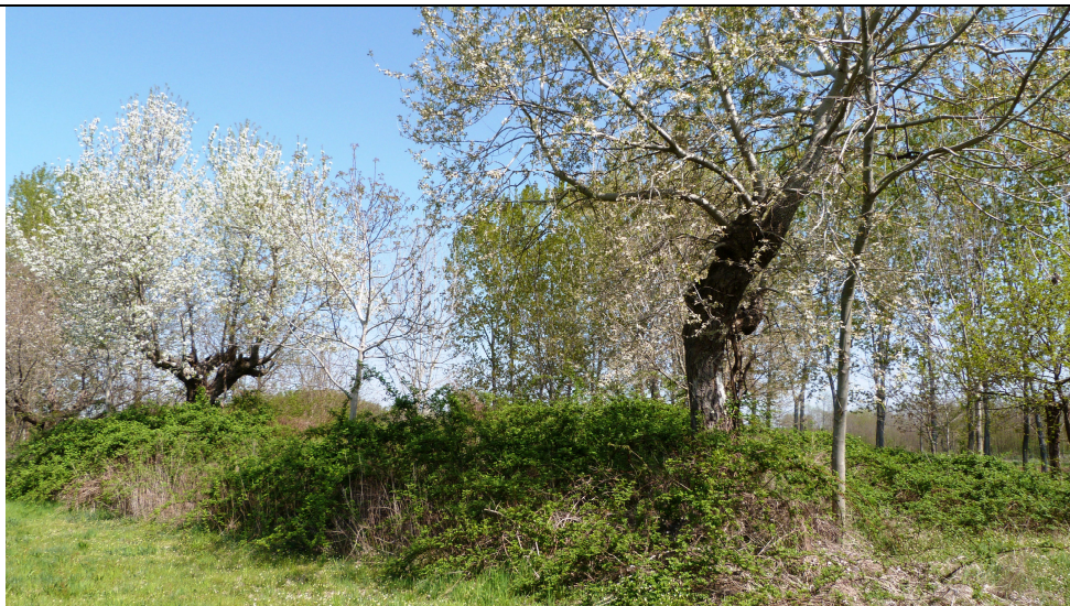
Foto scattata dal centro dell'area della futura postazione, con direzione di scatto Nord - Est.

Dettaglio di alcune specie arboree (ciliegio selvatico) presenti al centro della postazione.