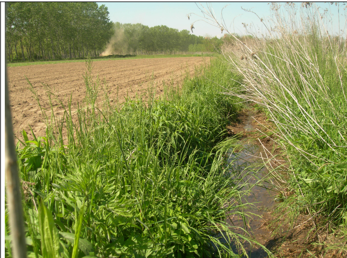
Foto scattata dall'angolo Sud – Est del perimetro della futura postazione, con direzione di scatto Nord - Est

Dettaglio della roggia che costeggia il lato Est della futura postazione con una esigua presenza di acqua durante il sopralluogo dell'Aprile 2014.